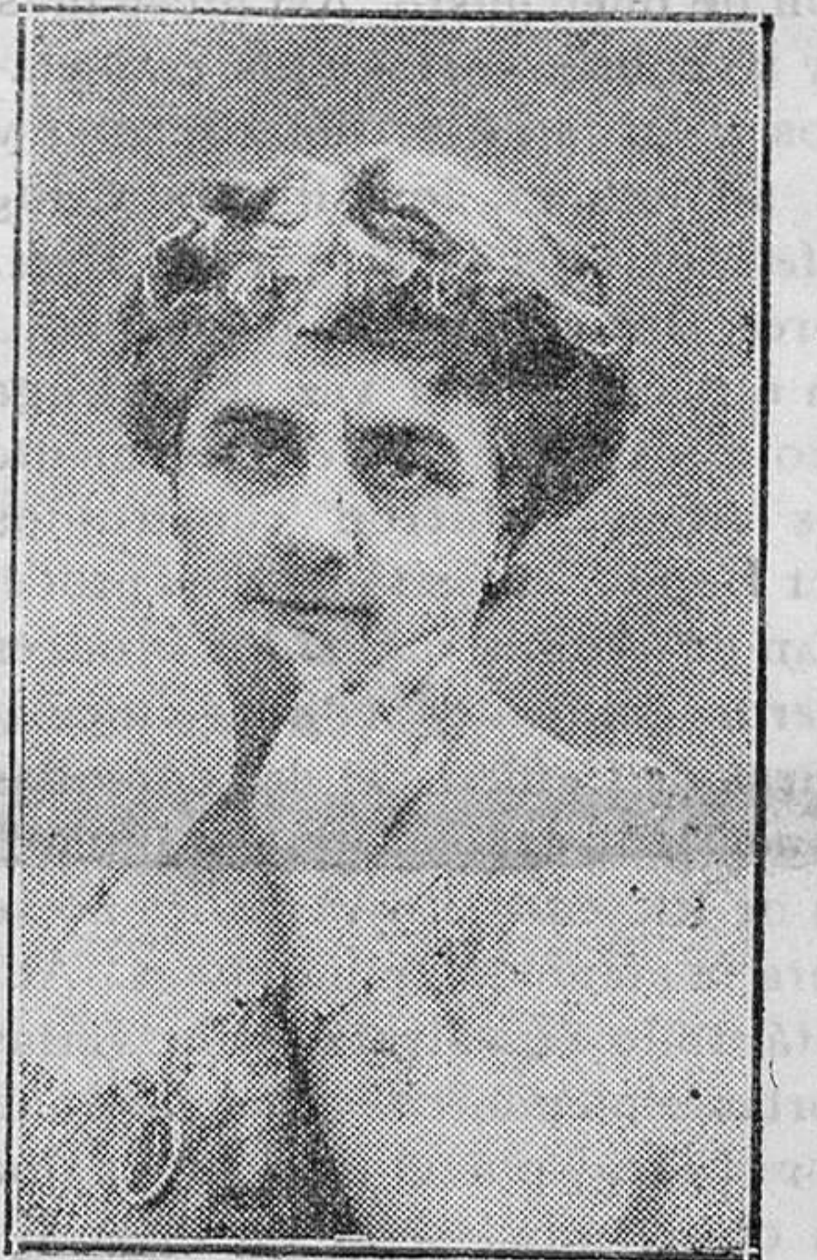
ROSARIO PINO.—La ilustre actriz que falleció recientemente en Madrid.

Las víctimas del Sagrado Corazón mueren exclamando: Dios no