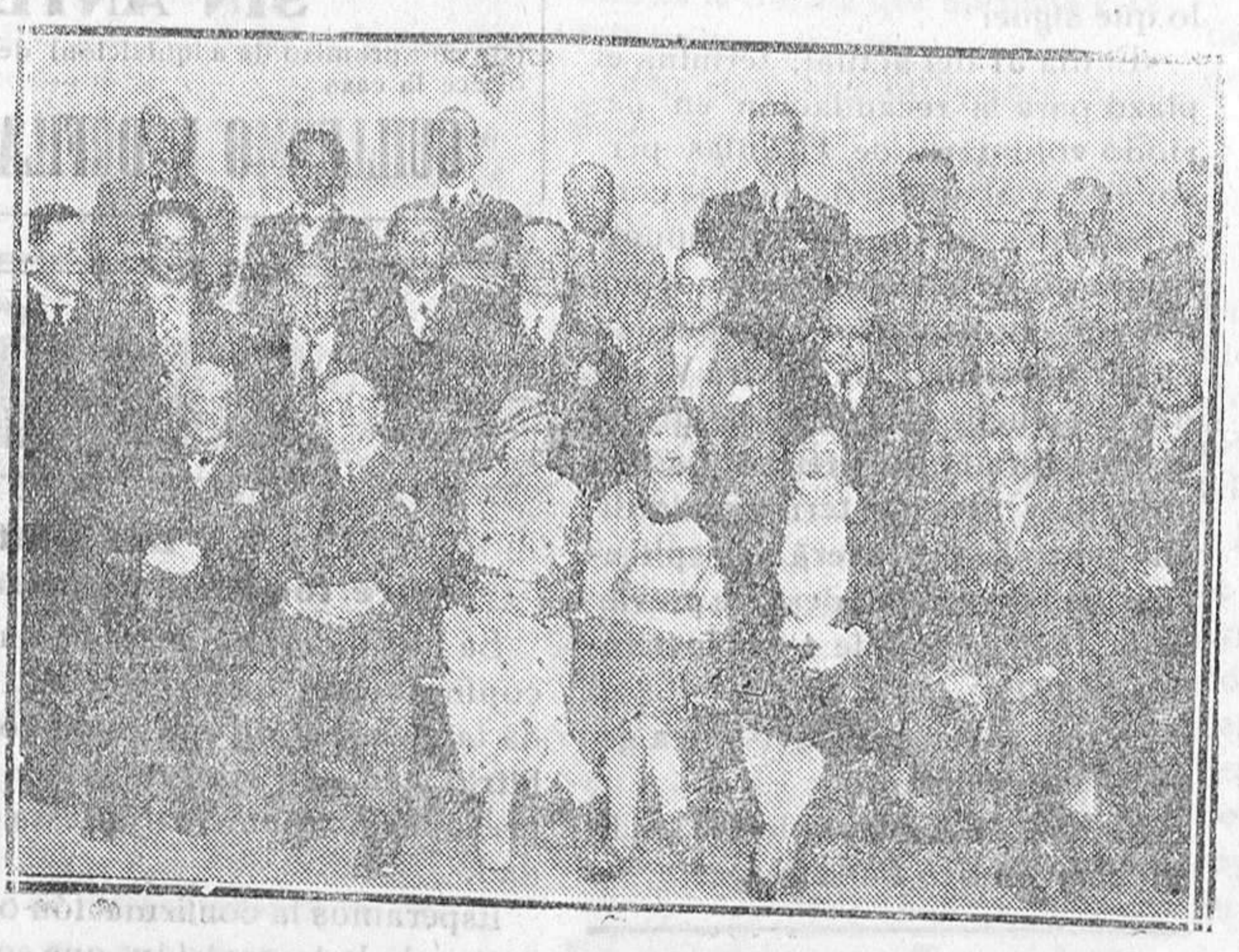
SALAMANCA. — Periodistas extranjeros en su visita a dicha población, acompañados por algunos periodistas salmantinos