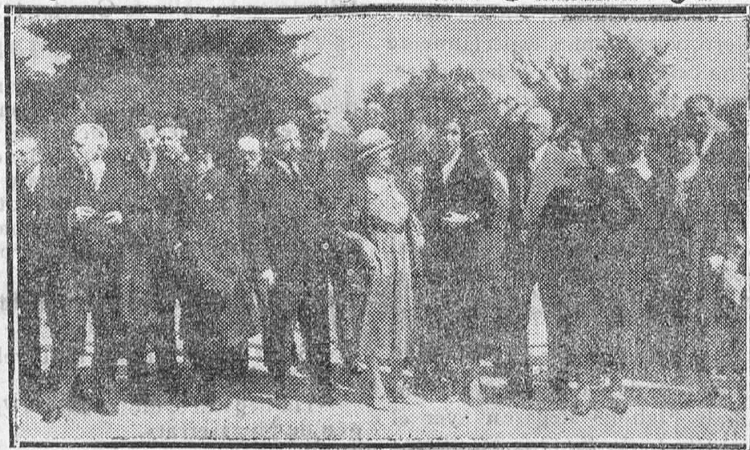
En la Zarzuela (El Pardo).—Los ministros de Estado e Instrucción con los miembros del Comité de Artes y Letras de la Sociedad de Naciones