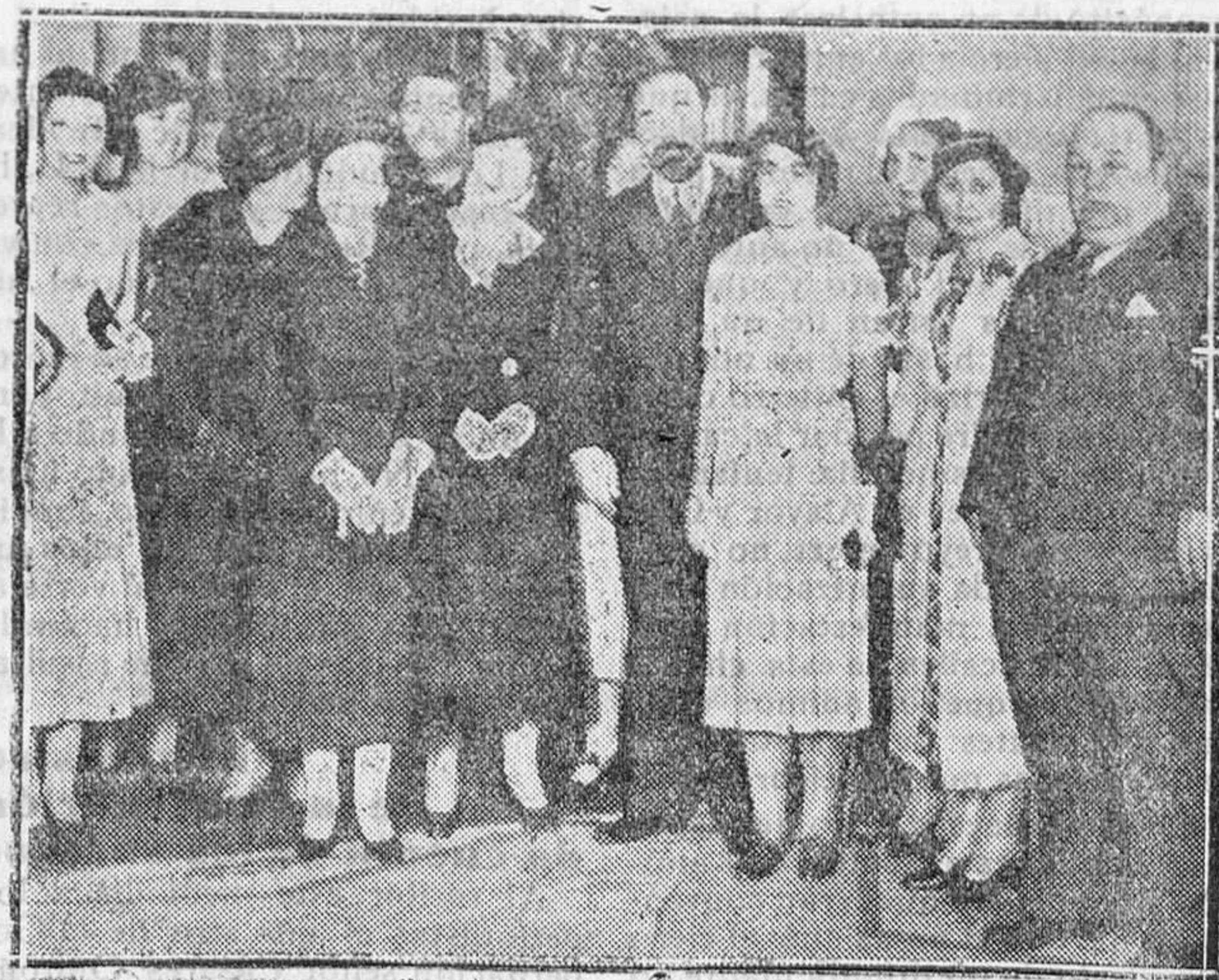
MADRID.—Inauguración de la Exposición de la Biblioteca Infantil.