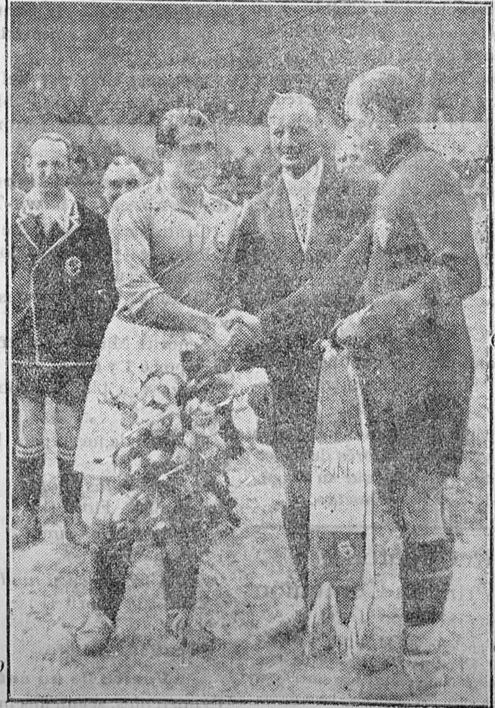
PARIS. — Stadium de Colombes. — Los capitanes de los equipos de futbol francés y español antes de comenzar el partido, en el que ganaron los franceses por 1 a 0

Todo esto y algo más significa nuestro voto al defender los postulados de RELIGIÓN, PROPIEDAD, FAMILIA y ORDEN SOCIAL, base de nuestro credo en la hora presente.