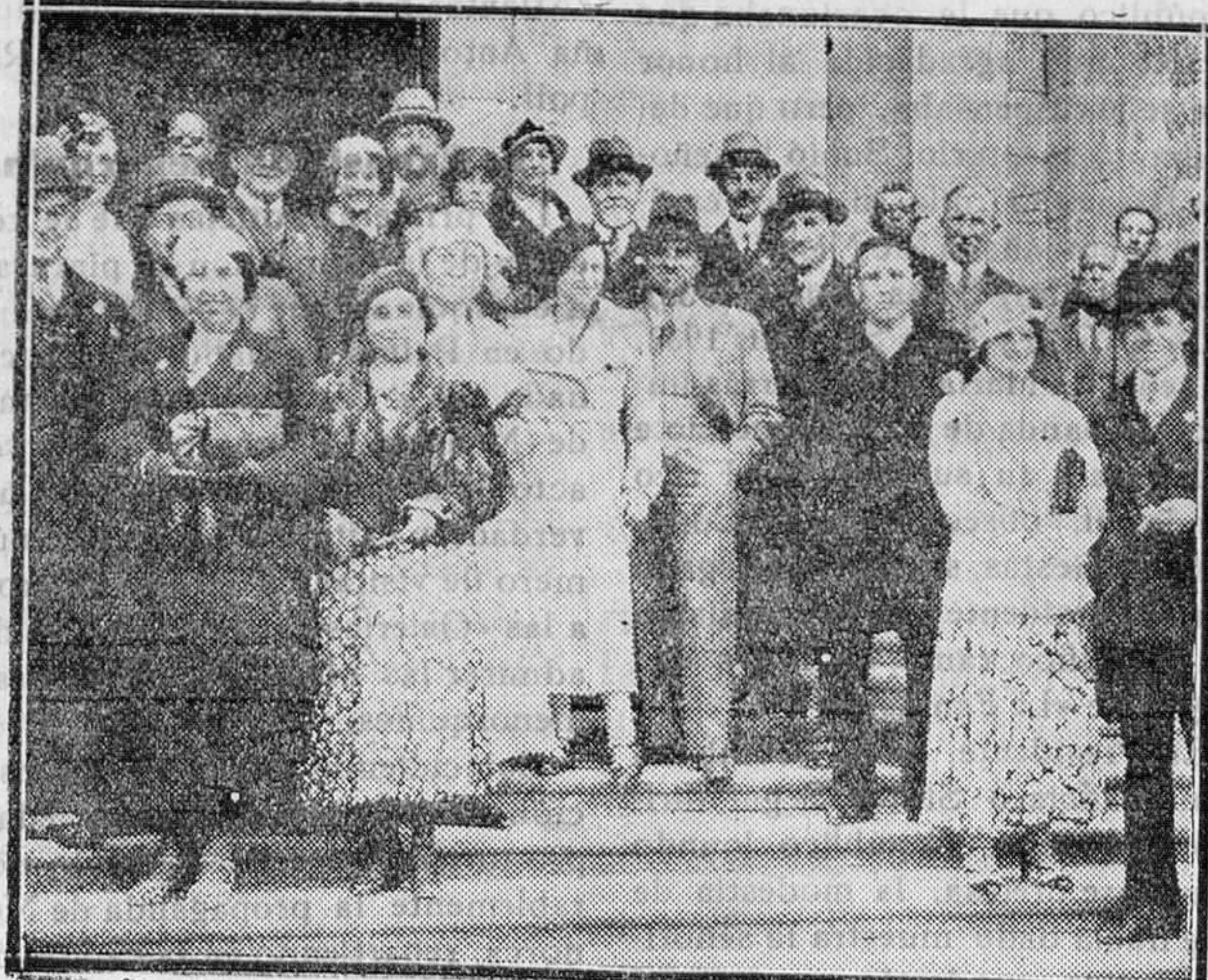
MADRID.—Grupo de oficiales franceses que acompañados de sus familias visitaron el Museo del Prado