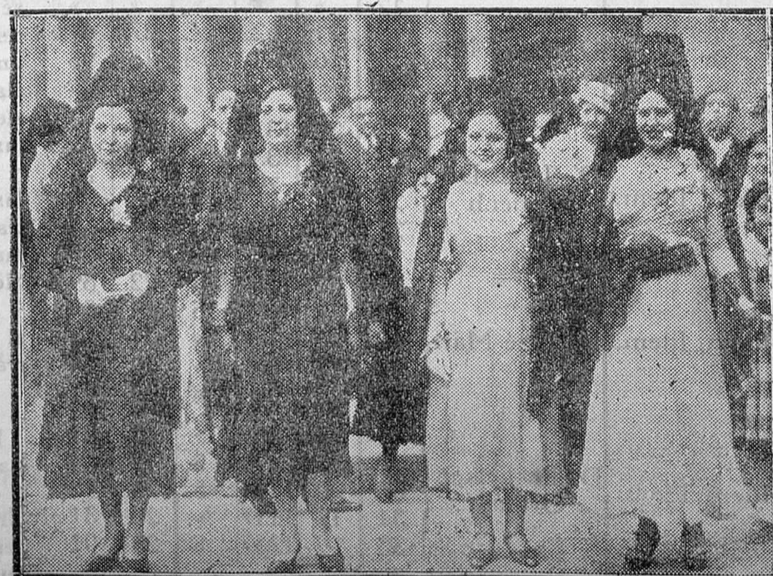
SEMANA SANTA EN MADRID. — Distinguidas señoritas luciendo la clásica mantilla después de su visita a los Sagrarios