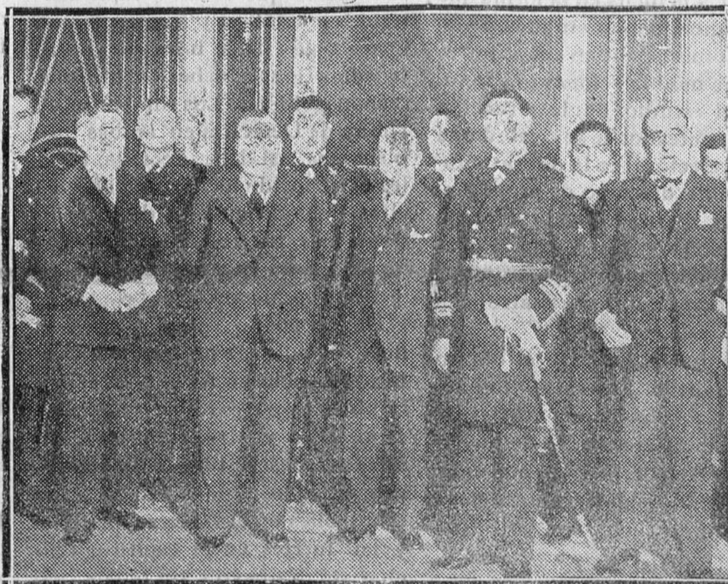
He aquí al ministro de Marina con el embajador de Méjico y la comisión naval mejicana que ha venido a España para tratar con el Gobierno de la construcción de barcos para aquella República en los astilleros españoles