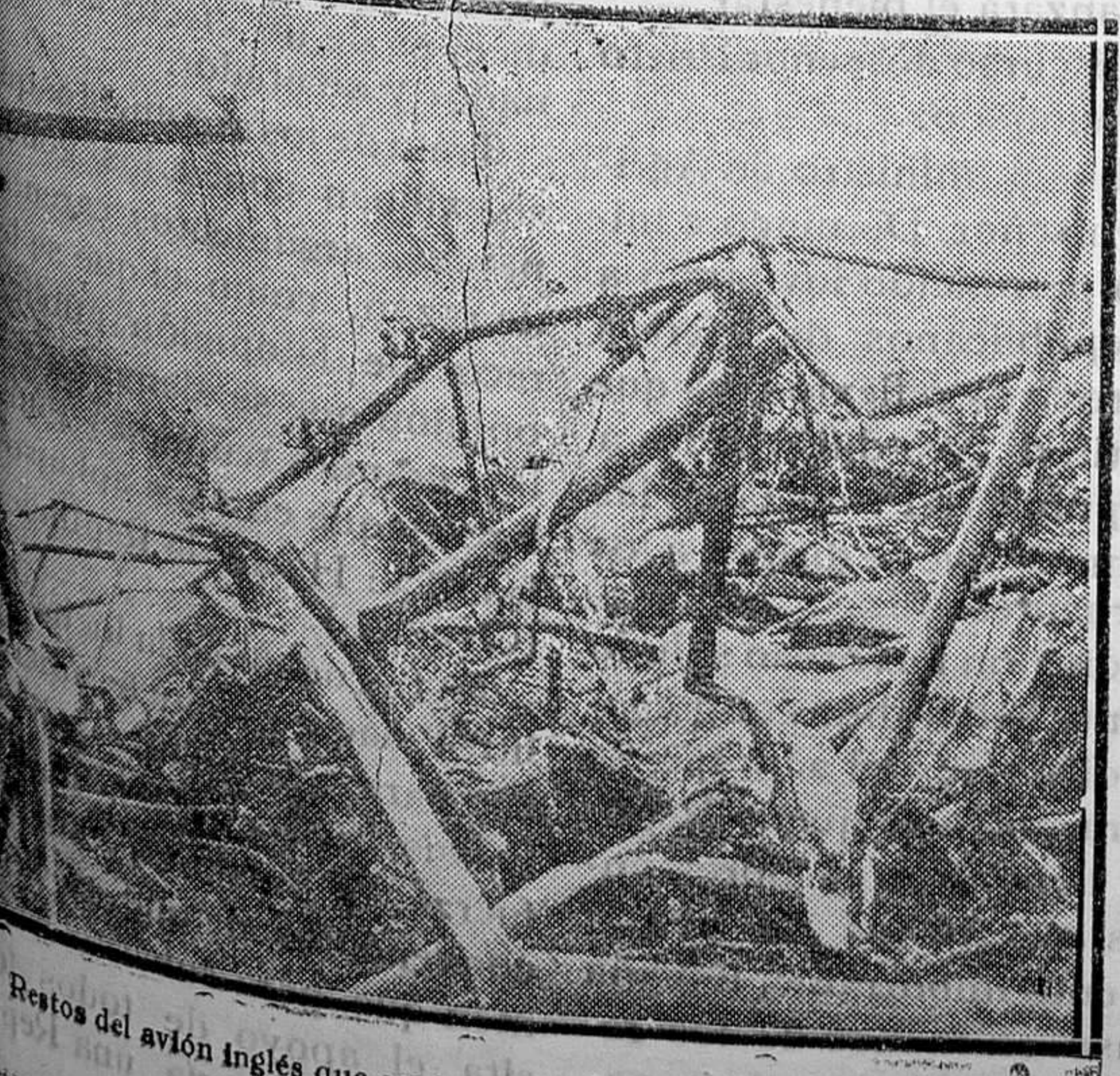
Restos del avión inglés que cayó cerca de Bruselas, incendiándose