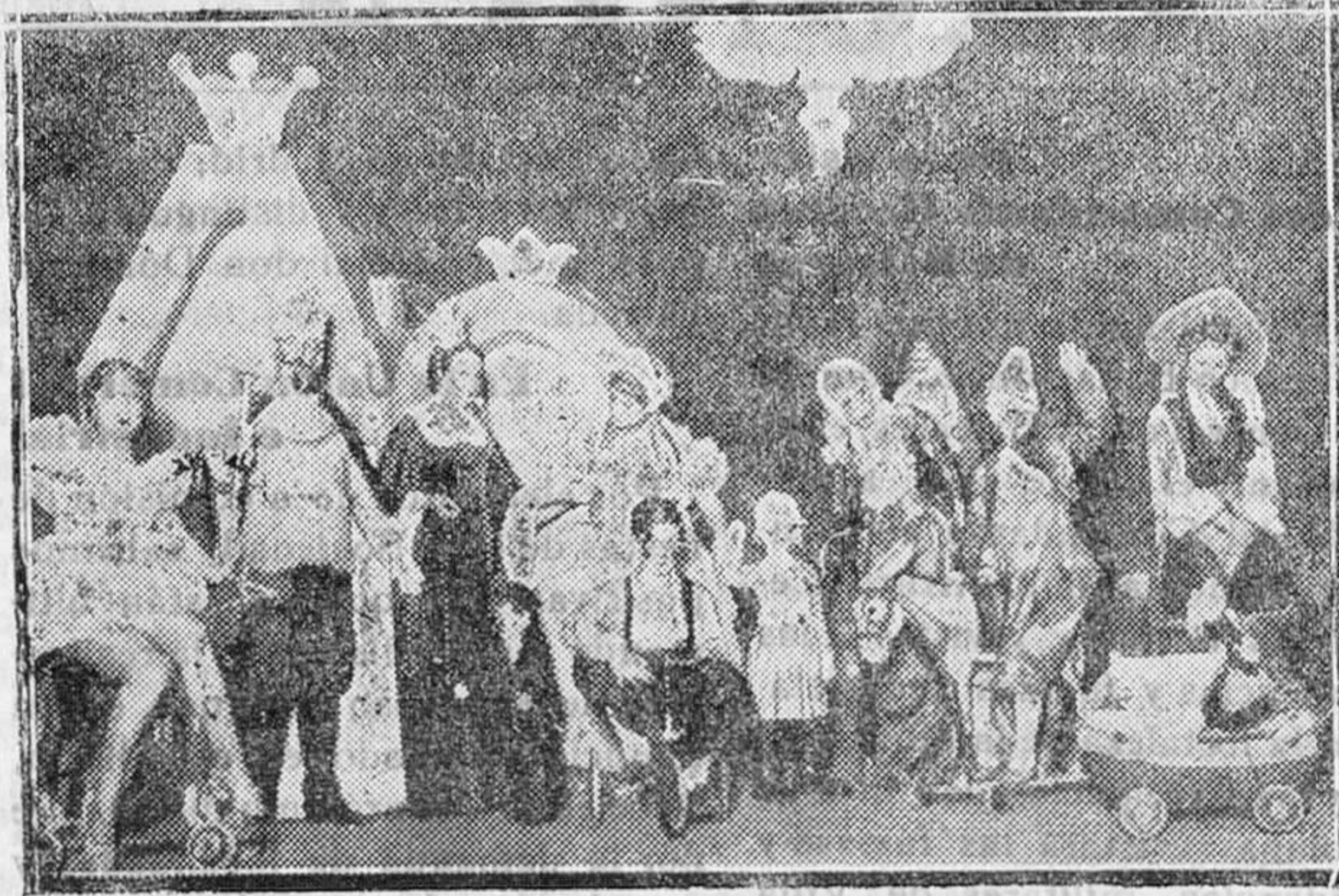
TEATRO BEATRIZ. — Una escena de la graciosa y conmovedora obra, representada con enorme éxito en dicho teatro, «Pinocho en el país de los juguetes»