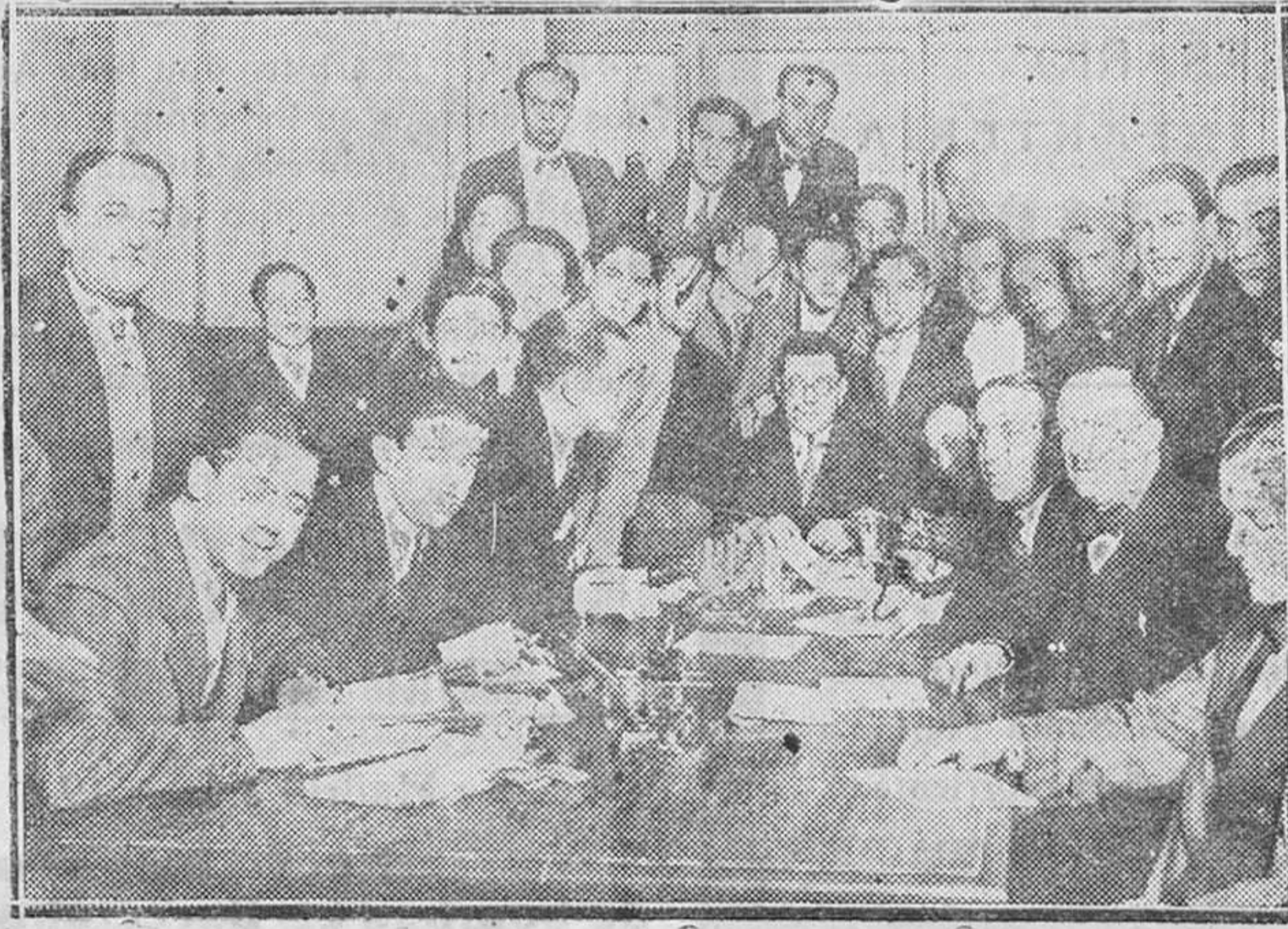
MADRID. — Los periodistas en Teléfonos esperando el sorteo de Navidad para dar cuenta en la prensa de Madrid y provincias