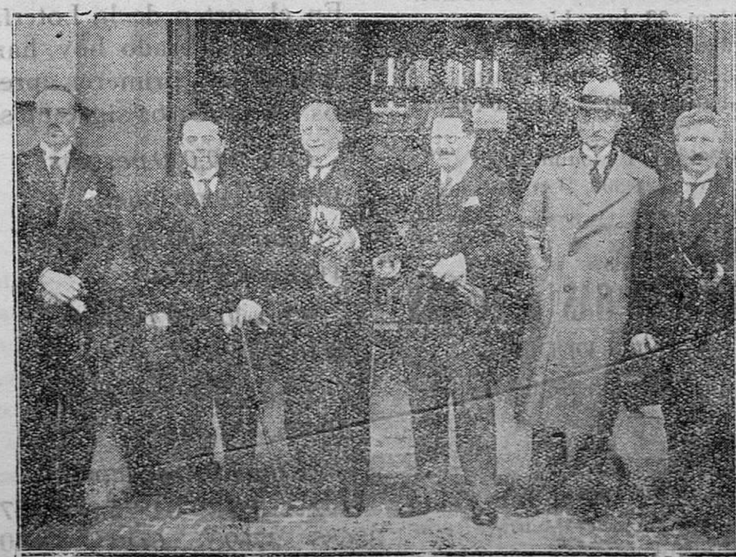
M. DE BROCCOU VILLE HA FORMADO EL MINISTERIO BELGA Miembros del Mini terio, después de haber prestado juramento ante el Rey: de izquierda a derecha, M. Van Zeelande, M. Boreesse, M. de Brocqueville, M. Inglenbeeck, M. Maistarín y M. Dierck