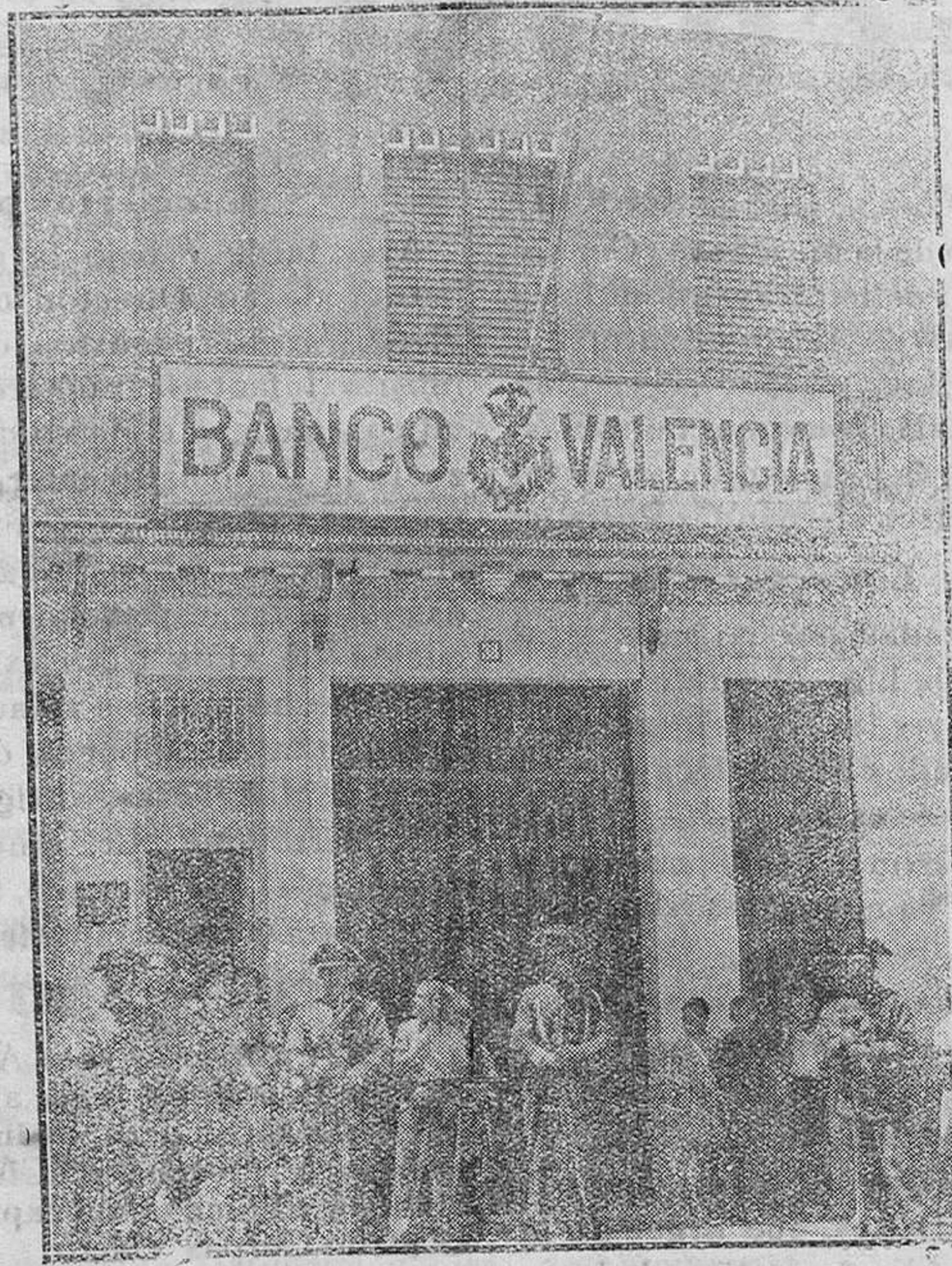
El edificio de la Sucursal del Banco de Valencia en Benasúer (Valencia) en el que se ha cometido un atraco de 40 000 pesetas