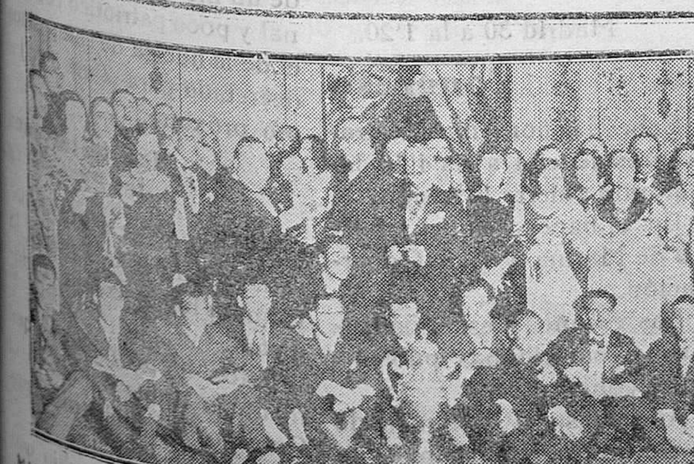
MADRID.—En el Ayuntamiento se ha celebrado una recepción festejándose a los jugadores del equipo del «Madrid F. C.»