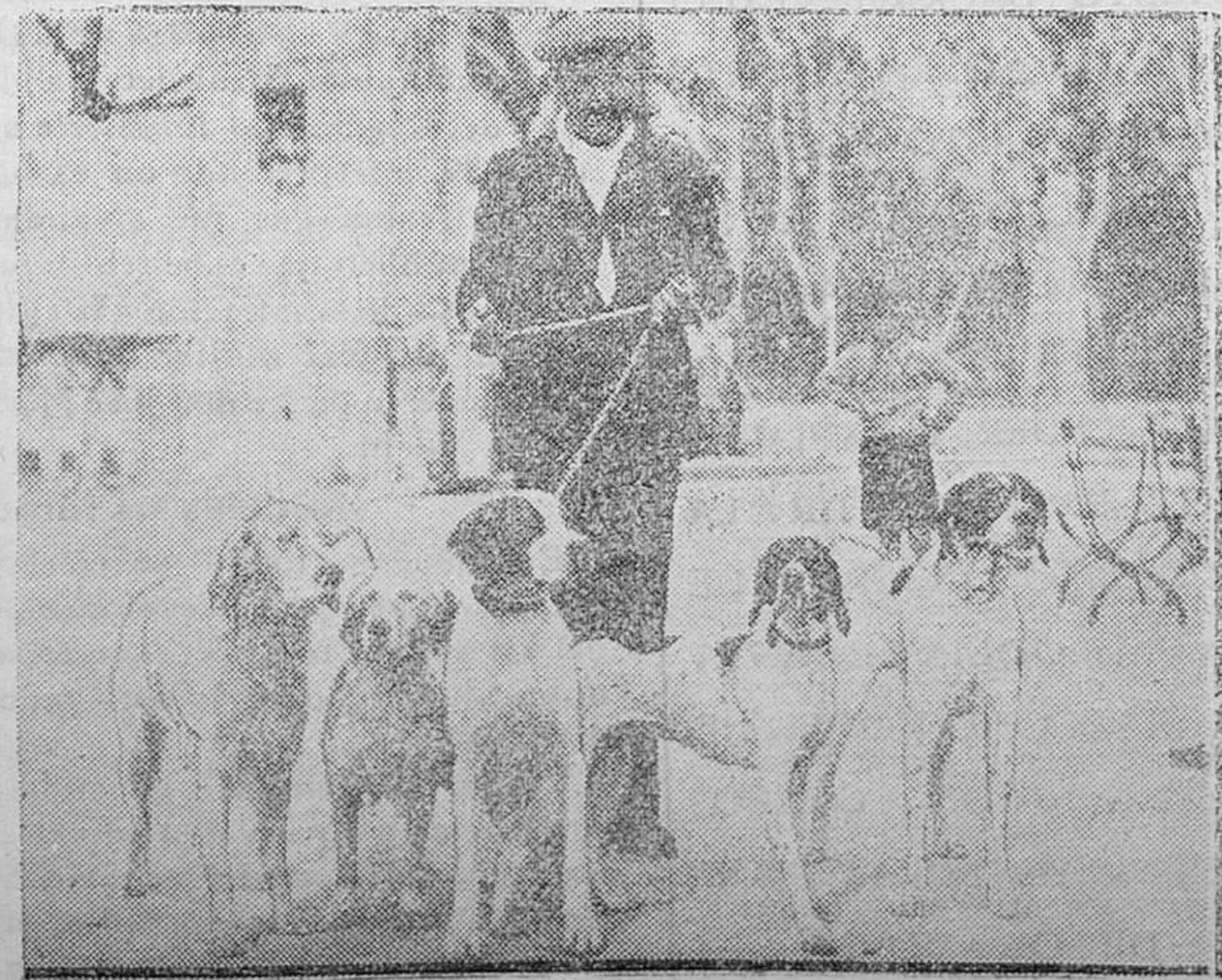
MADRID.—Exposición canina en El Retiro.—Unos perros de raza

Véndese en la Librería de MANUEL SINTES ROTGER, plaza Pablo Iglesias número 17, Mahón.