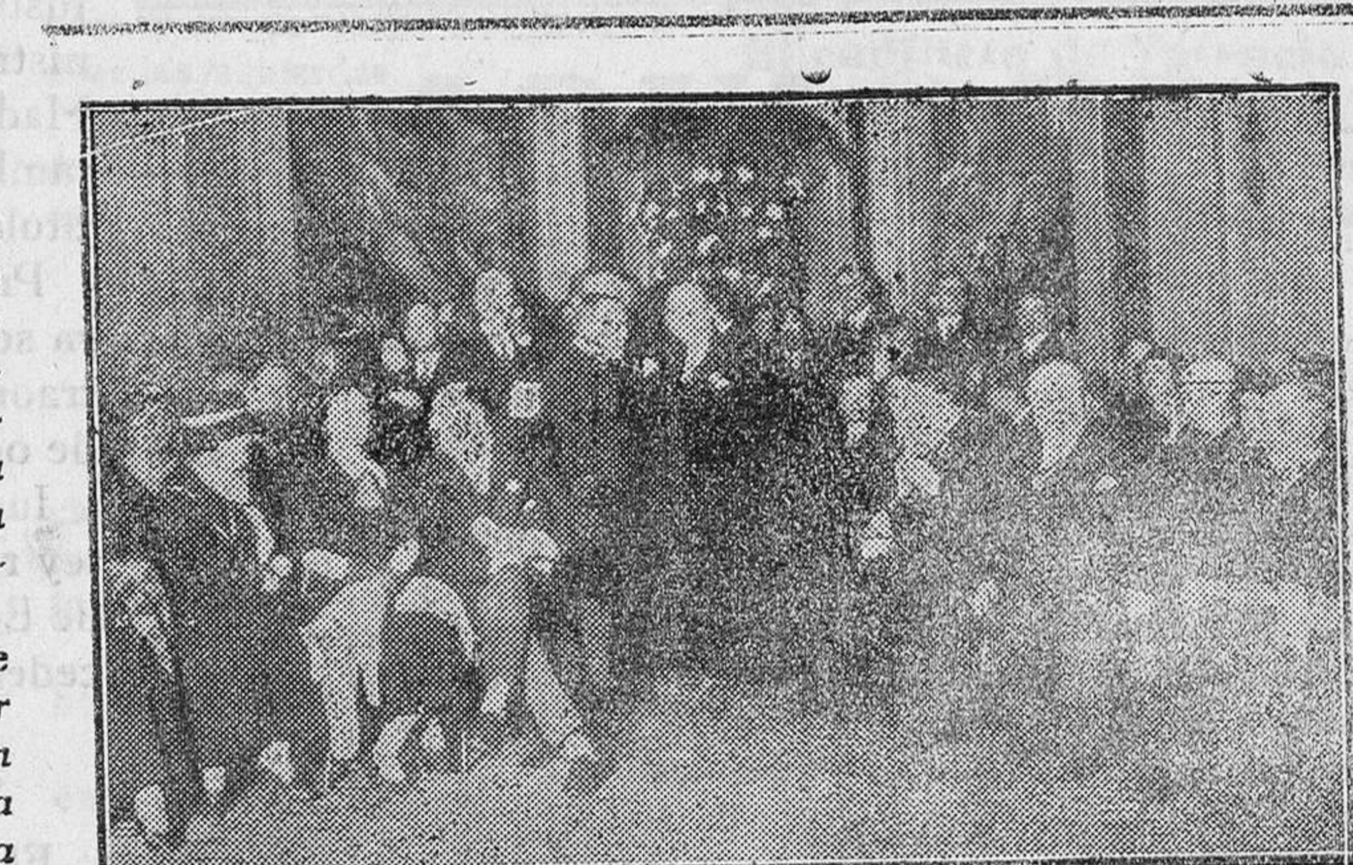
IX CONGRESO INTERNACIONAL DE QUÍMICA Los congresistas durante la recepción en el Ayuntamiento de Madrid

los del café, los déspotas del bienio, los mismos que abandonaron a Galán y García Hernández no pueden estar viviendo al socaire de esos nombres, que agitan con un desparpajo y con una irrespetuosidad propia de explotadores. Y hay, por último, una cosa más indignante que ninguna, y es la actitud de los separatistas catalanes al pedir que se cubran con crespones negros las lápidas de Galán y García Hernández. A los separatistas catalanes no se les podía ocurrir nada más que una cosa del más burdo y grotesco corte puerilino; pero irrita en dema-