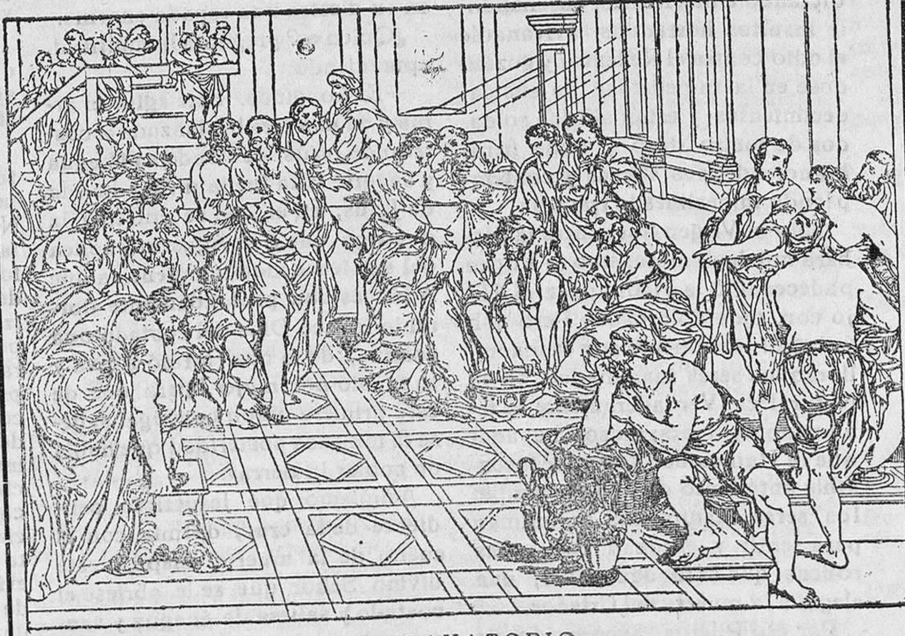
EL LAVATORIO Cuadro del pintor Muziano, existente en la Catedral de Reims