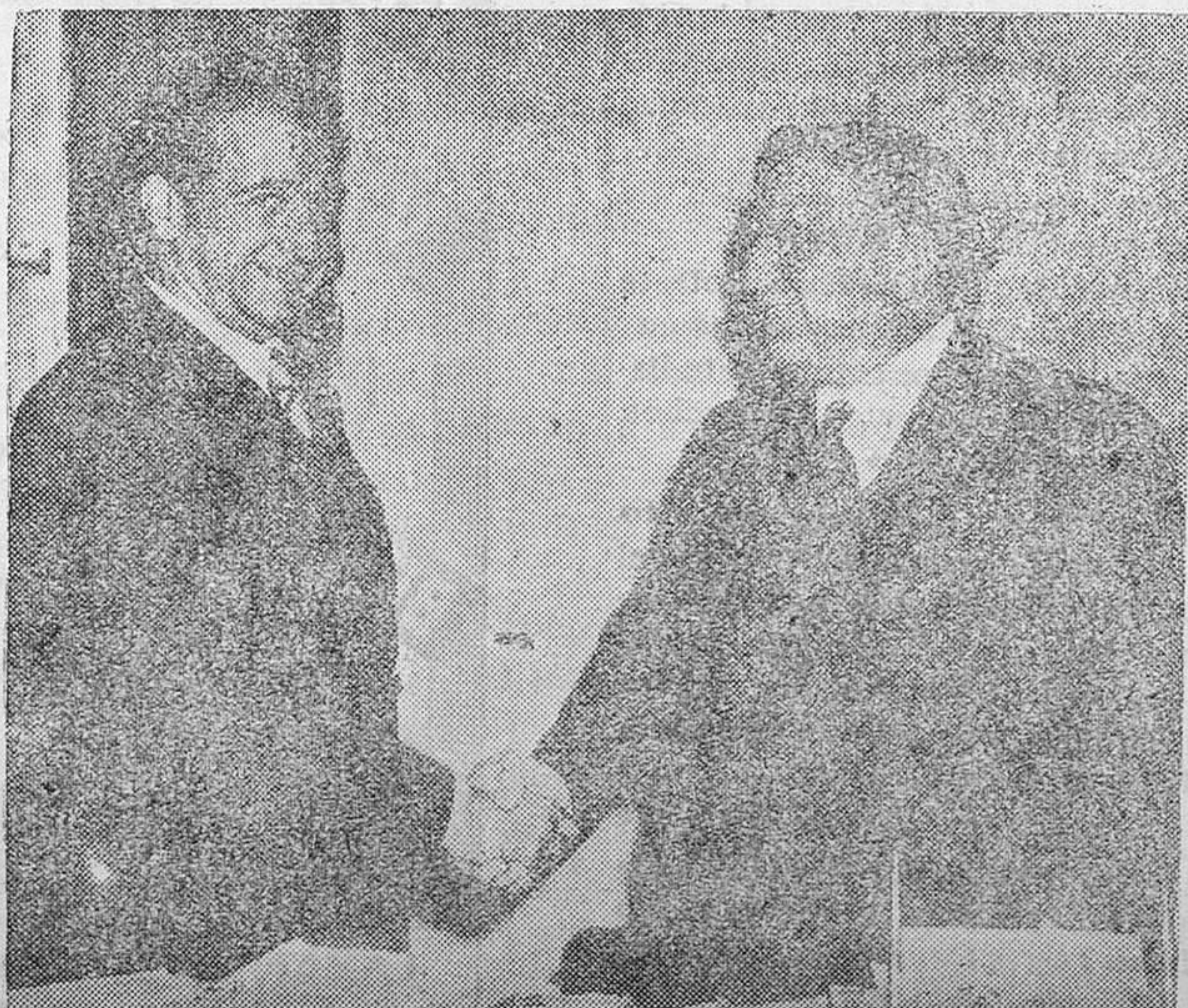
El comandante Franco en Norteamérica, recibido por el Alcalde señor La Guardia