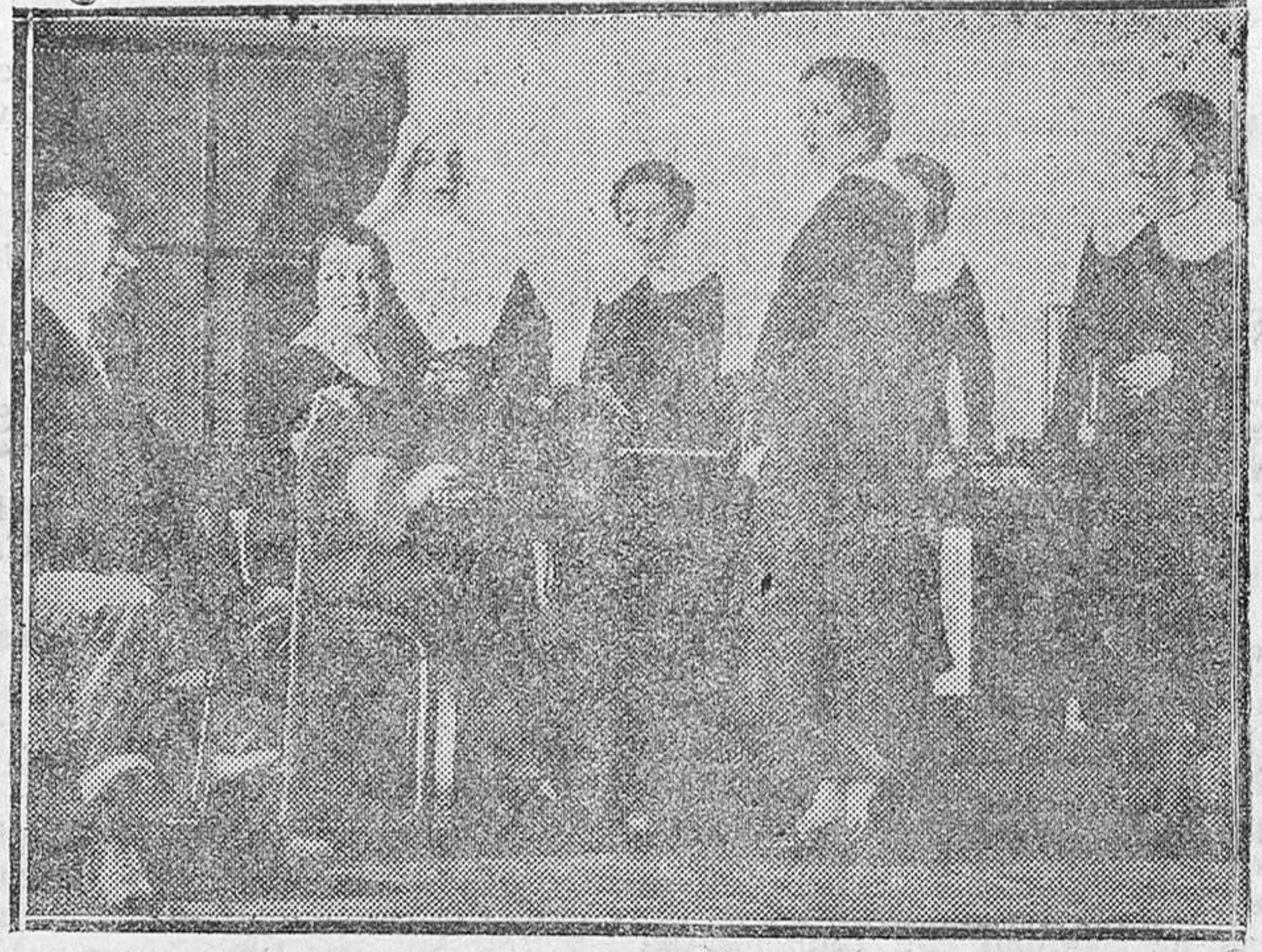
MADRID. — Una escena de la obra «Sor Alegria», estrenada en el teatro Lara con gran éxito.