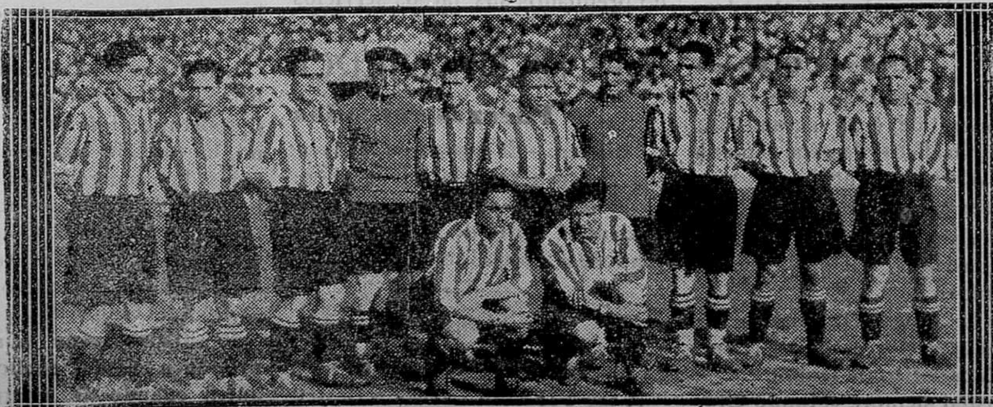
El equipo «Athletic» de Bilbao que al vencer al «Barcelona» por 1 a 0 ha quedado Campeón de España después de un reñido partido

Véndense en la LIBRERÍA SINTES. Plaza de Pablo Iglesias 17, Mahón.