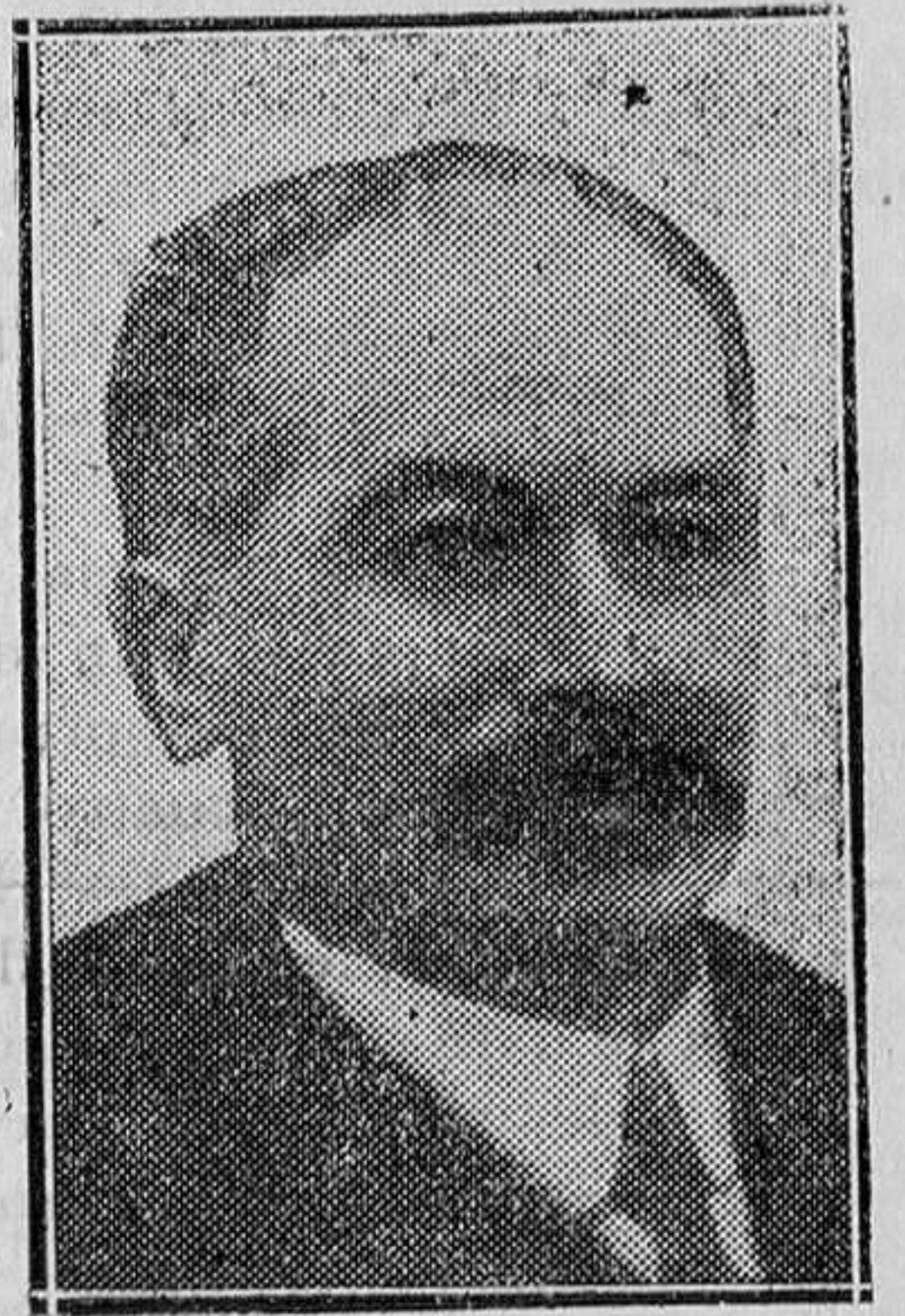
Mr. Albert Lebrun, que ha sido elegido Presidente de la República francesa

De 12 y media de la mañana a las 8 y media de la noche en la Iglesia Parroquial de Santa María.