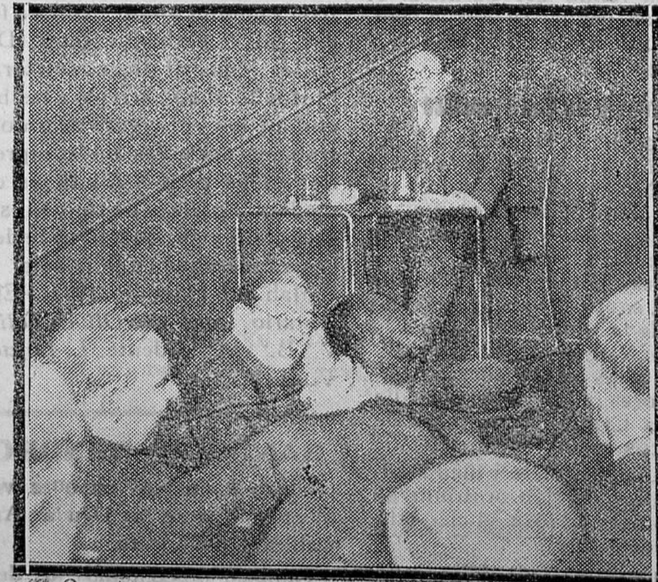
MADRID.— Conferencia del Rector de la Universidad Central don Claudio Sánchez Albornoz con motivo de la Semana de Historia del Derecho