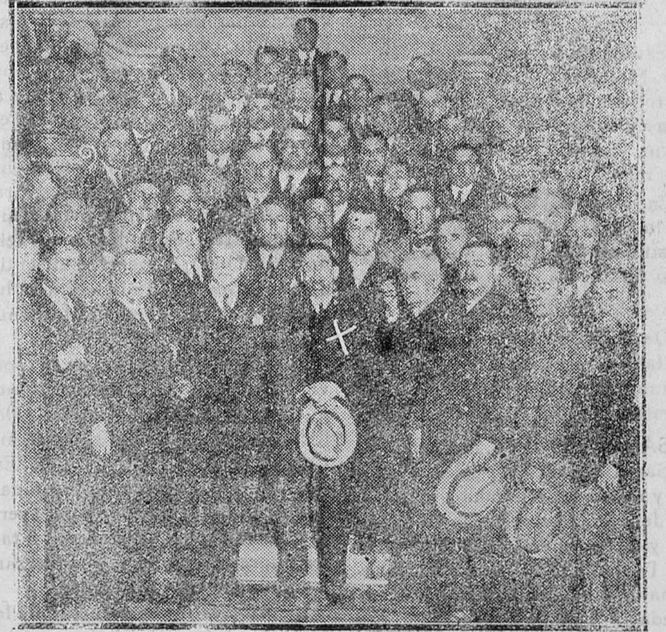
MADRID.—Don Marcelino Domingo, ministro de Agricultura, rodeado de amigos, después de la conferencia que pronunció en el Círculo de la Unión Mercantil