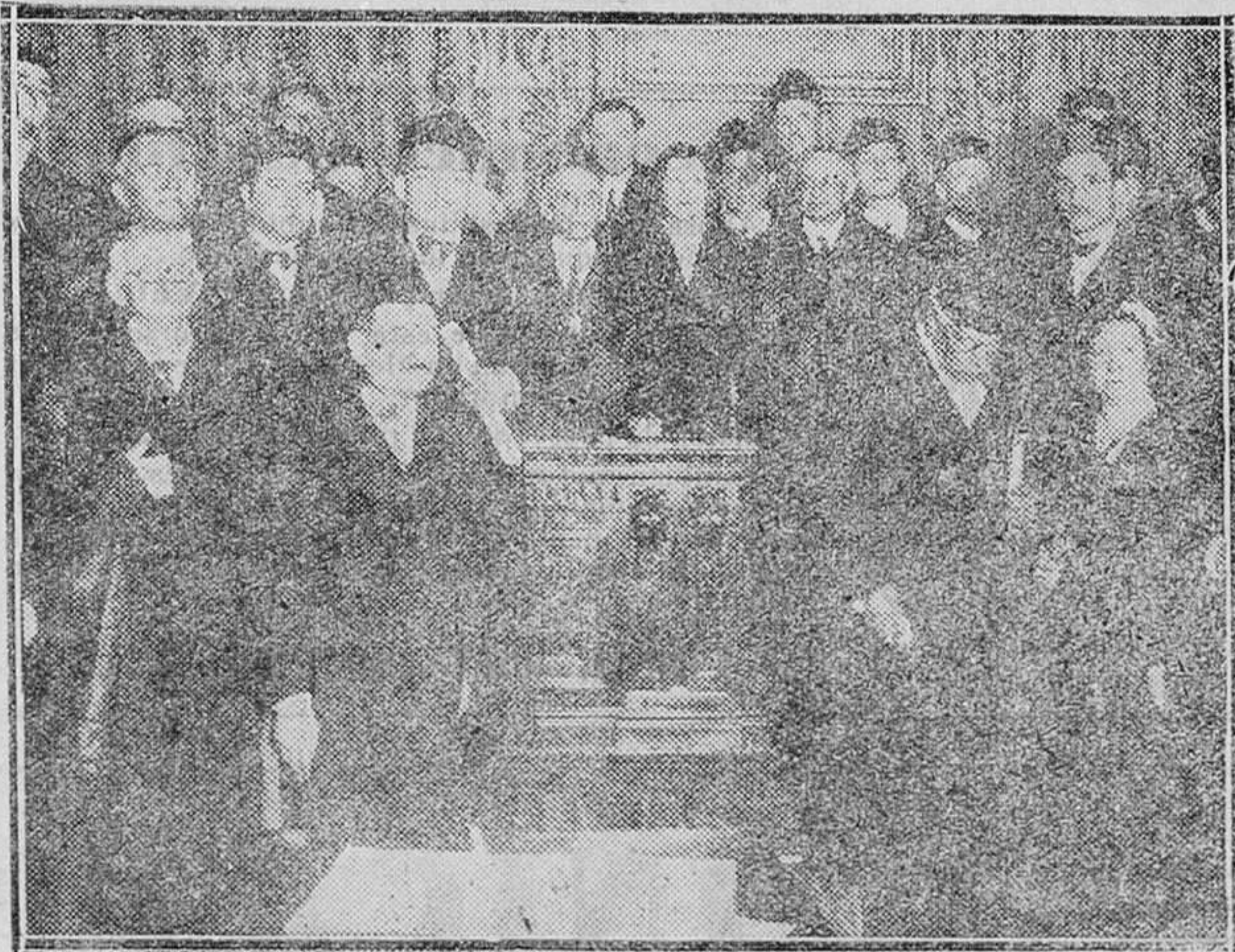
MADRID.—En el Colegio de Abogados.—Solemne sesión celebrada con motivo del CCCXXXVI centenario de su fundación