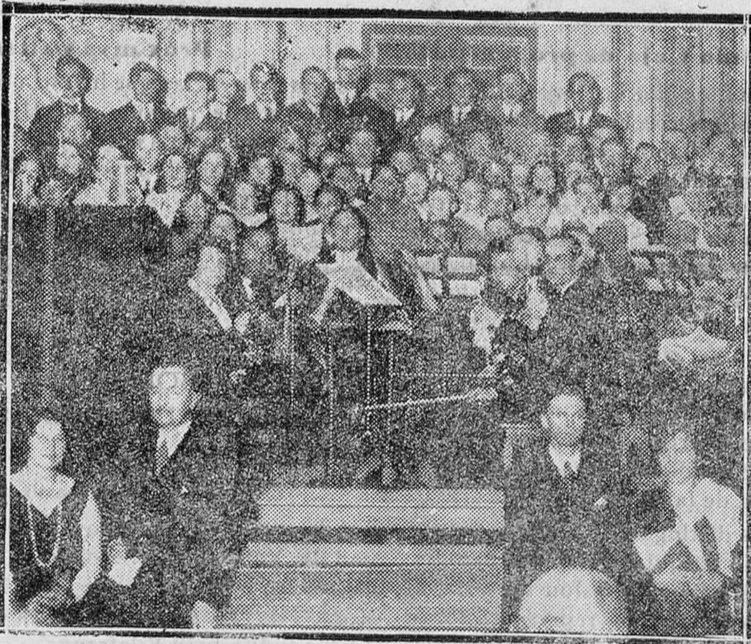
MADRID.—Teatro Conservatorio.—Celebración del centenario de Goethe de la colonia alemana en esta capital, con asistencia de varias personalidades y el Embajador