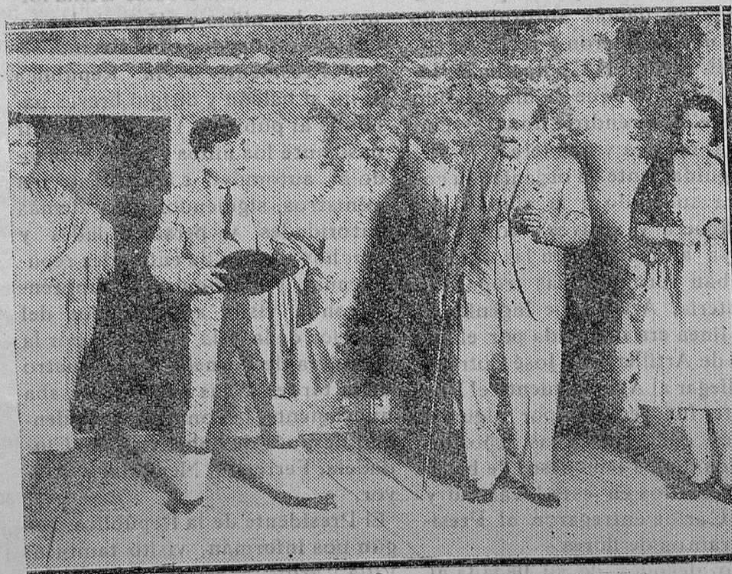
MADRID.—Teatro Calderón.—Una escena de la zarzuela «Pitos y Palmas», de los señores Alvarez Quintero y maestro Alonso, estrenada con gran éxito