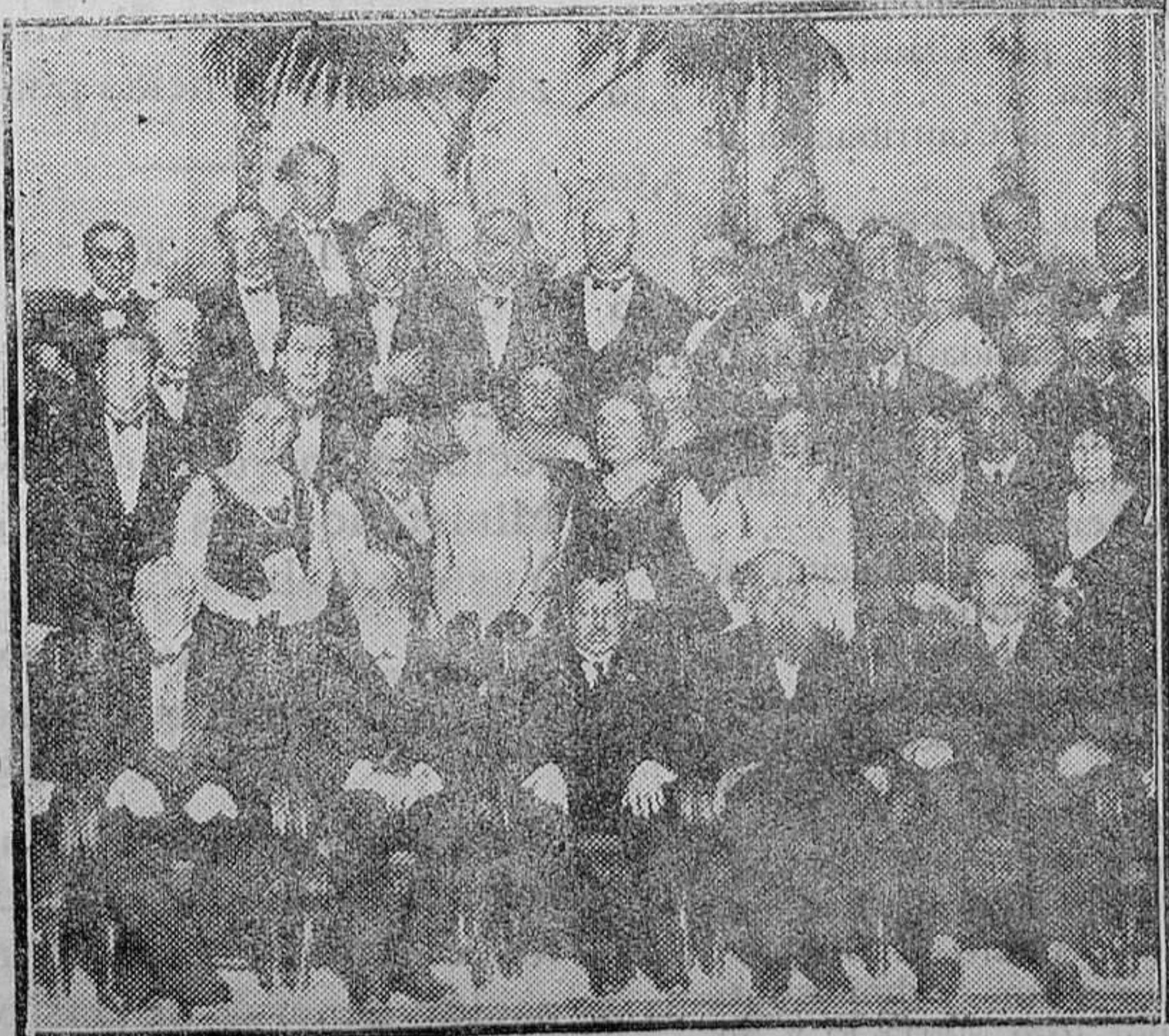
MADRID.—IX Congreso Internacional de Cirujía. —Recepción de los cirujanos españoles y extranjeros, celebrada en el Hotel Ritz

(1) El banquete fué anterior a su aparición.