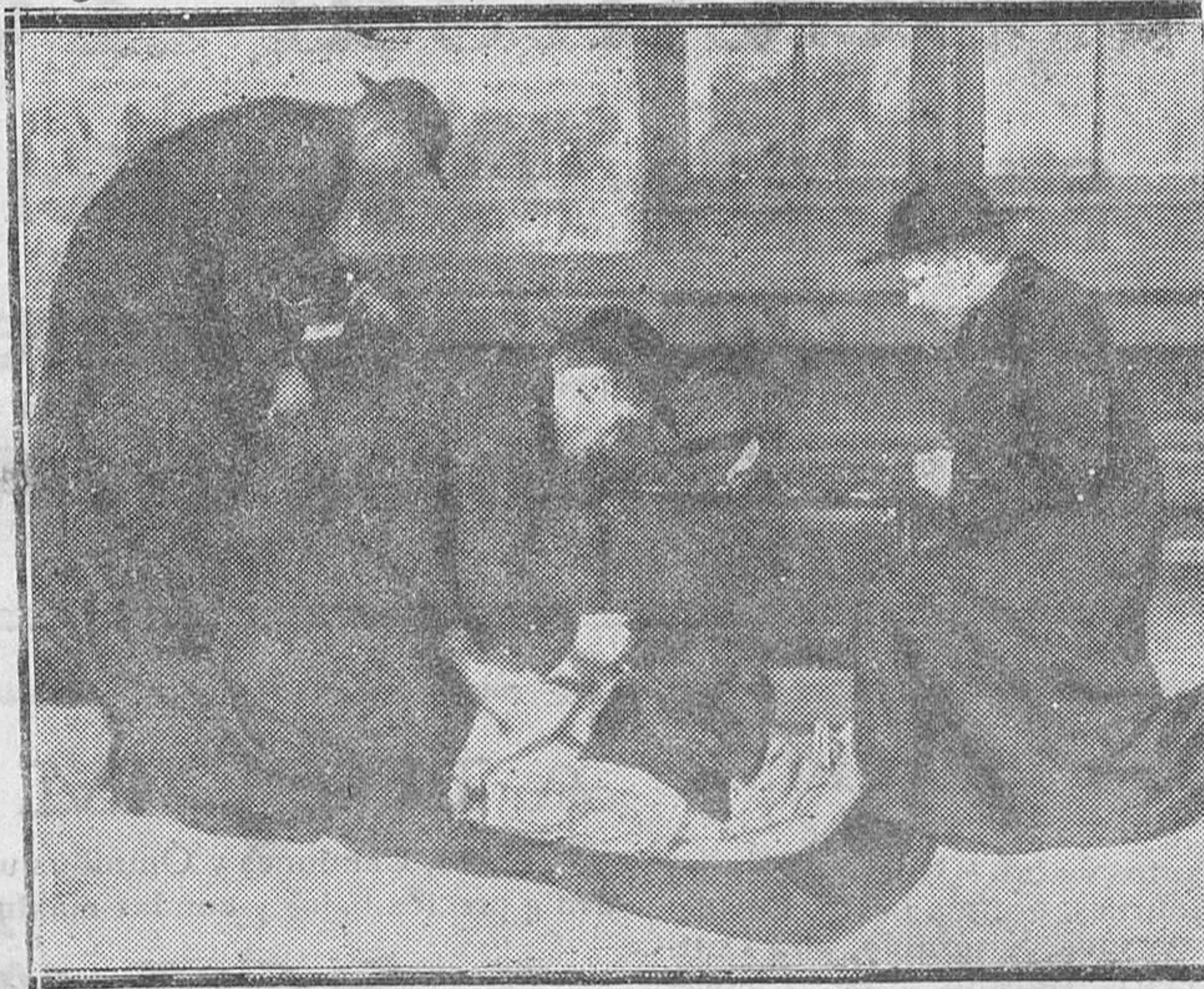
Unos novicios jesuitas arreglando su equipaje después de la revisión en la Aduana, al pasar la frontera

Véndese en la Librería de Manuel Sintes Rotger, Plaza de Pablo Iglesias número 17, Mahón.