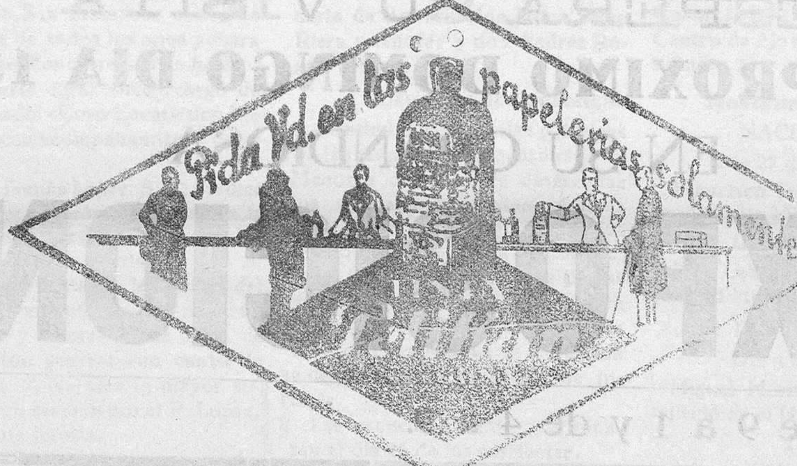
De venta en la Librería de MANUEL SINTES ROTGER, Plaza de Pablo Iglesias, 17, Mahón.

114 LOS HIJOS DESGRACIADOS El no podría darla otra cosa; pero cariño... —Tú, Sultán y yo— decía entusiasmado— seremos una familia y viviremos los tres juntos, queriéndonos mucho... ¡Ya verás, ya verás! ¿Para qué necesitamos a nadie? También la libertad es cosa muy buena, y tú no has sido nunca libre. De los tres, tú serás la que mandes. Que diges: «Quiero ir a tal parte», pues a tal parte vamos por darte gusto. Que diges: «quiero hacer esto o lo otro», pues hacemos lo que tú digas. Y que alguien se atreva a hacerte mal; aquí estamos Sultán y yo pa defenderte. Sobre tó Sultán, que tiene unos dientes... Fueron animándose por grados, con esa volubilidad propia de la infancia, y los dos niños acabaron por reír alegremente; y el perro, cual si comprendiese lo que hablaban, cual si adivinase que en los planes que formaban también entraba él, mirábales con sus grandes ojos llenos de inteligencia y les lamía las manos, como diciéndoles: «contad conmigo». —Luisito se formalizó de pronto, y dijo muy serio: —Pero oye, prenda; vamos a cuentas. Tó está muy bien, y a mí me das una gran alegría con ello, porque ya ves tú: de estar solo a tenerte a ti, hay mucha diferencia; pero has de saber que no tó son glorias en la vida que yo hago. Hay