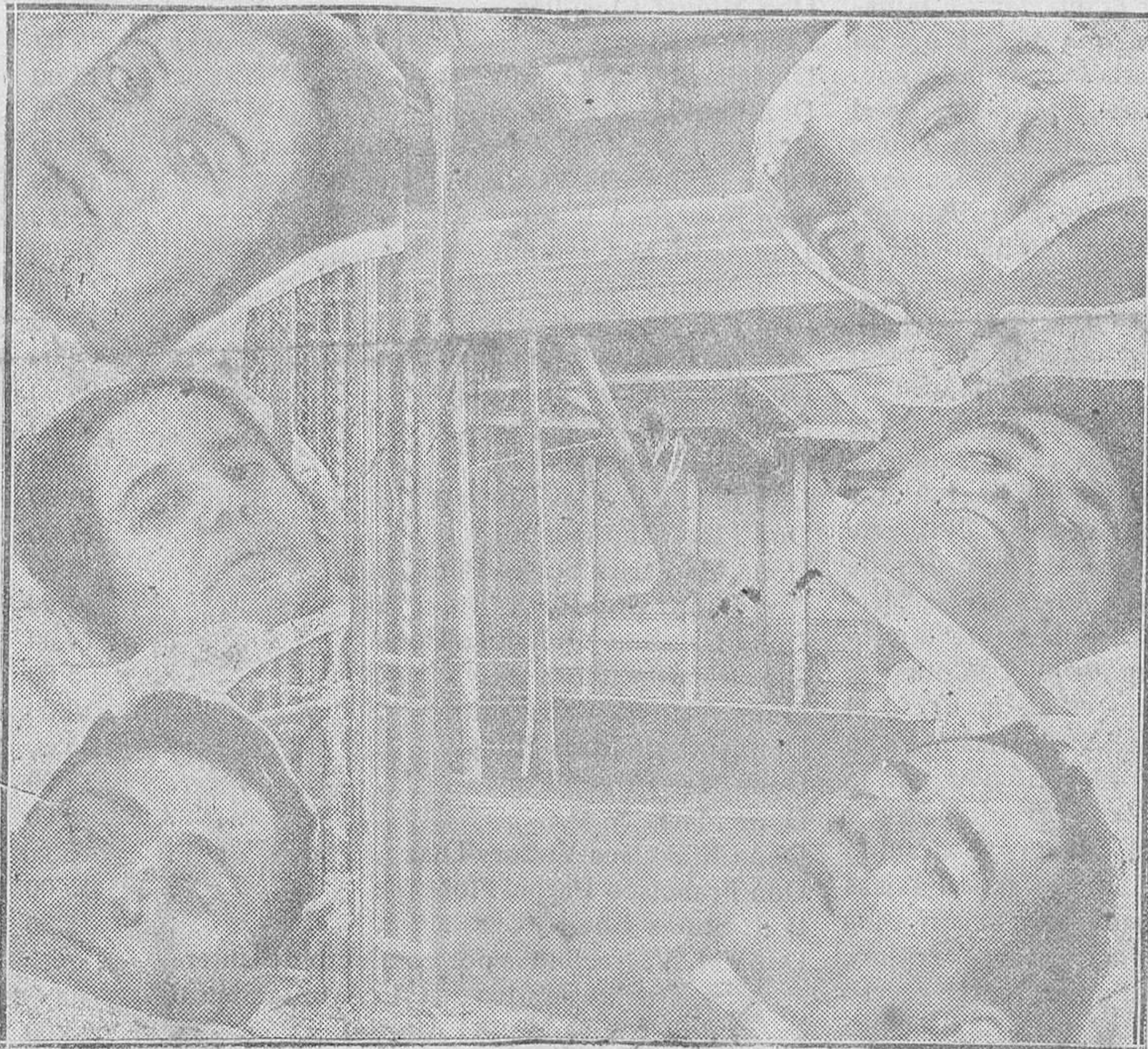
MADRID.—El terrible accidente ocurrido en el pasador del Metropolitano, estación de la Gran Vía, y en el que se ve a algunos de los heridos