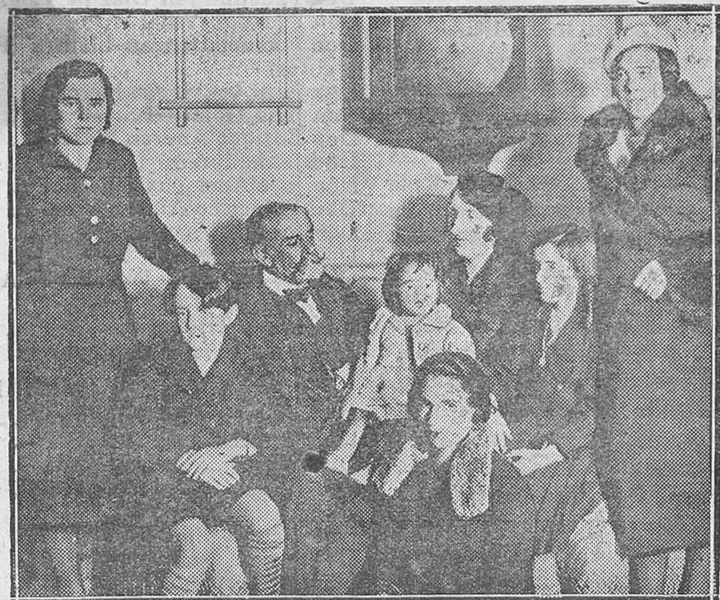
DEL SUCESO DEL MOLAR. — El conde de Ruidoms con sus familiares y la servidumbre que le acompañaba en viaje a París. Fué detenido el auto y atracados sus ocupantes, apoderándose los ladrones de alhajas cuyo valor ascendía a más de 100.000 pesetas