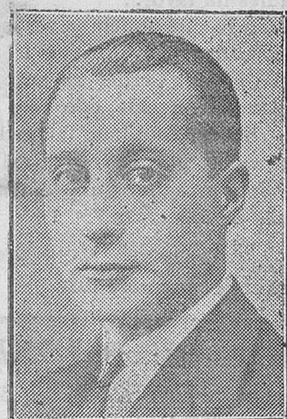
Don José Antonio Primo de Rivera, defensor del ex ministro de Justicia don Galo Ponte