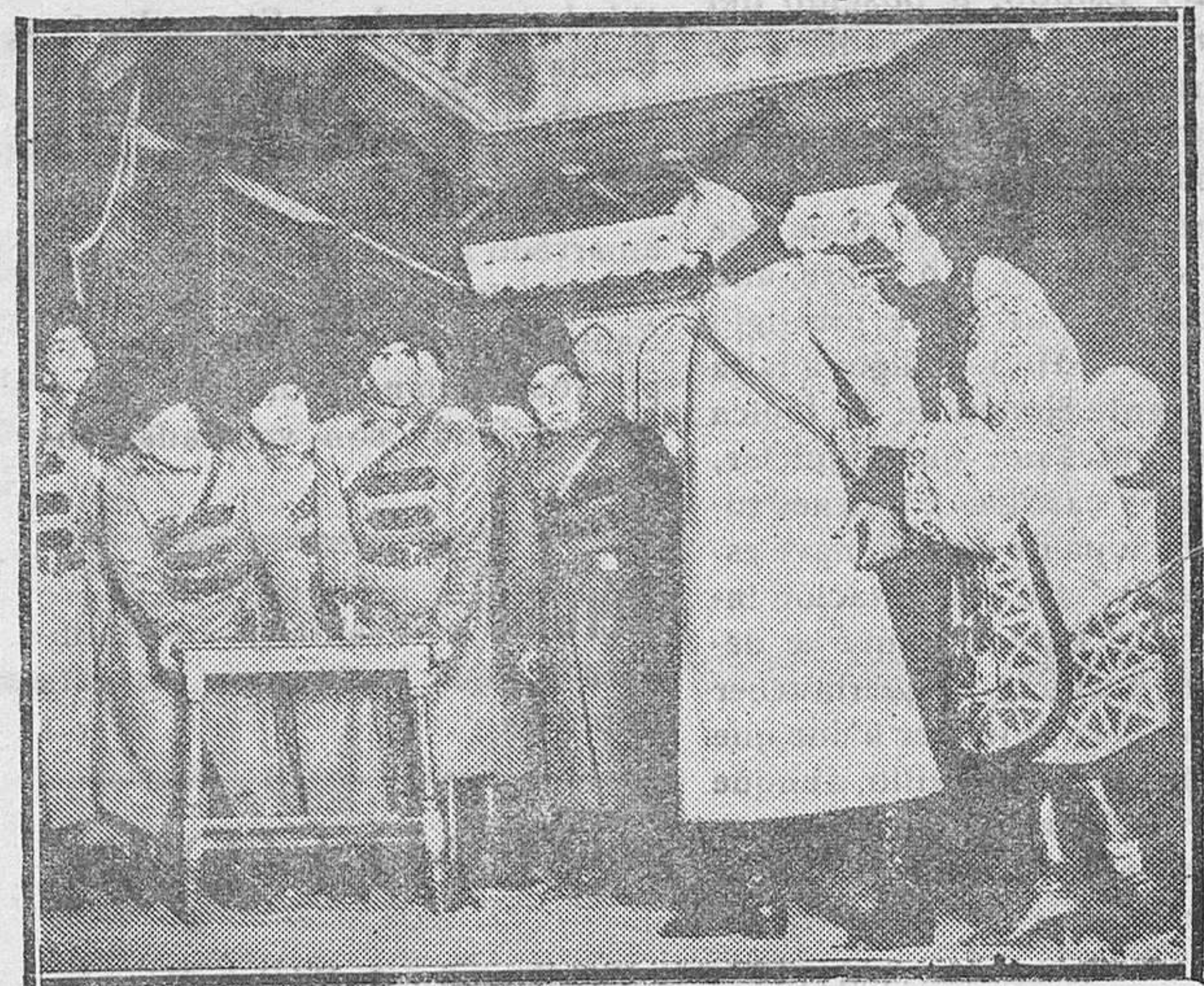
MADRID.—Una escena de la obra «Katuska o la mujer rusa», estrenada en el cine Rialto con gran éxito