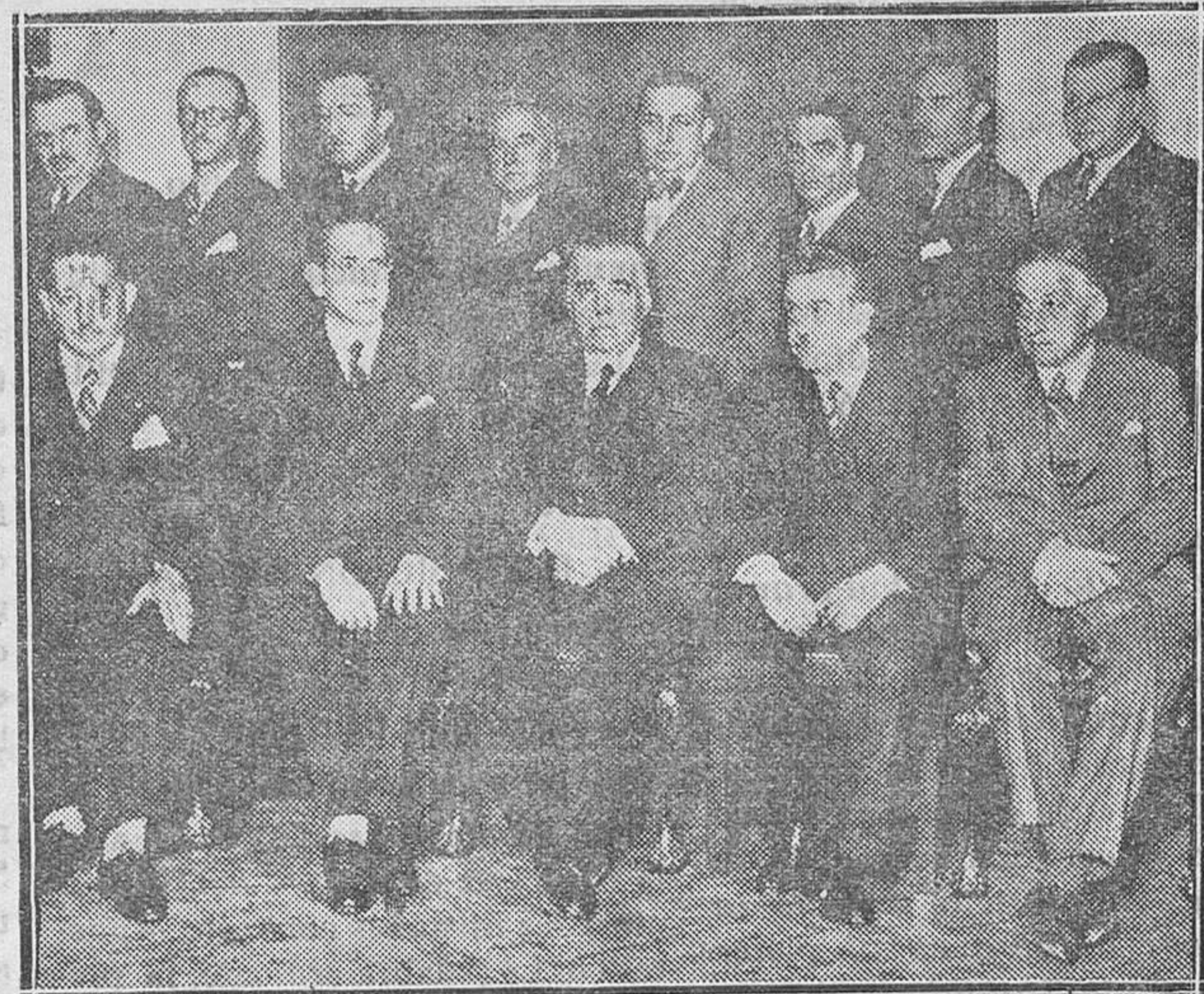
EN EL CÍRCULO DE LA UNIÓN MERCANTIL.—La nueva Junta de Gobierno de la citada entidad, que el viernes último tomó posesión