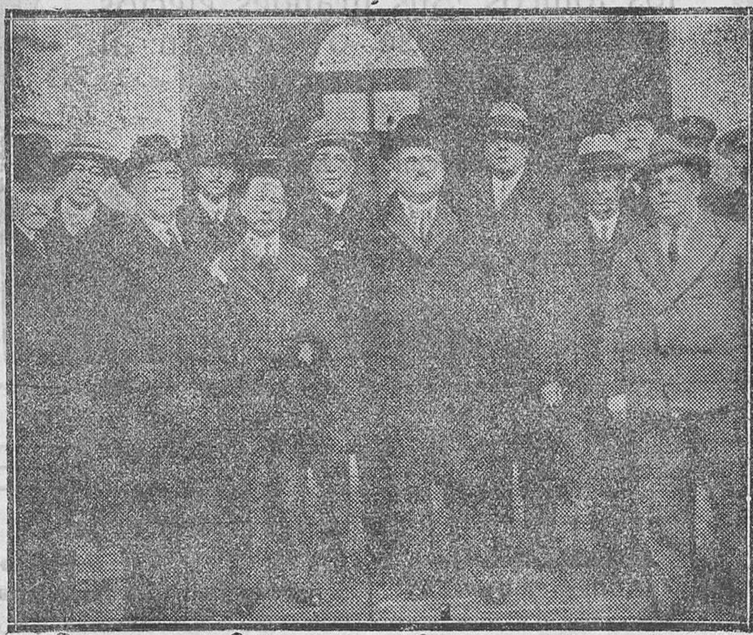
MADRID.—Han visitado al Presidente de la República la Directiva de la Casa Regional Murciana para pedirle interceda por el mantenimiento de la Universidad de Murcia.