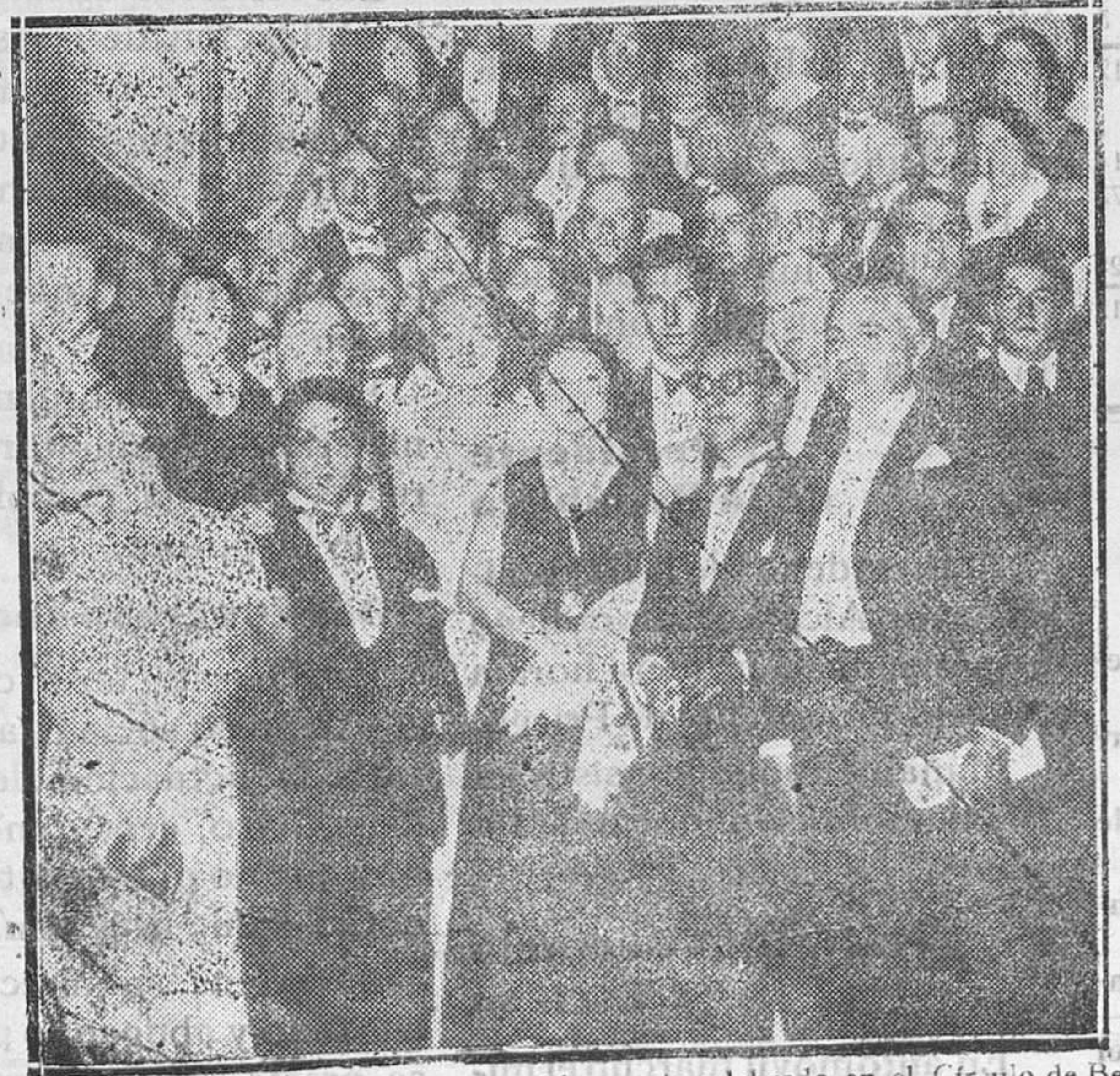
MADRID.—Un grupo de concurrentes al banquete celebrado en el Círculo de Bellas Artes en honor de los delegados extranjeros en el Congreso de Otorinolaringología

Esto, que no otra cosa, es lo anunciado a resolver por los señores Azaña y Albornoz en sus respectivos discurso y declaraciones. Esta es la verdad escueta sobre la cacareada ley de Congregaciones a tratar «en uno de los próximos Consejos» que luego «leeremos en las Cortes». Que apenas discutirán, menos todavía suavizarán, pero que votarán «a la orden»; y no del país ni en provecho alguno de éste, ciertamente. Aunque con grave, gravísimo daño para los intereses y la pedagogía de toda la nación.