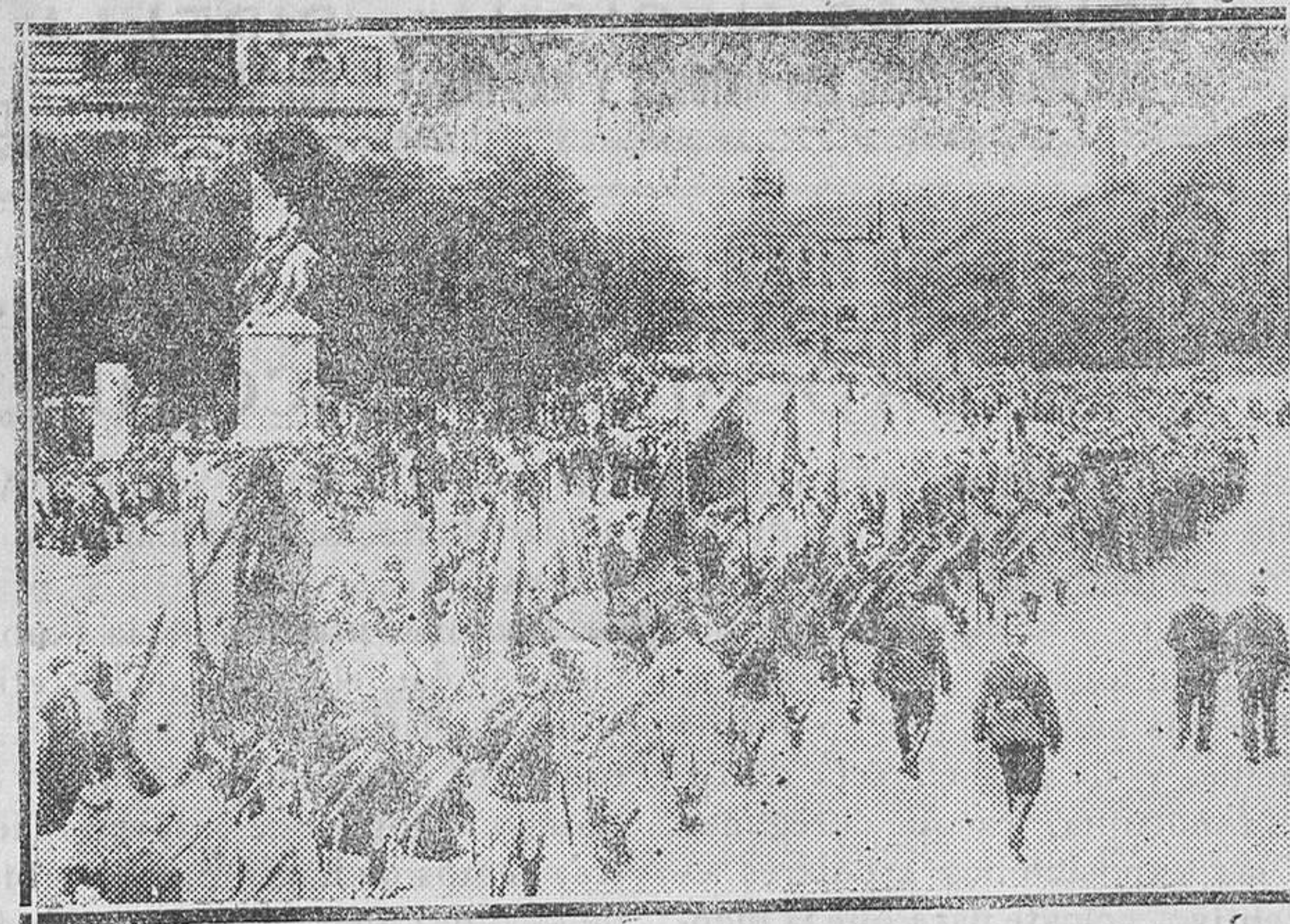
Gran manifestación estudiantil de escolares hitlerianos contra el tratado de Versalles, cuyo décimotercero aniversario se cumplió hace días. En el imponente cortejo tomaron parte millares de alumnos de las Universidades y escuelas de Berlín