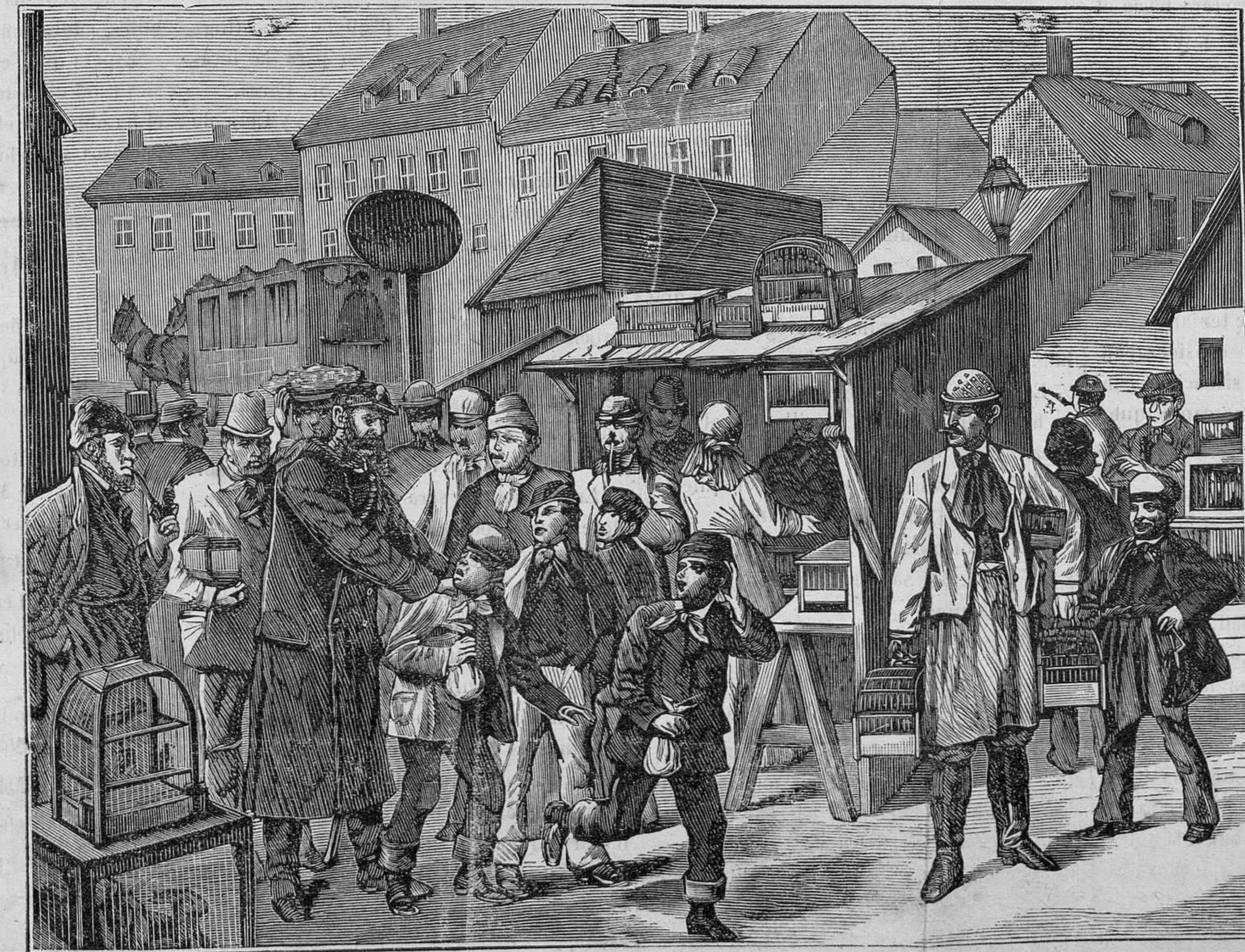
UN MERCADO DE PÁJAROS EN VIENA

En el mercado de Lerchenfeld se veían nunca pájaros exóticos y de gran precio, á lo sumo algunos canarios; en cambio abundaban los ruiseñores, alondras, jilgueros, verderoles, pardillos, mirlos y otras aves que habitan en las cercanías de Viena. El modesto comprador hallaba allí ocasión para adquirir por muy pocos kreutzers el pájaro de sus aficiones, y las gentes necesitadas tenían la seguridad de obtener algún dinero por la avecilla que les habían recreado con sus trinos en épocas de bienandanza y prospe-