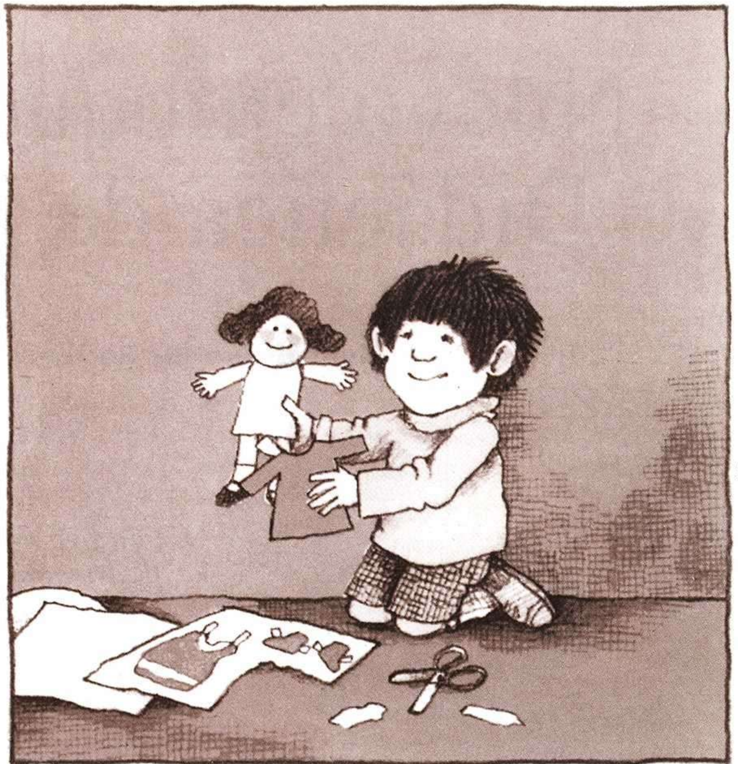
TOMIE DE PAOLA, OLIVER BUTTON ES UN NIÑO, MIÑÓN, 1982.

Desde este contexto debemos tener en cuenta, siguiendo a Xurxo Torres, 5 que hay dos clases de interdisciplinariedad: la «vacía», que es aquella que integra de manera mecánica informaciones cuyo origen se sitúa en campos disciplinares diferentes pero que no comporta el peligro de tocar cuestiones sociales conflic-