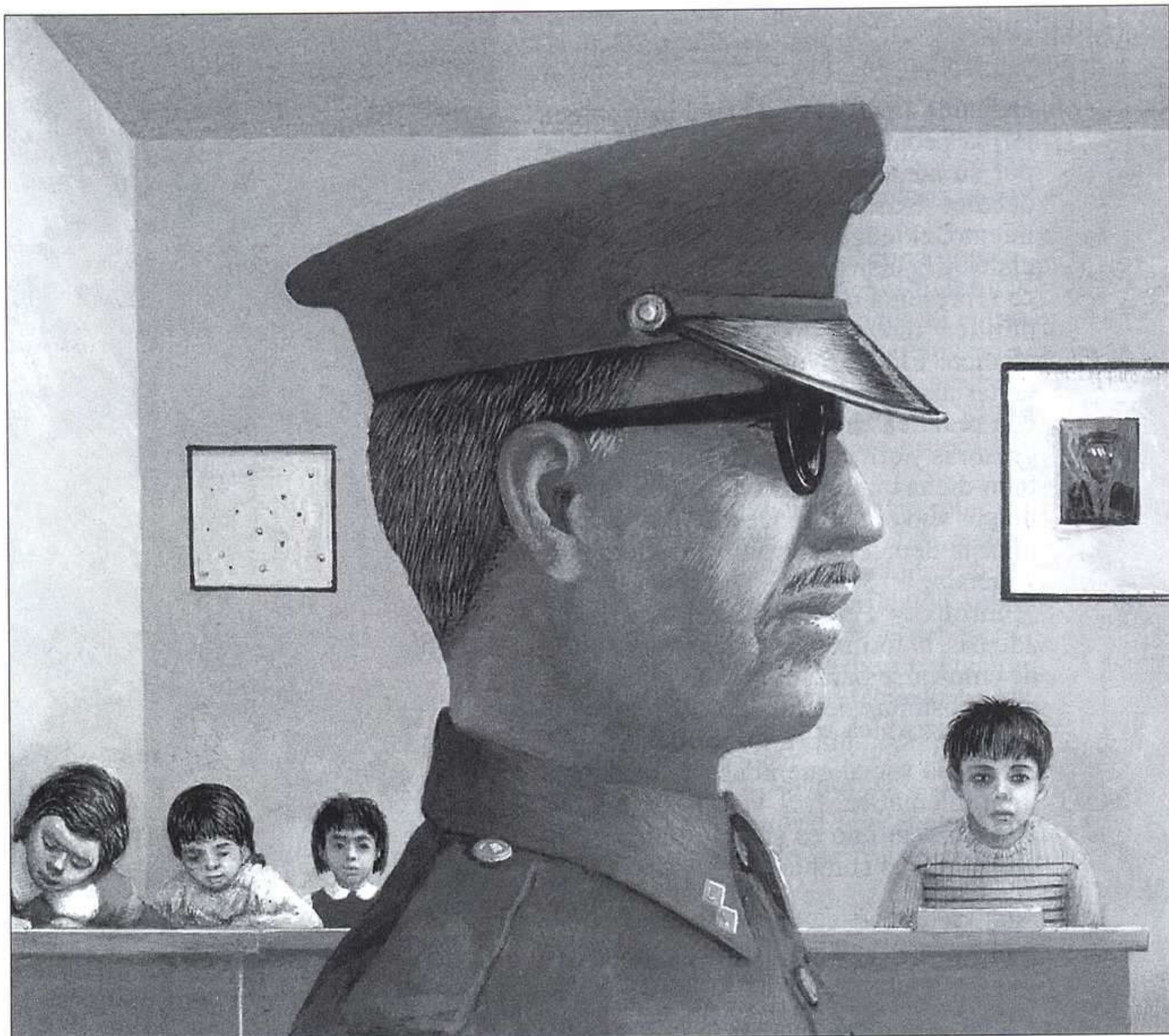
ALFONSO RUANO, LA COMPOSICIÓN, SM/EKARÉ, 2000.

Por ello, Stenhouse sostiene que en cualquier democracia que valore la responsabilidad de su ciudadanía y haga énfasis en ella preocupa la inclusión, dentro del currículo de áreas de estudio