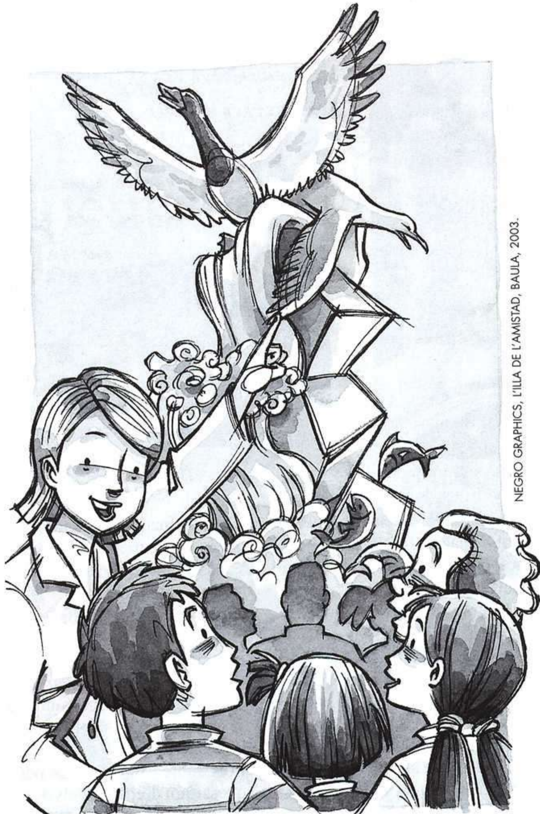
NEGRO GRAPHICS, L'ILLA DE L'AMISTAD, BAULA, 2003.

Pel que fa a la narrativa juvenil s'ha de destacar que, encara que continua sent majoritària la tendència cap a la temàtica d'aventura i de misteri, cada vegada ens trobem amb més obres de caràcter històric i que, per contra, disminueix la narrativa psi-