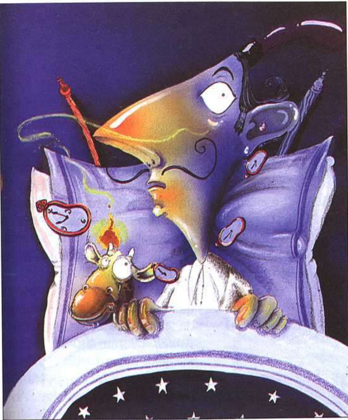
CARLES ARBAT, ELS SOMNIS D'EN DALÍ, BROSQLIL, 2003.