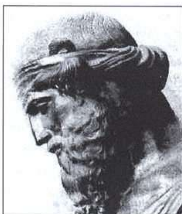
Al lado, Sigmund Freud. William Blake (arriba) y Platón.