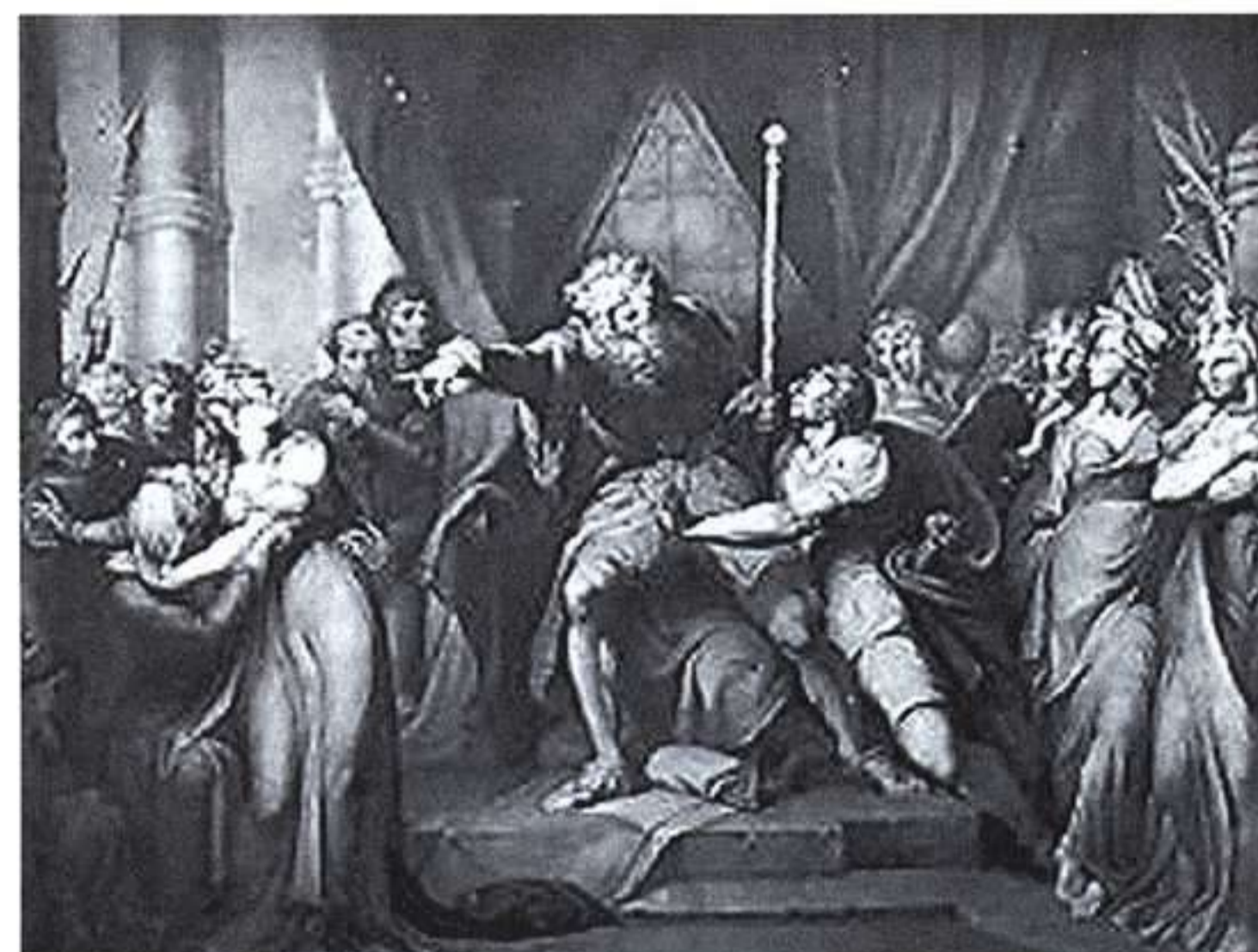
Arriba, Antonin Artaud. Ilustración de El Rey Lear, de Shakespeare, abajo.

es improbable que también rodeada de gallinas, única especie que quizá podría subsistir en aquella tierra marginal, donde solo crecían zarzas, caminos sin asfaltar y unas cuantas rocas blancas. Aun así, le chiflaban los coches, y llegaba hasta allí envuelto en la revolución de polvo que levantaban sus ruedas. La casa, perdida en alguna zona fronteriza de Jersey con Pensilvania, «parecía asentarse sobre cimientos de libros y pape-