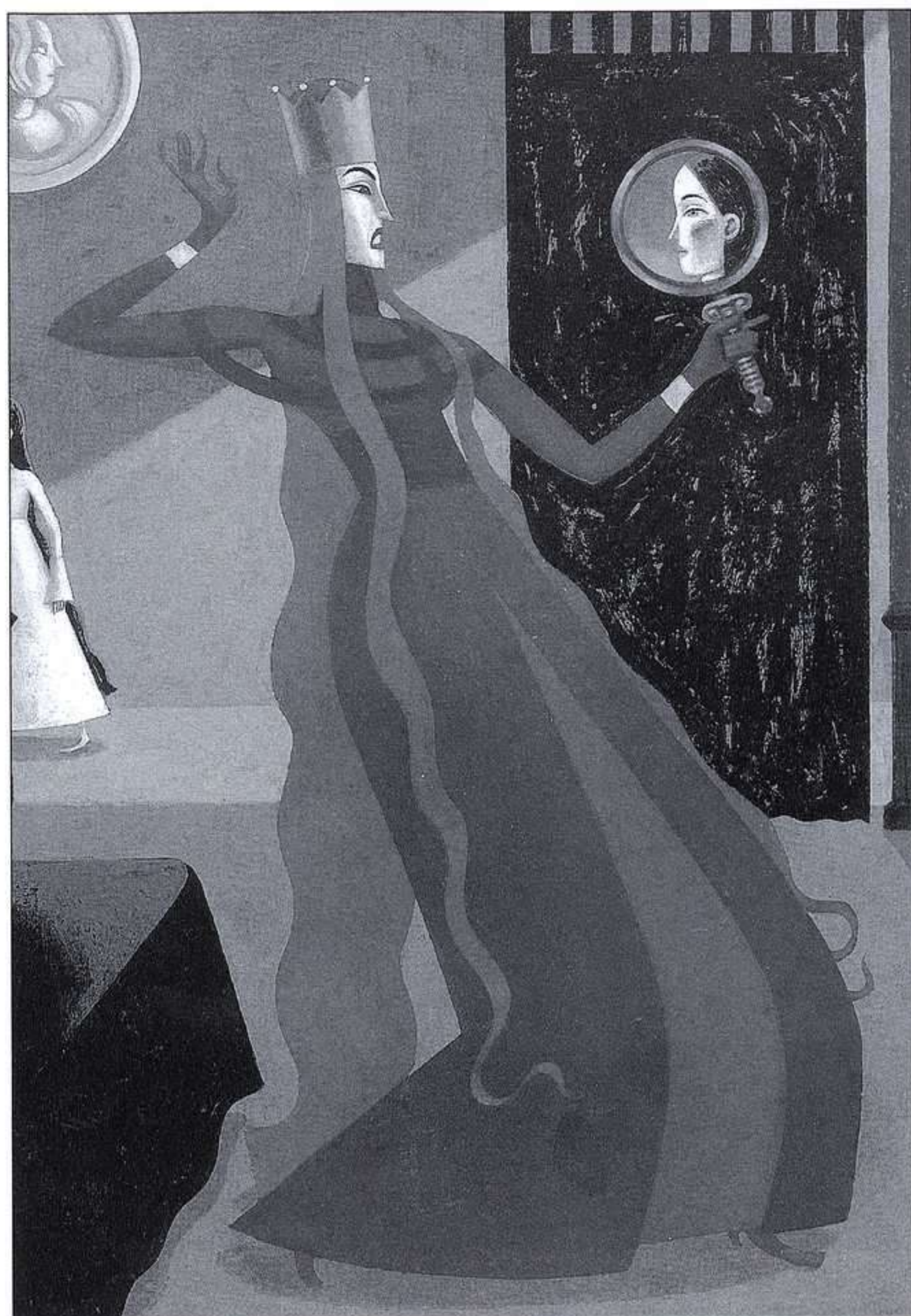
PEP MONTSERRAT, BLANCANIEVES, AURA/CÍRCULO DE LECTORES, 2002.