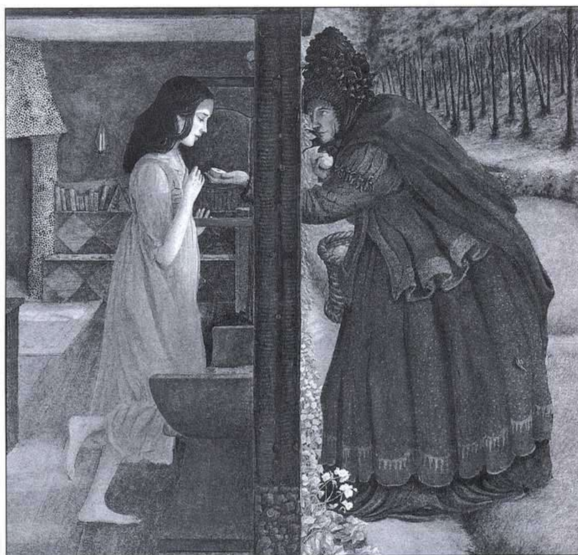
ANGELA BARRET, BLANCANIEVES, KÓKINOS, 2007.

tuirlo por un cordero. En realidad, un modo novelado por los rabinos para convencer al pueblo judío de abandonar una práctica heredada de los vecinos pueblos semíticos.