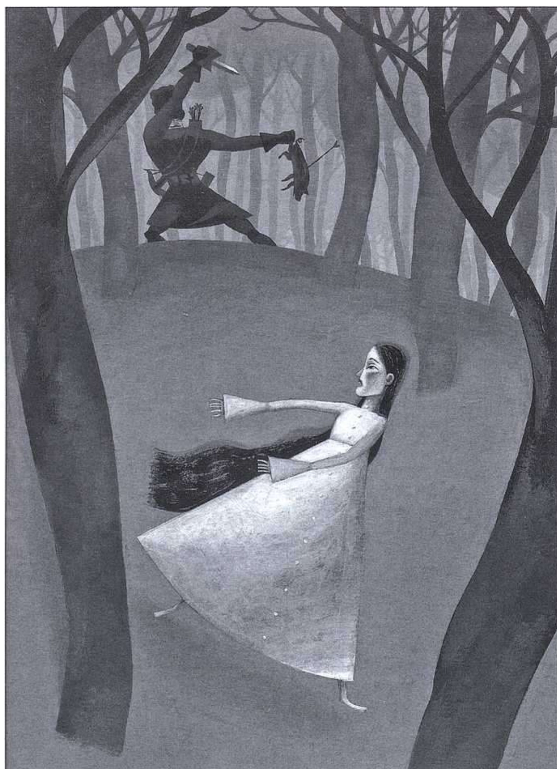
PEP MONTSERRAT, BLANCANIEVES, AURA/CÍRCULO DE LECTORES, 2002.

de la Sirenita. Quienes se dejan llevar por las decisiones del destino dan, en cierto modo, a entender, que ellos sí tienen un lugar en el mundo; un lugar del cual pueden estar desplazados por avatares ajenos a sus méritos o a su pertenencia, pero al cual regresarán de manera inexorable. Y el lector, de mimética manera, lo intuye a sabiendas de que el futuro y el final feliz pertenecen a ese personaje y no a los otros. Ciertamente, salvo raras excepciones, como Pulgarcito, casi ningún personaje de carácter logra la felicidad de manera permanente.