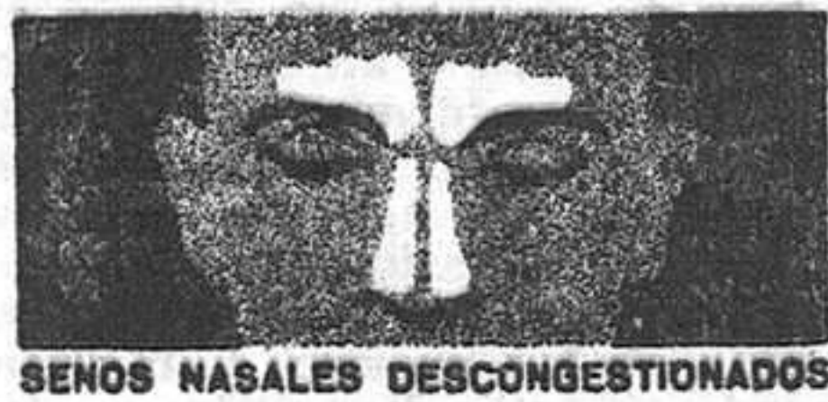
SENOS NASALES DESCONGESTIONADOS

Cuando usted se acatarró, la congestión invade la zona crítica de los senos nasales y frontales. La congestión dificulta su respiración y origina presión y dolor. Usted tiene la cabeza pesada, siente cansancio y fiebre.