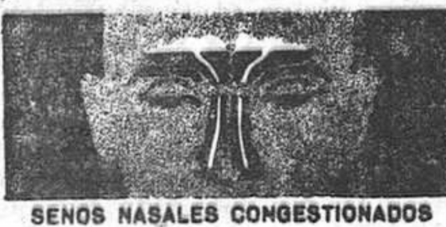
SENOS NASALES CONGESTIONADOS

¡En pocos minutos... su cabeza se despeja y durante horas... Ud. se siente aliviado!