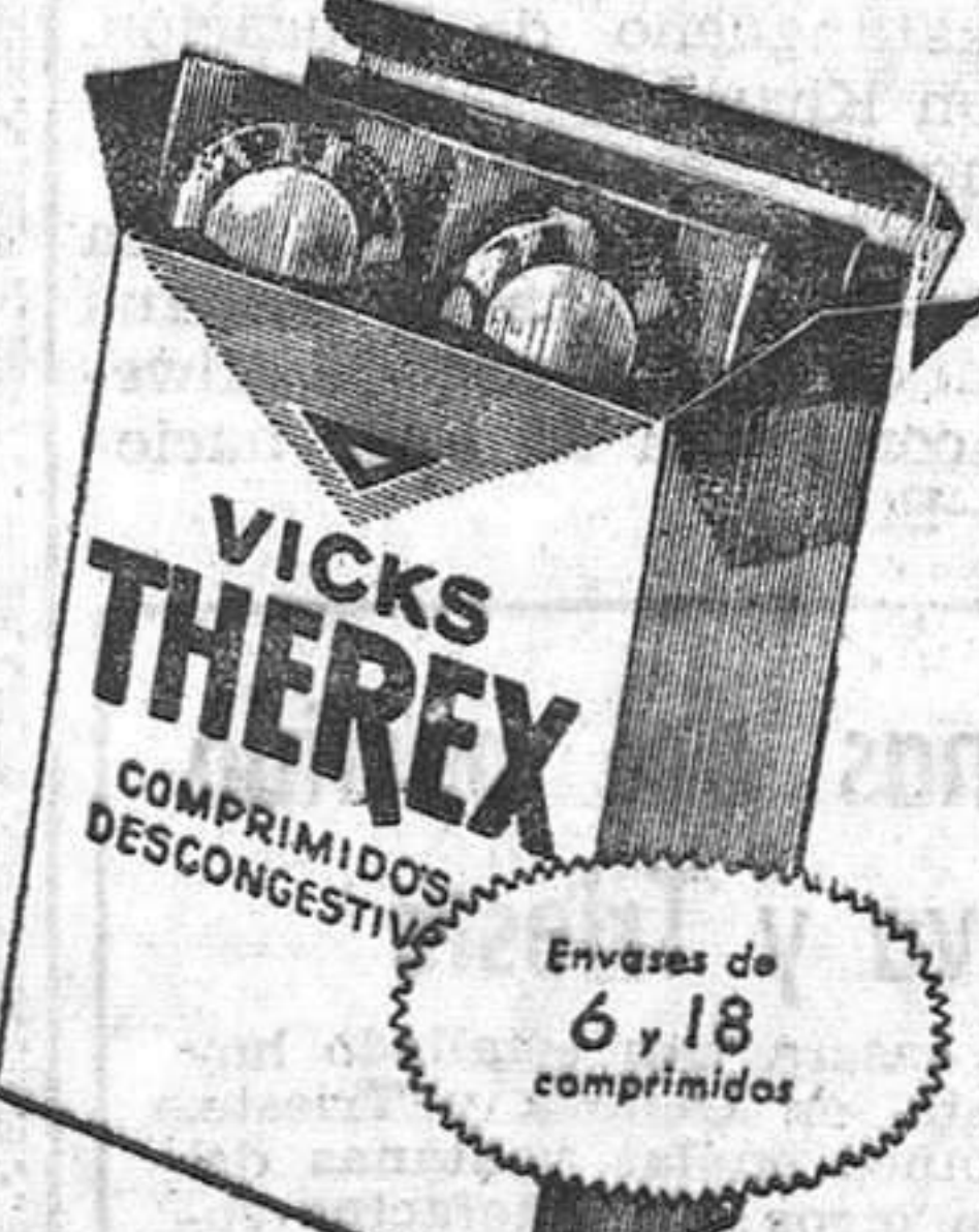
Vicks THEREX comprimidos descongestivos. Envases de 6, 18 comprimidos

Vicks THEREX comprimidos descongestivos!