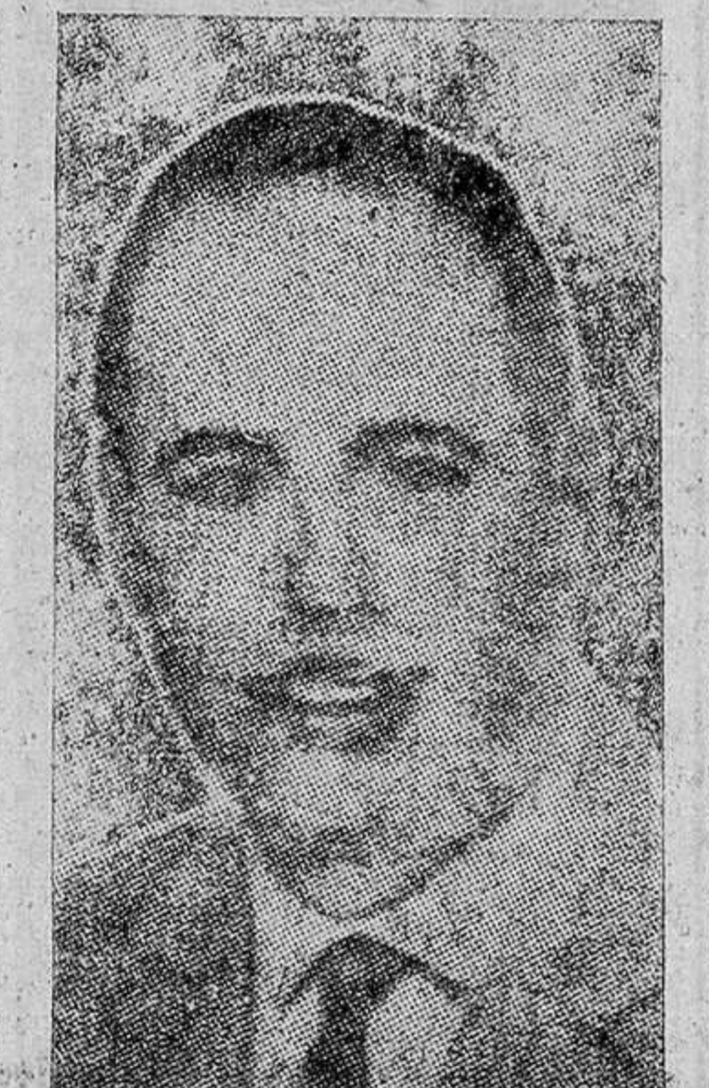
to de vista comunista— sería lo contrario, es decir, la incitación a la abstención. ¿Por qué actúan de esta forma? Por una razón muy clara, al menos para mí: la de jugar sobre seguro. Saben que los trabajadores van a votar con interés. Por eso no se arriesgan a solicitar una abstención que, al no producirse, representaría para ellos un fracaso.

—¿Qué objetivos determinados pretende conseguir la Organización