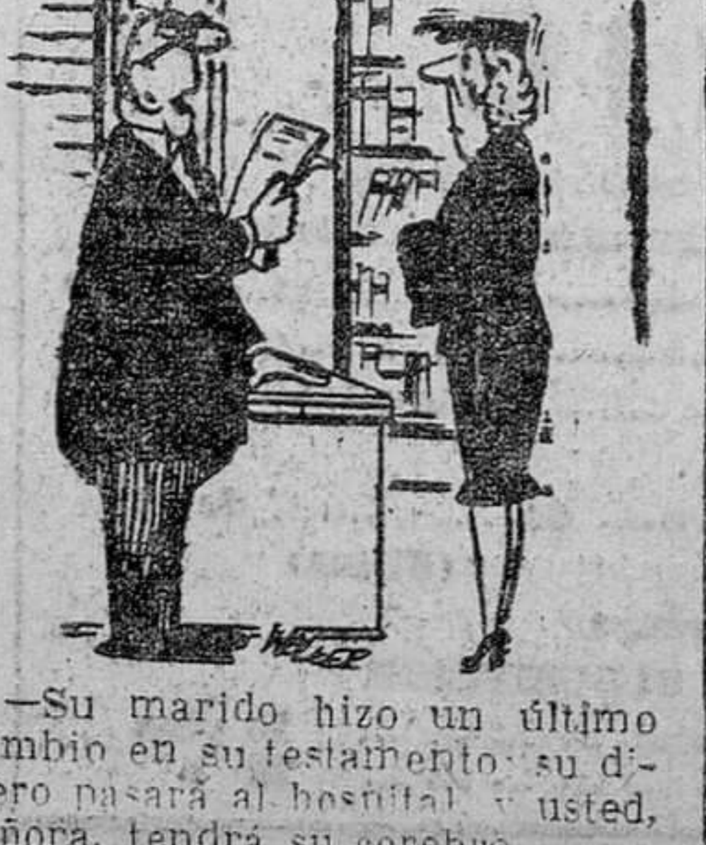
—Su marido hizo un último cambio en su testamento: su dinero pasará al hospital y usted, señora, tendrá su cerebro.

Gigantesco consumo de mundo Crossman —como Galbraith— entiende que desde la guerra a nuestros días se ha creado en los países superindustriales de Occidente un gigantesco aumento de la demanda. Gran número de esas necesidades nuevas han sido creadas artificialmente, y el dinero que consumen la sociedad y al hombre mismo. Crossman pone como ejemplo a las grandes compañías constructoras de automóviles, cuya gran producción masiva acelera, en el fondo, el poderío unilateral de estas industrias. Bueno será decir en este tran-