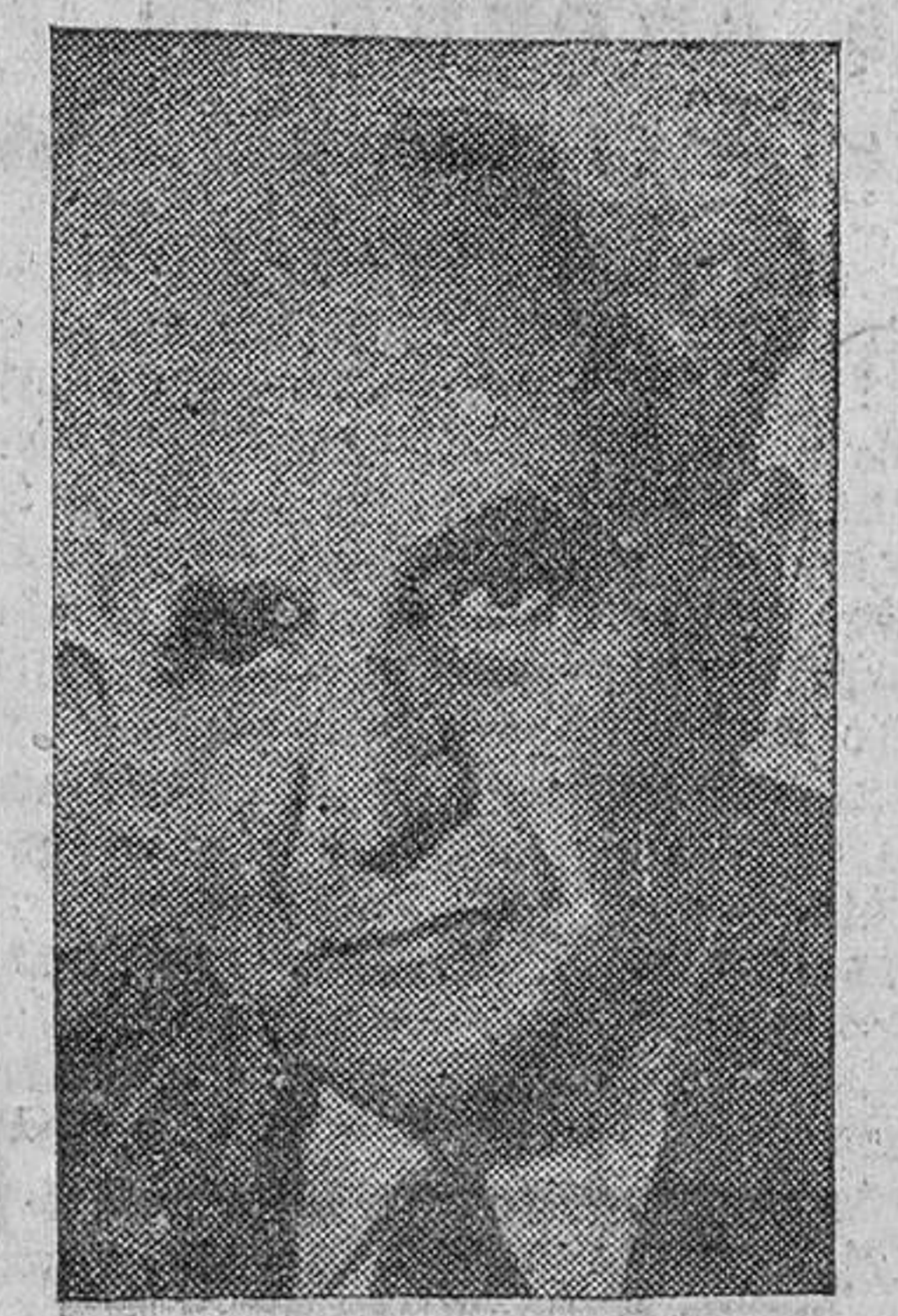
Ben Gurion, no quiere asegurarse.

En Teherán, la peor propaganda que los adversarios del Sha hacen desde hace algún tiempo es la de difundir la noticia, aparecida en un gran periódico inglés, según la cual el emperador, su hermana, su madre y su hija habían contratado importantes seguros en previsión de la caída de la monarquía persa.