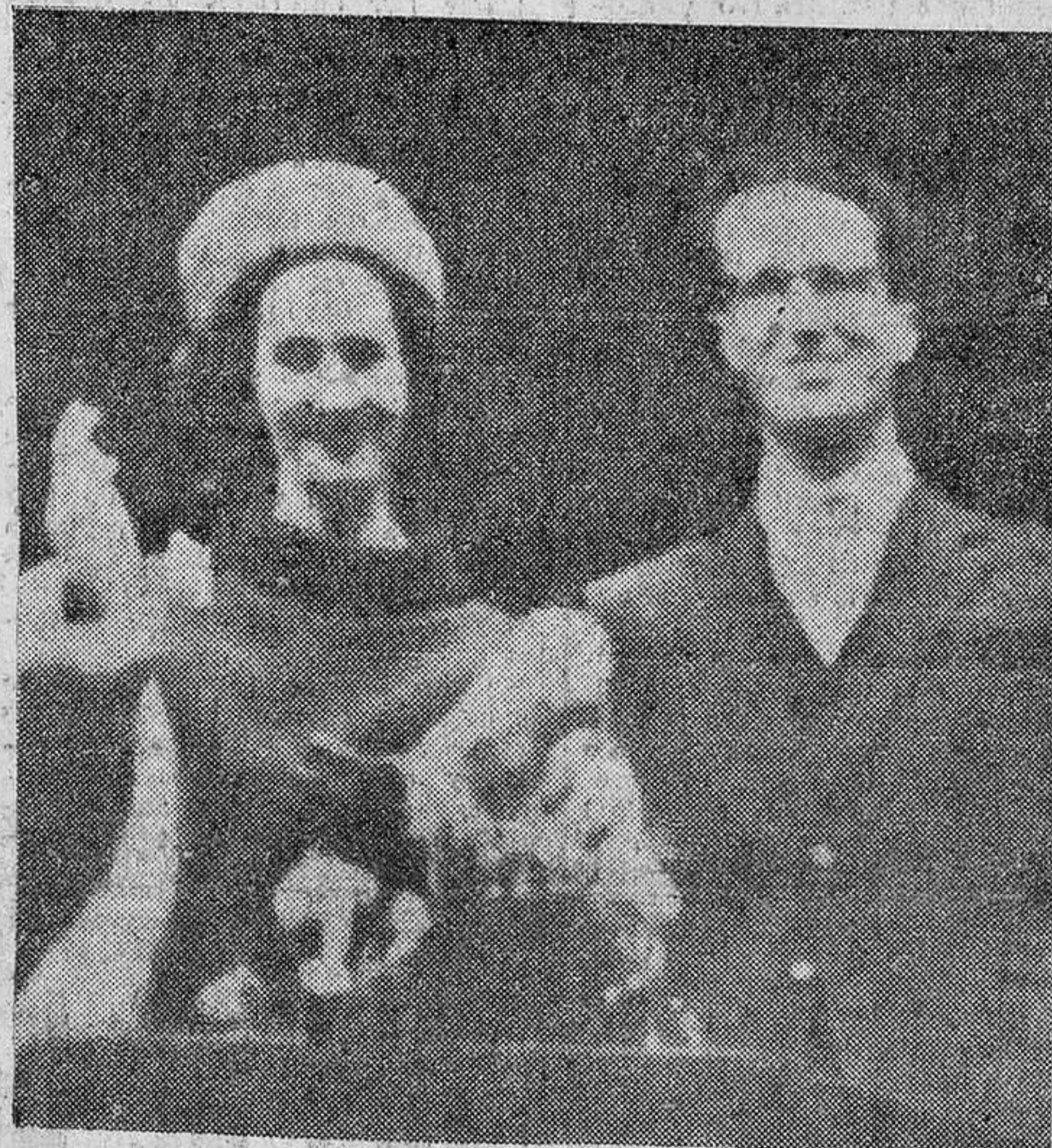
El rey Balduino presenta a su prometida, Fabiola de Mora, al pueblo de Bruselas, desde el balcón del Ayuntamiento.