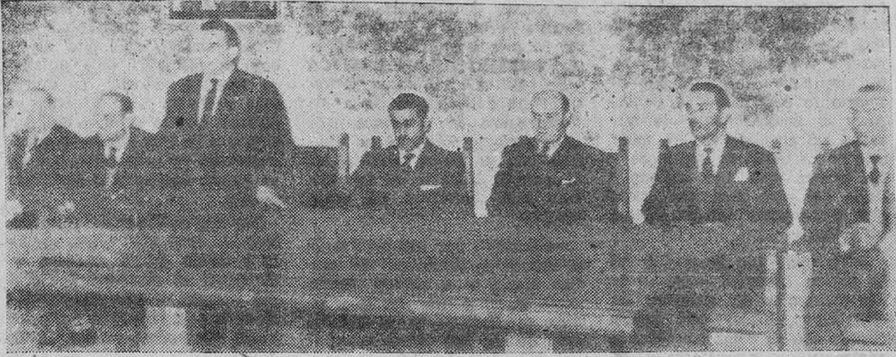
La presidencia del acto durante la intervención del Delegado Provincial Sindical.