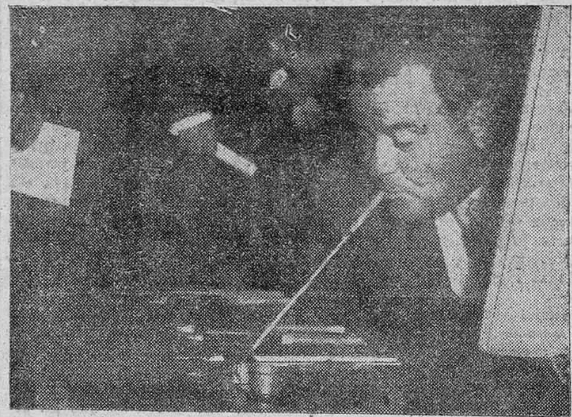
La caries dental es la amenaza que pesa sobre quienes manejan los pinceles valiéndose de la boca.

La Asociación Internacional "Artis Muti" reúne treinta pintores de dieciocho países Sin brazos o imposibilitados de ellos, realizan sus obras valiéndose de la boca y de los pies