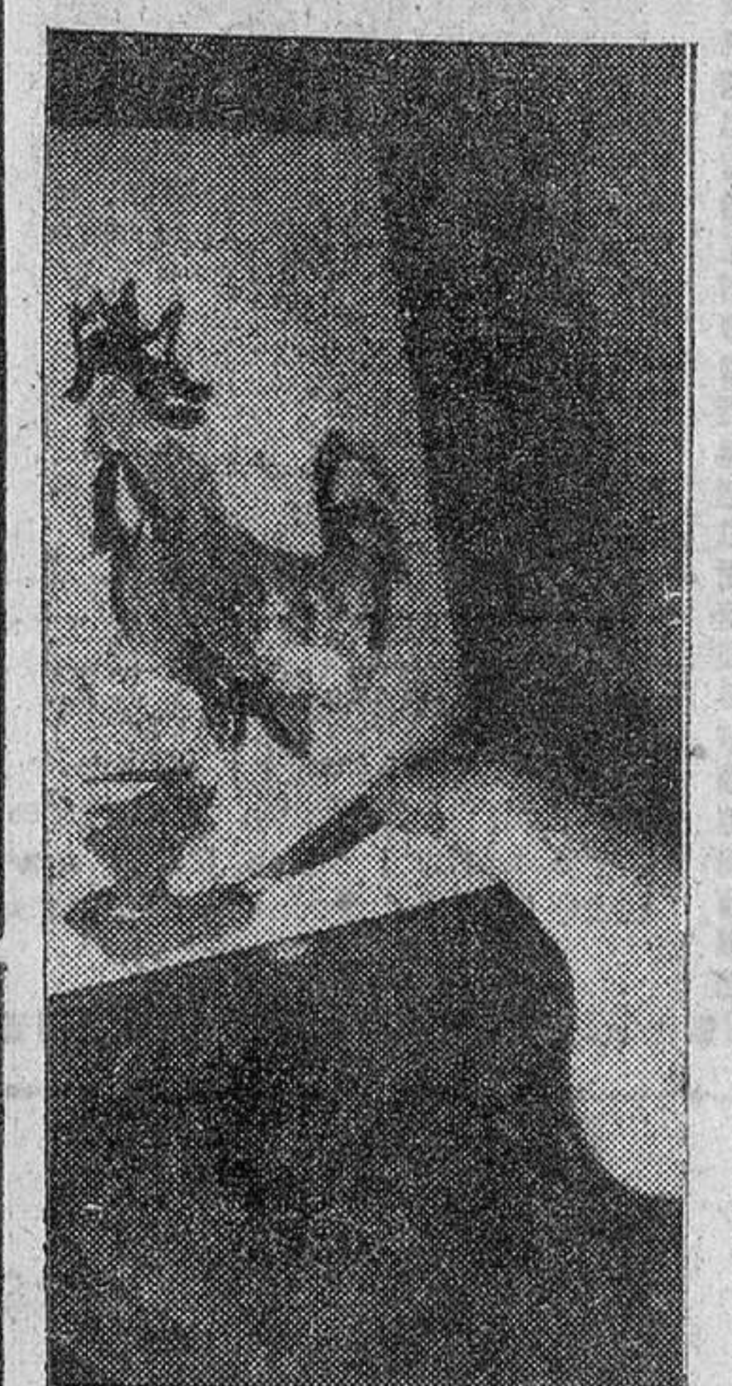
He aquí un ejemplo de la extraordinaria habilidad de estos pintores. Pintando con el pie...