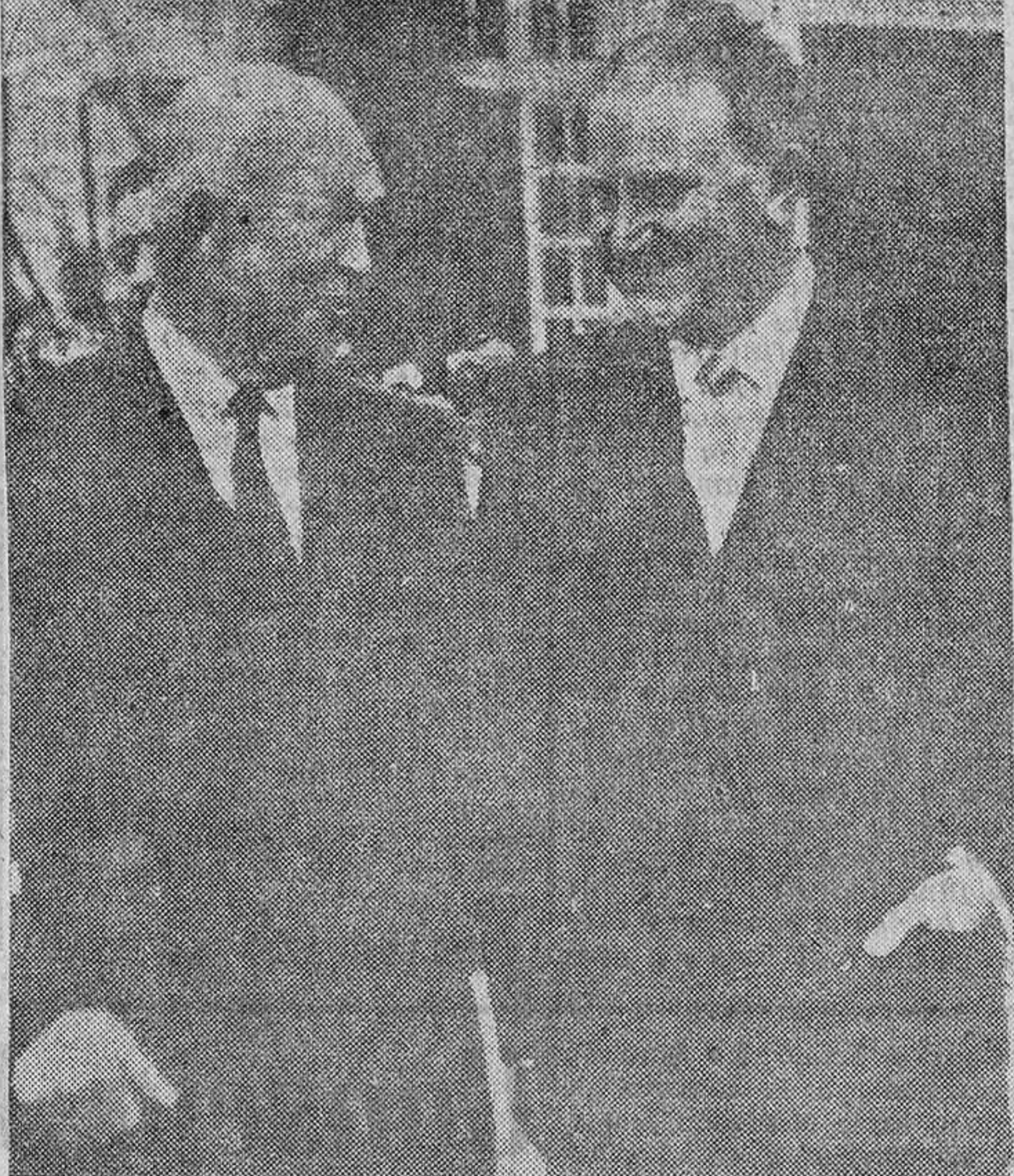
EISENHOWER Y CASTIELLA