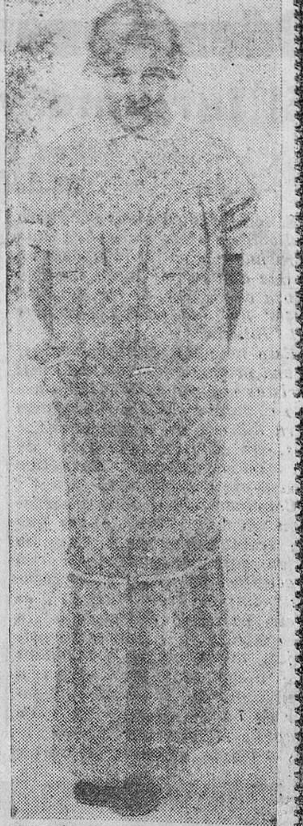
Original bata de algodón estampado, para levantarse de la cama. La comodidad y la elegancia siempre se da la mano en el algodón.

La vida se repite y como cada año, febrero nos trae la ya tradicional Quincena Blanca del Algodón, que viene a ser la puerta por donde entran en nuestro hogar los tejidos que, es preciso renovar después de un año entero de uso y desgaste. Pasada ya la euforia navideña, en llegando febrero es la serenidad del «blanco» la que invade los comercios, tirando los angeles, Papas Noel y demás alegorías, en sólidas montañas de piezas de algodón.