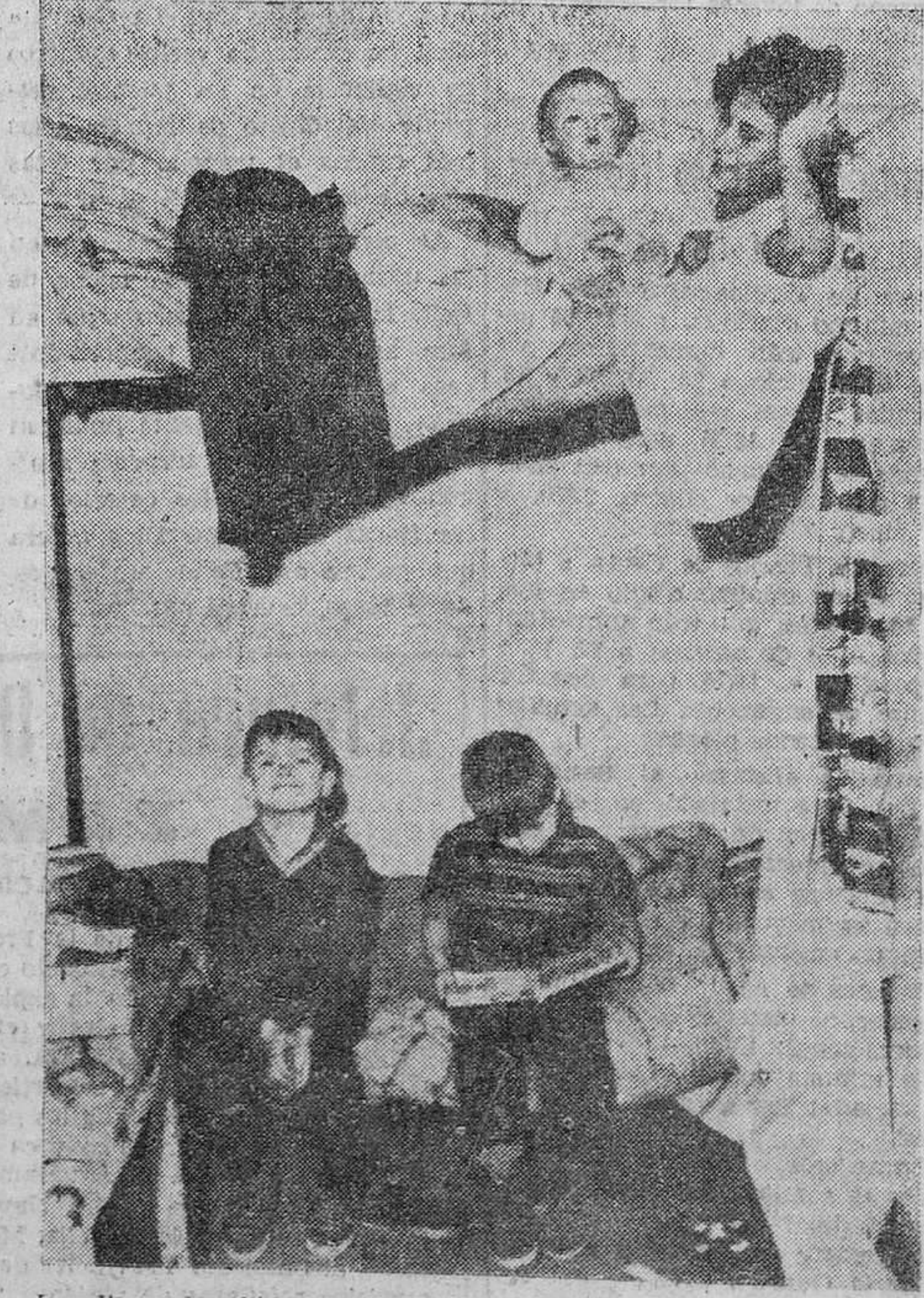
Los llamados "intrusos" de Saint Sylvestre, en Francia, que fueron expulsados de un edificio recién construido en Issy-les-Moulineaux, donde se había introducido al no tener donde alojarse cansados de esperar en los provisionales "Centros de alojamiento" sus demandas de techo, han terminado por construir barracas como la que se ve en la escena familiar de la foto. Una nueva expulsión les amenaza.