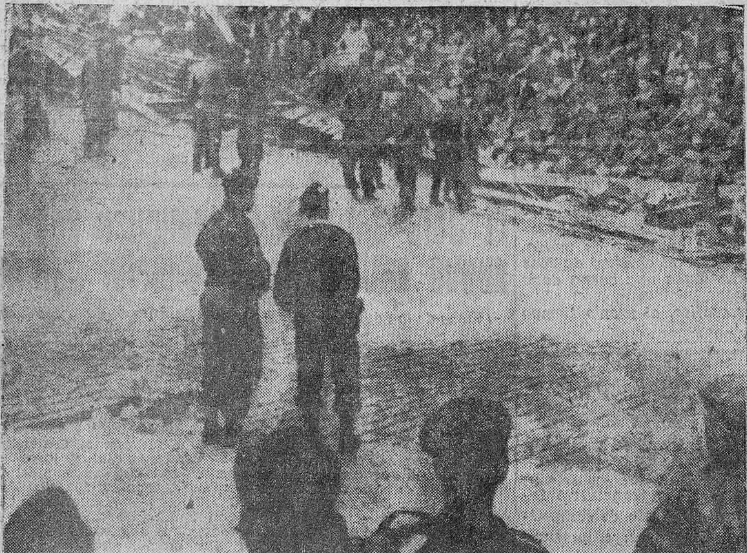
Soldados franceses (paracaidistas de la Legión Extranjera) ante las barricadas levantadas por los soldados en Argel.