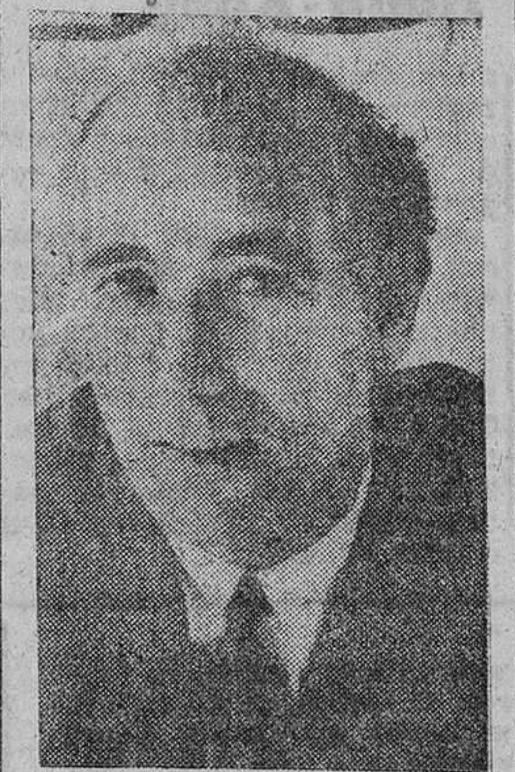
José María Gironella, autor de "Los fantasmas de mi cerebro"