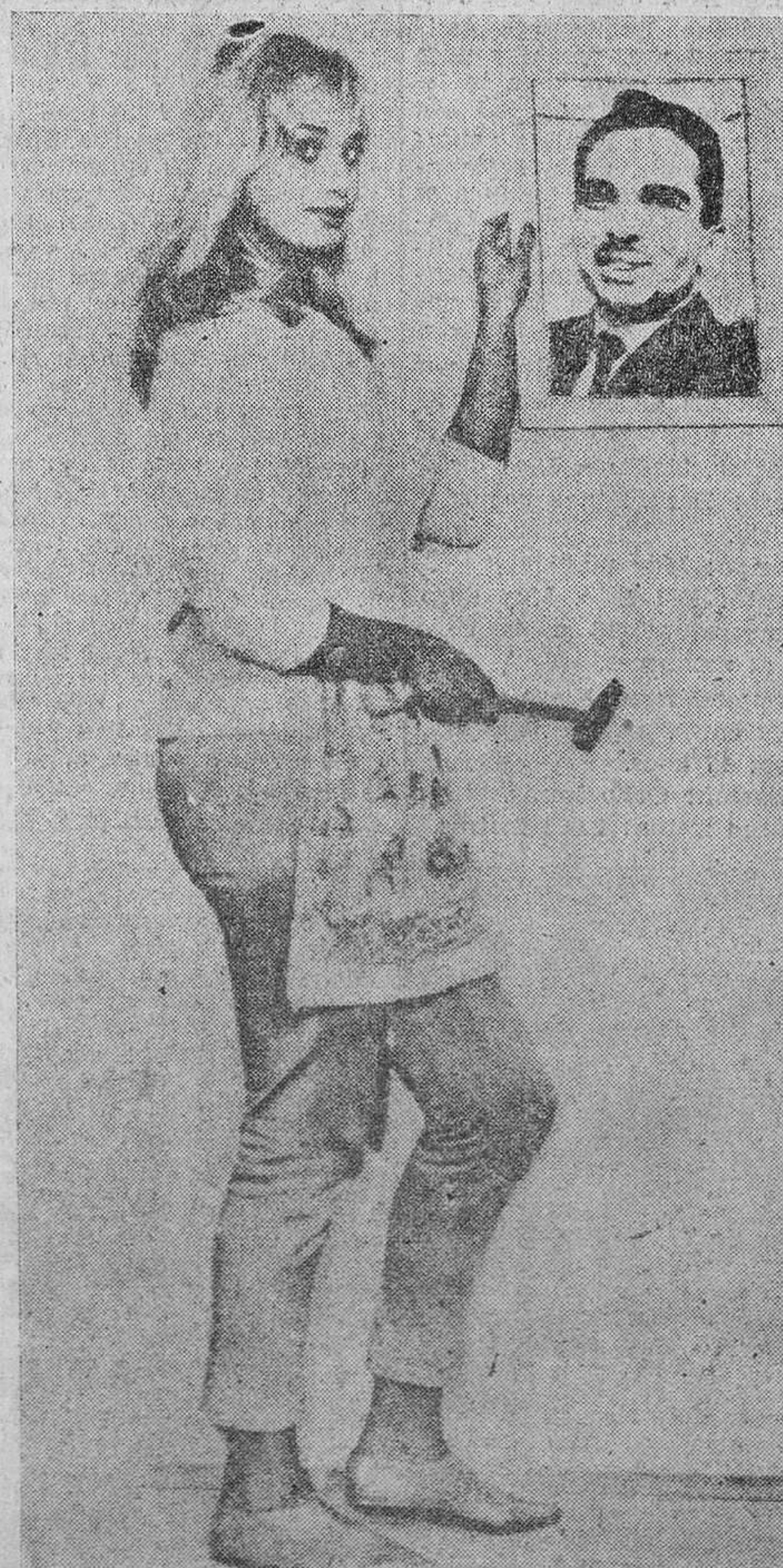
El rey Hussein de Jordania acaba de decir a un periodista que la separación de la reina Dina constituyó el mayor disgusto de su vida. Ello confirma la tesis de este reportaje. Pero se habla mucho de que la actriz Bárbara Valentin pudiera sustituirla en el corazón del Monarca. Se conocieron en Múnich, y ella insiste mucho en el pretendido... Se sabe que debería a Farah Diba y le gustaría seguir sus pasos.

A pesar de todos estos inconvenientes que limitan considerablemente el libre desenvolvimiento del visitante, la Inturist conoce perfectamente el hecho de que los viajeros van a acudir a la Unión Soviética, cada vez en mayor número. Como no, si siempre existirán personas que solamente observarán el portentoso detalle de que la pensión completa diaria en un lujoso hotel a orillas del Mar Negro solamente va a costarles noventa pesetas... y sin propinas, ¡claro!