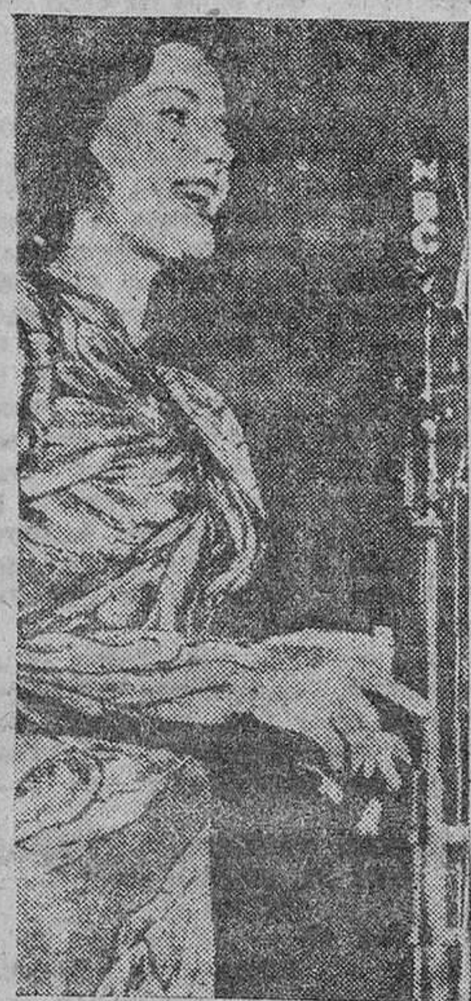
Jane Russell ante el micrófono: medio millón de pesetas.

para hablar así. Cuando llegó a Barajas el aeropuerto era una gran pista de hielo y la carretera hasta llegar a Madrid se hallaba cubierta por una espesa capa de nieve. SU PRIMER VIAJE En su primer viaje a España, a principios de este año pasado, al llegar a Madrid, en pleno mes de febrero, brillaba un espléndido sol. Recuerdo que comimos con ella y un numeroso grupo que presidía el hotelero Hilton en un mesón de las afueras de Madrid al aire libre. —Al llegar a El Cairo no hacía allí mucho mejor tiempo. —Iban a la capital de las pirámides a inaugurar un hotel de la famosa cadena Hilton. —La idea que me llevó de Madrid era muy sencilla, pero muy agradable. Estuvimos apenas veinticuatro horas. Sin embargo, tuvimos tiempo de conocer algunas cosas y, sobre todo, de divertirnos.