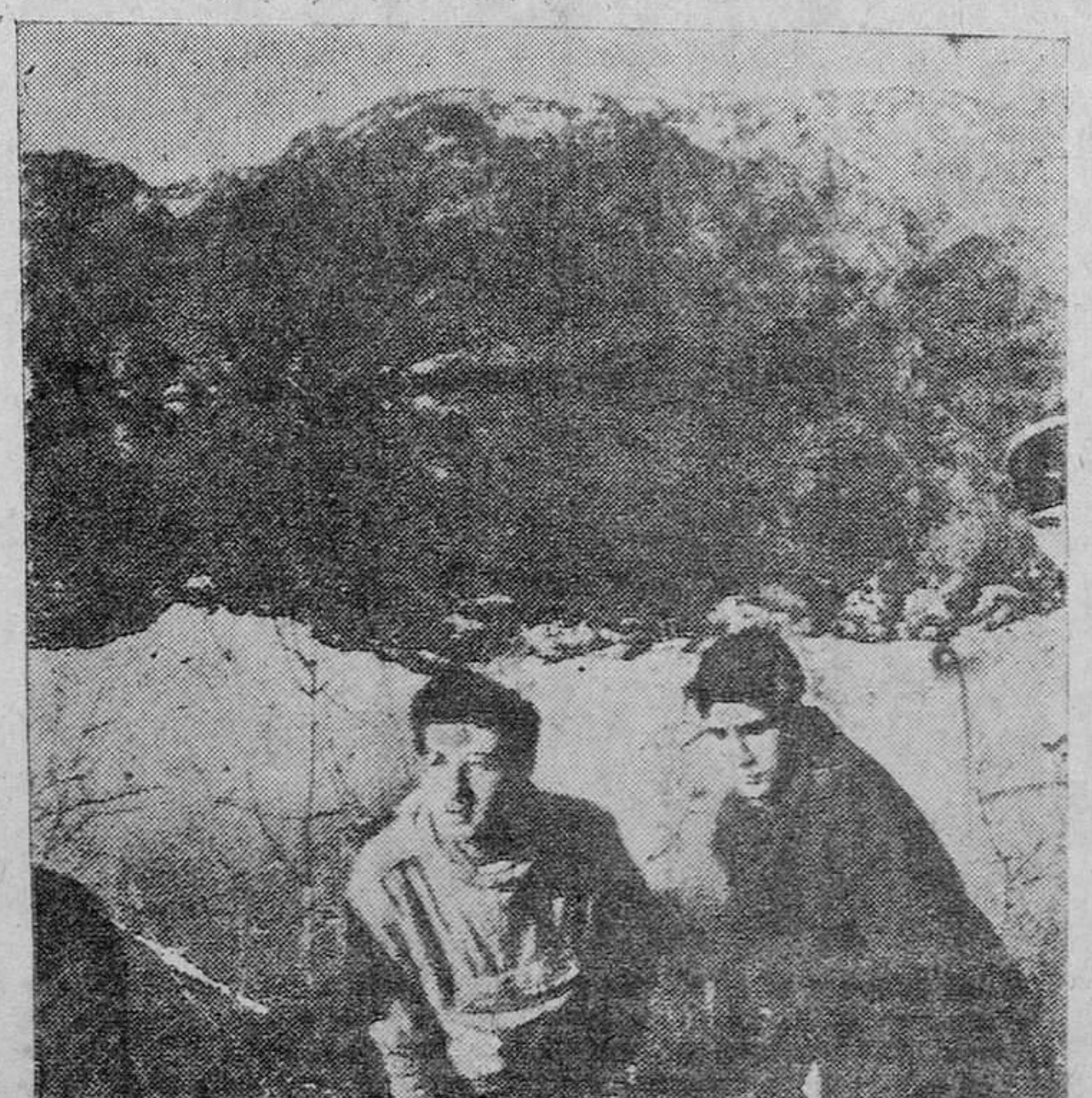
EN EL LAGO DE SANABRIA

Llegan antes a poder de sus destinatarios las cartas dirigidas a Madrid o Barcelona que llevan, a continuación del nombre de la población, el núm. de su distrito postal