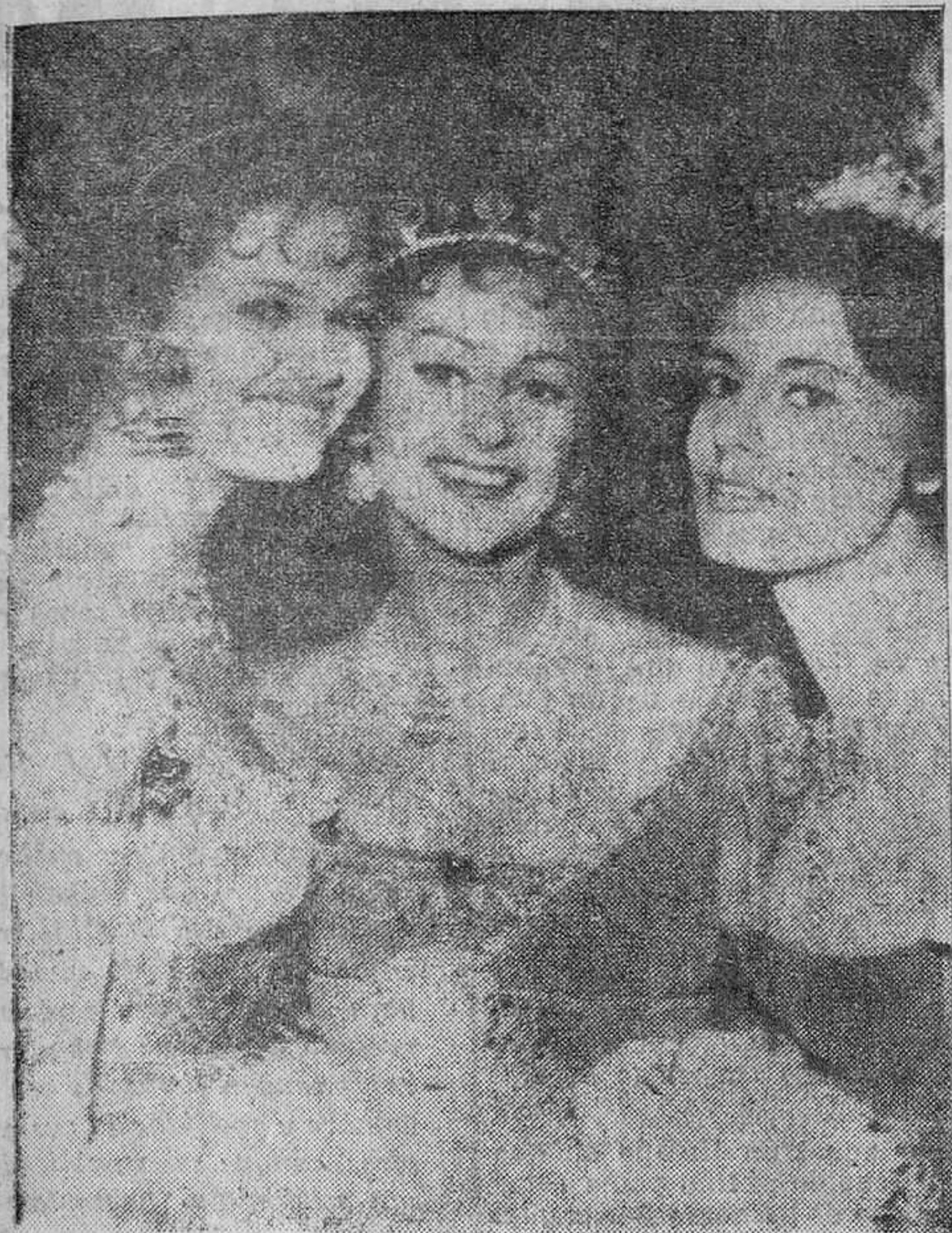
El director francés Abel Gance, dirige en París su película "Austerlitz". El papel de la emperatriz Josefina es encarnado por la actriz Martine Carol. En la fotografía, la bella estrella sonríe rodeada de las hermanas del emperador, Napoleón.