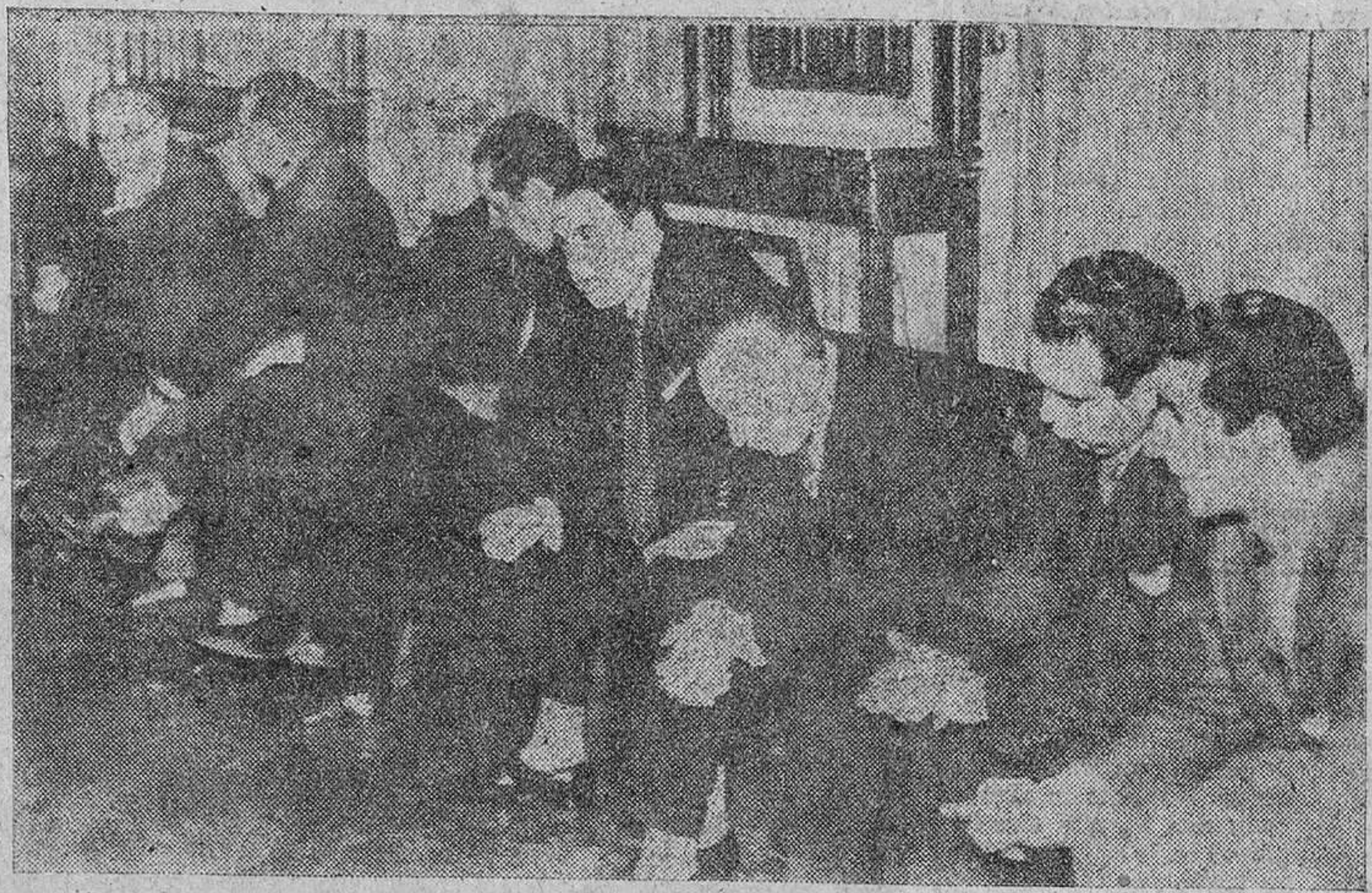
Sentados en los bancos destinados al público del salón de sesiones aparecen aquí los señores asistentes a la reunión convocada por el Alcalde.