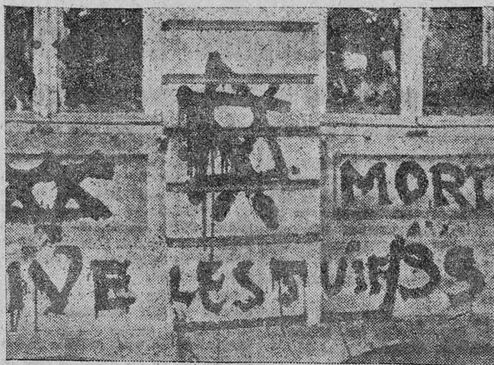
Estas son algunas de las inscripciones antijudías aparecidas en muchos puntos del mundo.

LLAMAMIENTO DE RADIO VATICANO PARA QUE SE PONGA FIN A LA DISCRIMINACION DE RAZAS