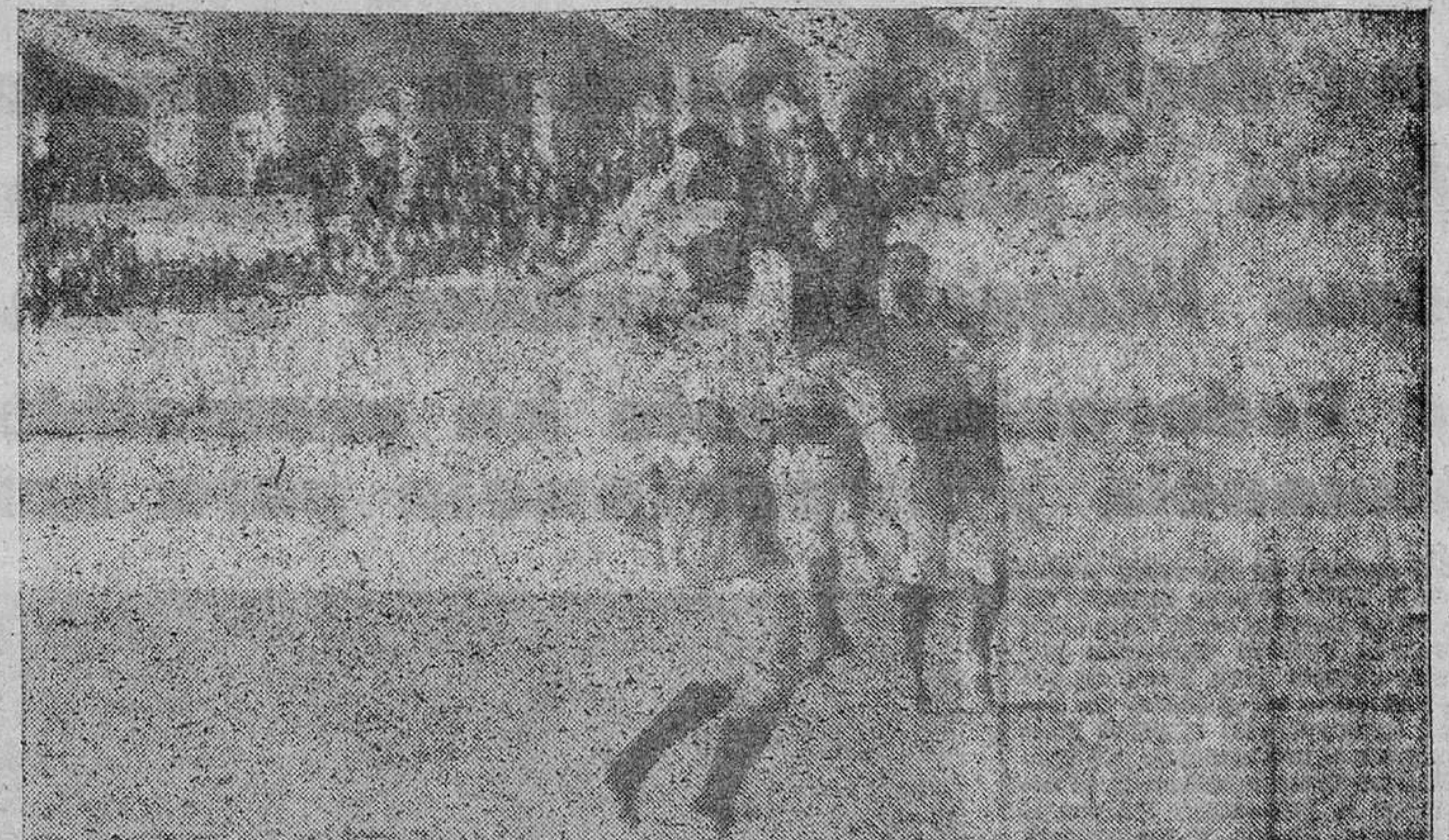
La obra feliz de la delantera rojiblanca hizo que el meta visitante tuviera bastante trabajo. Ha ta V. Díaz, que apenas suele penetrar en el área chica, se permitió el lujo de atacar al portero del Hullera, tal como puede apreciarse en la presente «foto» de Suena.

Un servidor de ustedes, recordando esta proeza del equipo zamorano, se preguntaba el domingo, poco antes de iniciarse la contienda: ¿Será capaz el Atlético de obsequiarnos en estos momentos con un partido igual o parecido?... Afortunadamente, hay que decir ahora que el Atlético nos brindó un encuentro auténticamente sensacional, aunque tuviera un corte muy distinto al jugado en Santa Lucía. El jugador allí vino a ser la fauna emocionante y angustiosa del torero que desbordó la razón con un valor enorme, a fuerza de empujar con el corazón, de actuar con una entrega absoluta, con una generosidad extraordinaria, sin espantos, ante el infierno de los pitones del toro... Y el jugador aquí hace cuarenta y ocho horas, ha sido como una fauna de sensacional rumbo, de clase y calidad. Pura cátedra de acción clásica, tiro de texto... Sobre la «cazuela» del campo deportivo de la cuenca minera de Santa Lucía, el Atlético «toreó» el estilo del «Lirio», pongamos por ejemplo; en el Estadio de la Avenida de Ramiro Ledesma arosó las maneras sabias de Antonio, el hijo de don Cayetano, el de Ronda... ¡Lástima que entre ambos acontecimientos el equipo zamorano se portara en varias ocasiones como vulgar «matador»!