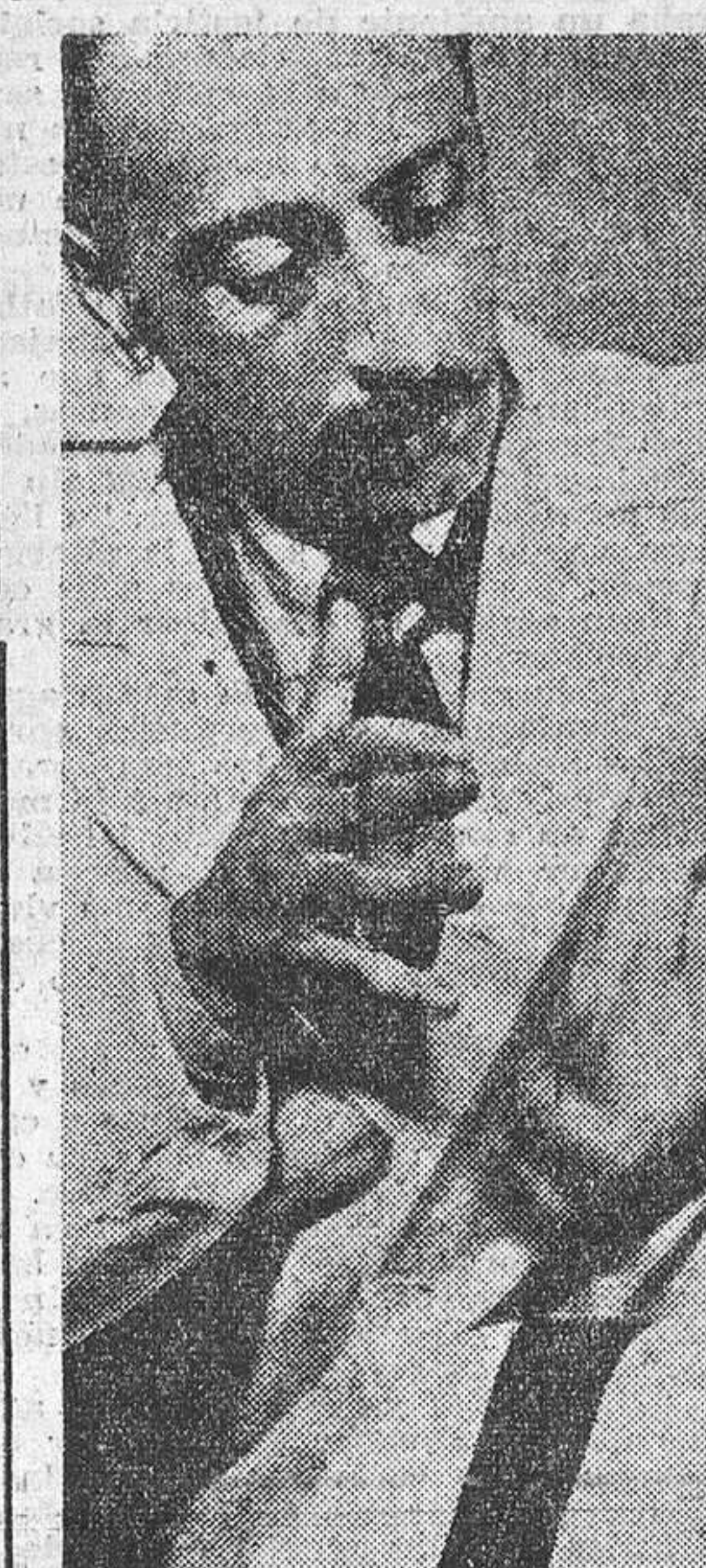
La sugestión, arma de algunos especialistas con sus pacientes.

plias mujeres le cubren de injurias: la campaña de calumnias ha sido tal, que aquellas desdichadas le hacen responsable de los peligros que corren. El 20 de marzo de 1849 es destituido por segunda vez.