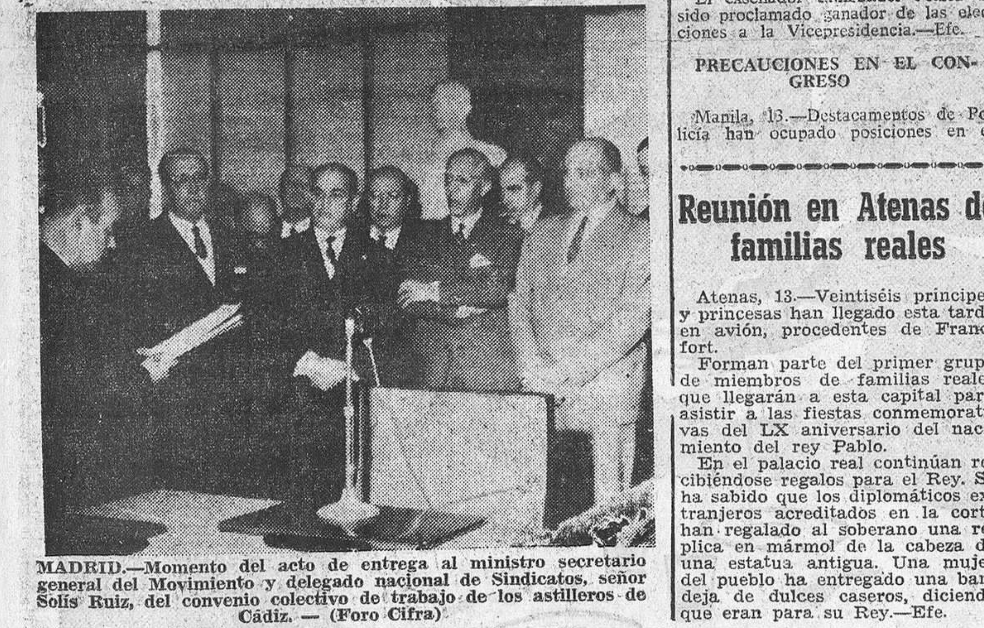
MADRID.—Momento del acto de entrega al ministro secretario general del Movimiento y delegado nacional de Sindicatos, señor Solís Ruiz, del convenio colectivo de trabajo de los astilleros de Cádiz.