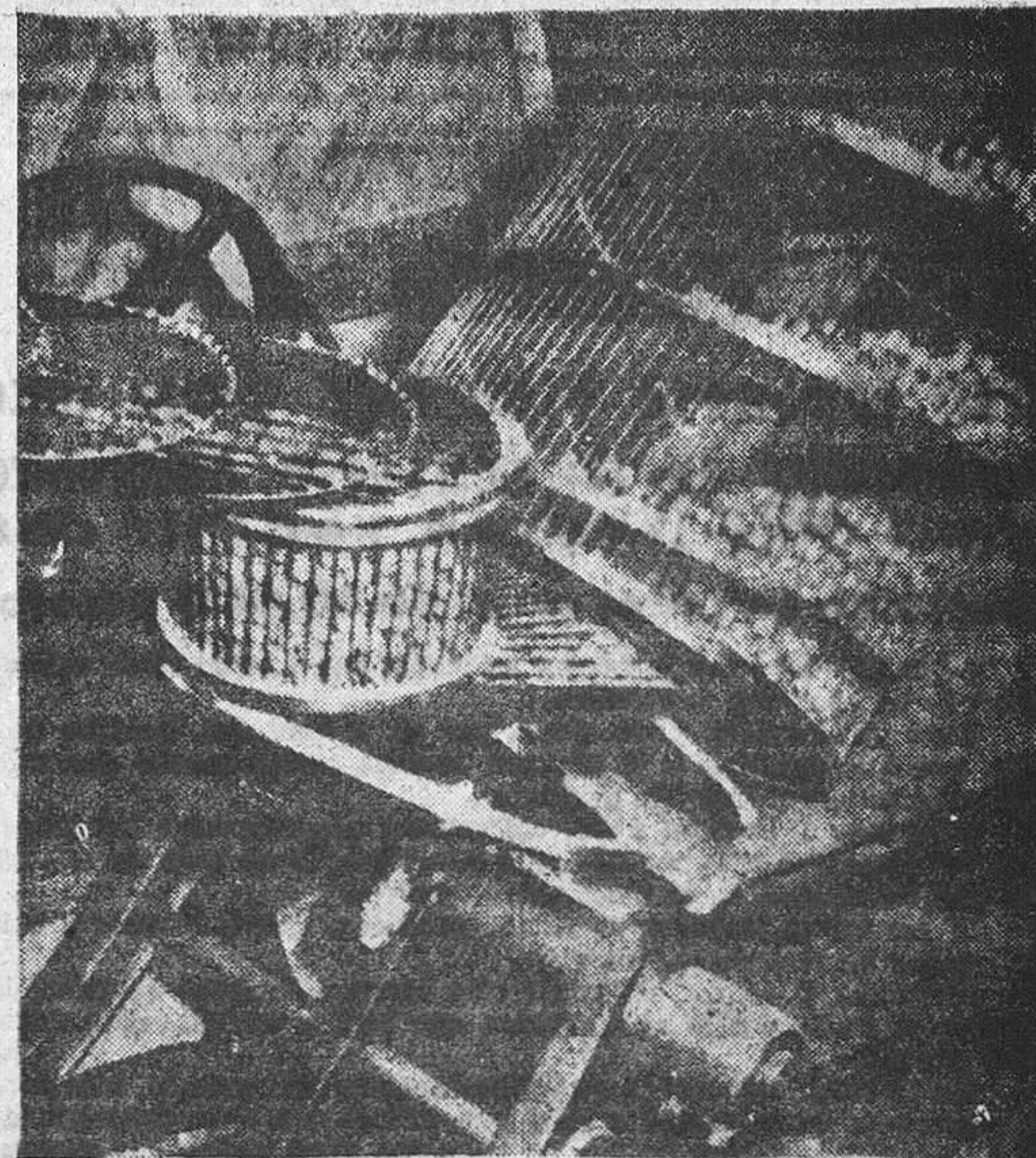
Espirál por la que ascienden las bolas de los números al bombe.