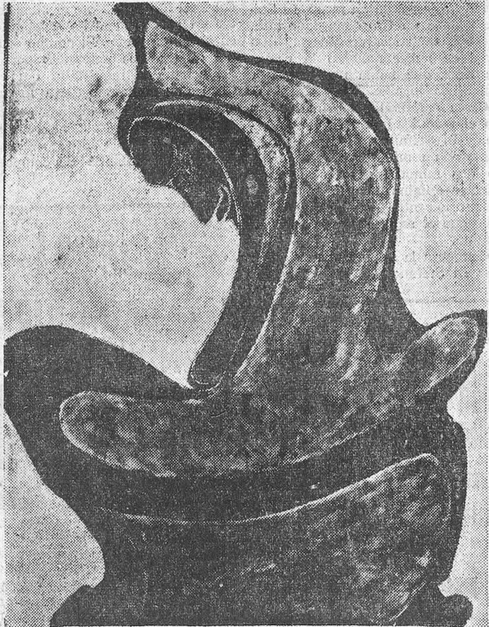
«PERSONAJE ENCOGIDO».—(Foto PYRESA).