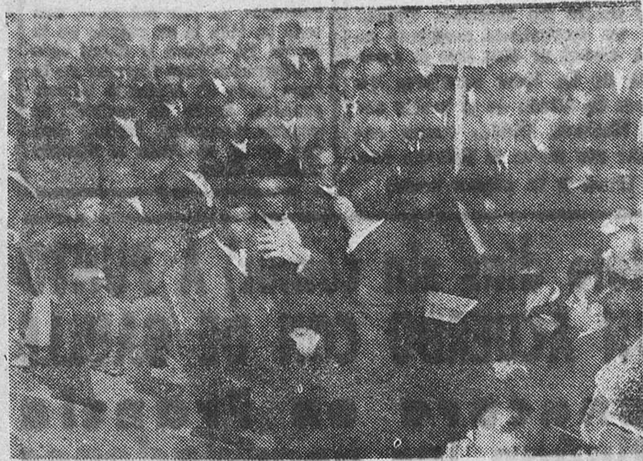
El Vicesecretario de Obras Sindicales habla a los asambleístas de Benavente.

Se gestiona la constitución de otras diecinueve cooperativas en la provincia