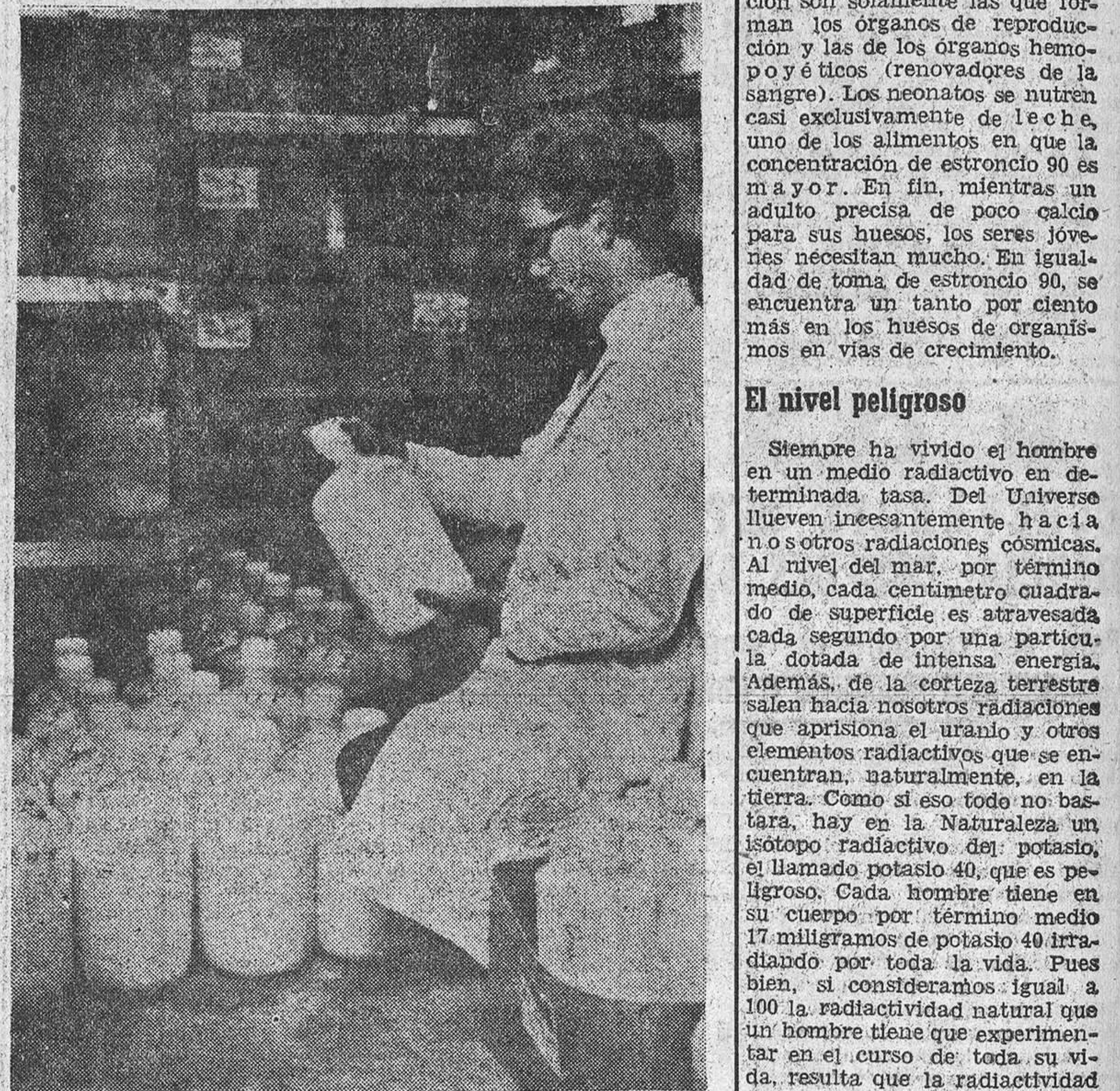
A diario, la oficina de radiología del Ministerio de Agricultura británico recibe 300 botellas de leche, provenientes de todas las regiones de las Islas. Las botellas son sometidas al contador "Geiger" para ver si el grado de radiactividad del líquido alimenticio alcanza altura de peligrosidad. La red de comprobación británica está considerada una de las mejores del mundo, hoy por hoy.