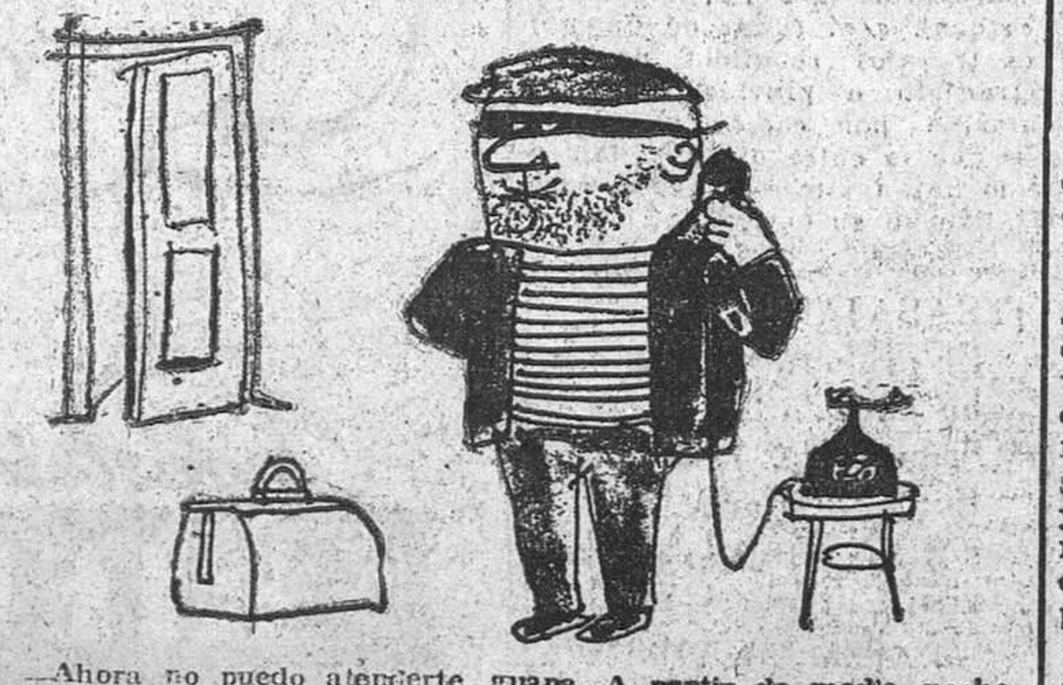
—Ahora no puedo atender, guapo. A partir de media noche, llámame a la Banca del Comercio.