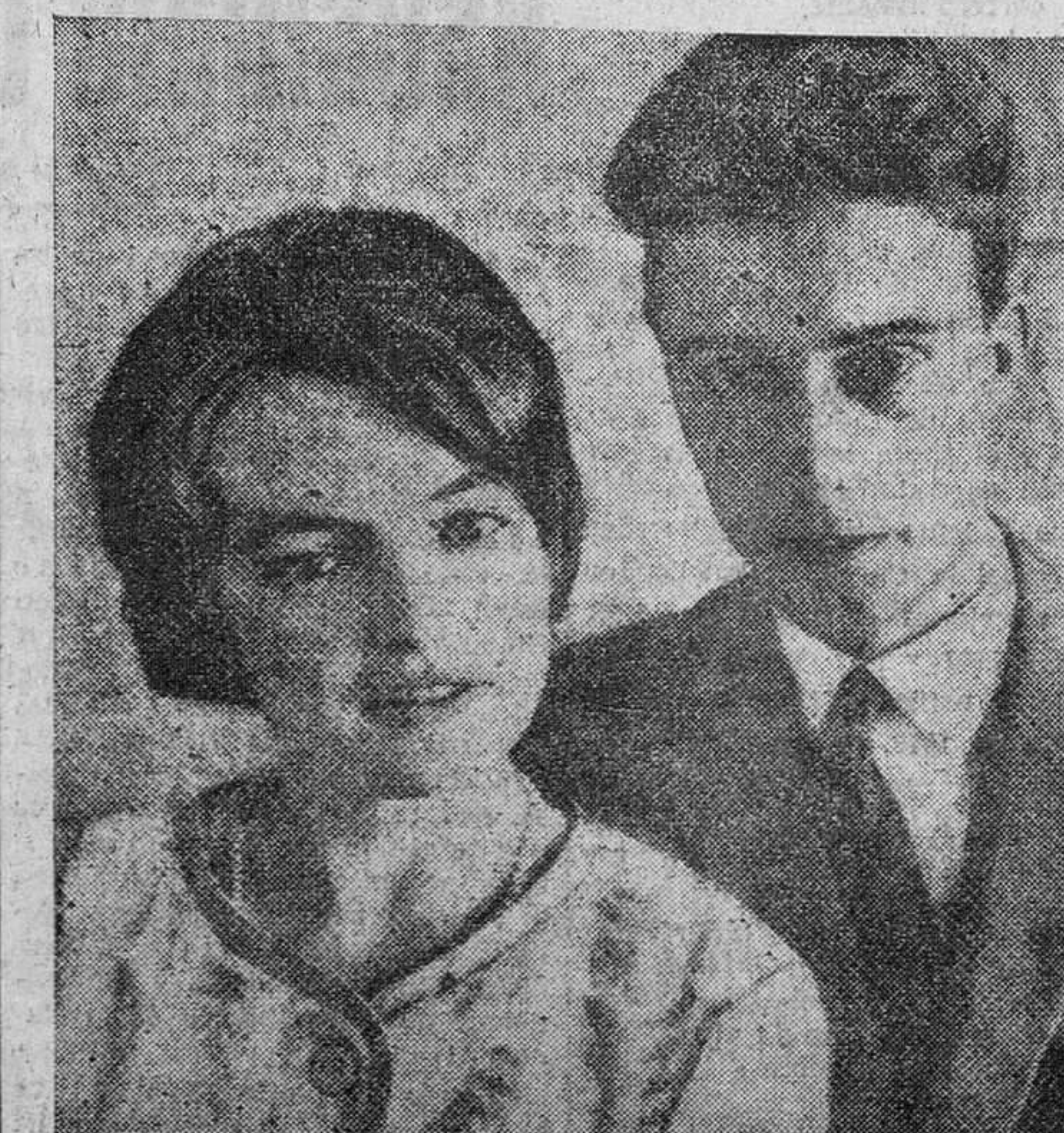
La princesa Diana de Francia, tercera hija de los condes de París, con su primo y marido, el príncipe Karl de Wurtemberg.

Friedrichshafen (Alemania occidental), 2.—Ha dado a luz un niño la princesa Diana, esposa del príncipe Karl de Wurtemberg. La princesa Diana es hija del Conde de París y contrajo matrimonio con el Príncipe el pasado mes de julio.—Efe.