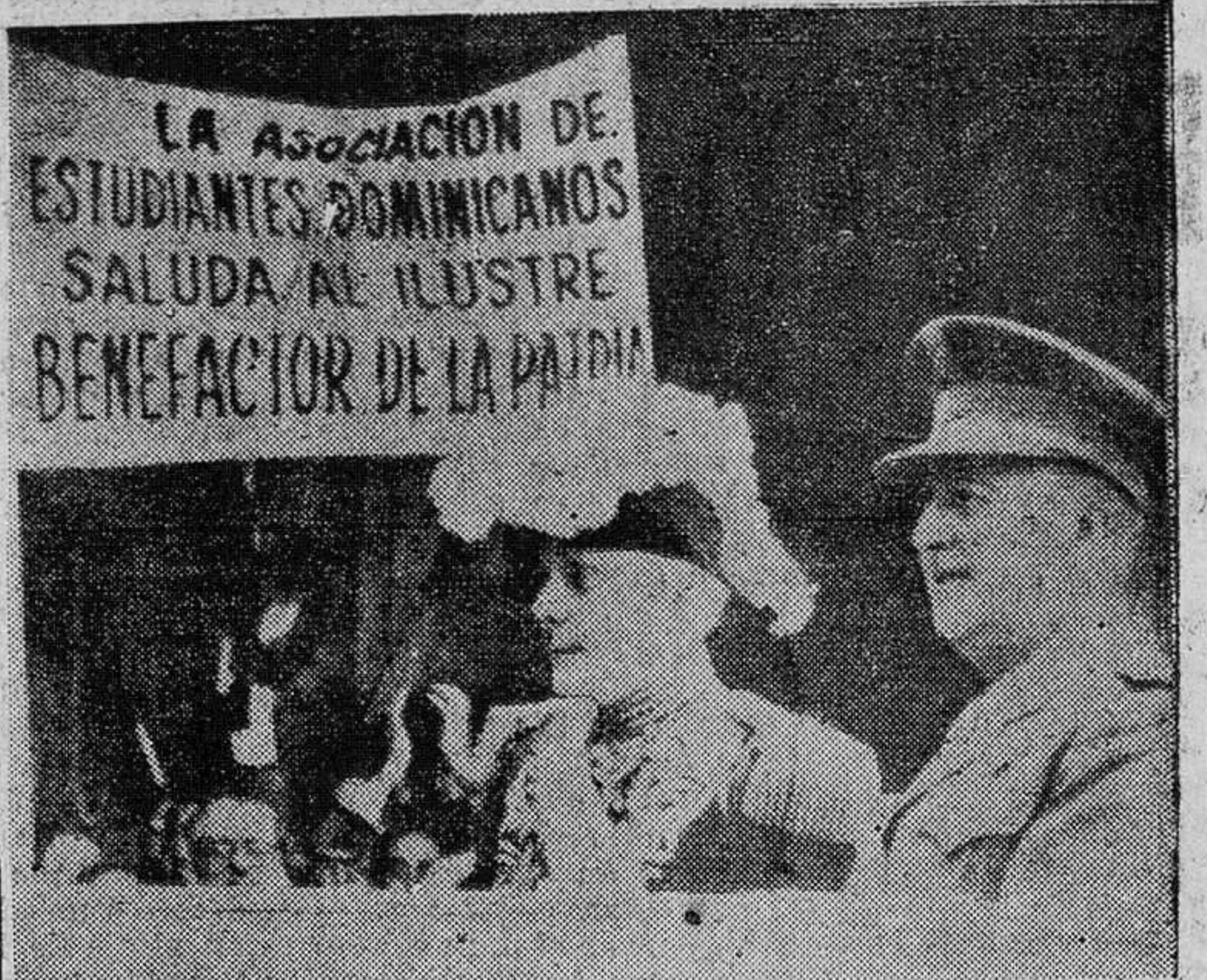
El Generalísimo Trujillo y el Generalísimo Franco desfilan por las atestadas calles de Madrid, camino hacia el Palacio de la Moncloa, donde residió Trujillo durante sus doce días de permanencia oficial.

En cuanto al General Heureaux, quien vino más tarde, poco bueno puede decirse que no sea que él fue poderoso, astuto y guapo. Sus admiradores, y tenía muchos, afectuosamente le llamaban "Lilís". Era un guerrero intachable y sin miedo, un hombre de extraordinario vigor físico, y un consumado dictador que fue el terror de sus enemigos. Se decía de él que también tenía un gran atractivo para las mujeres hermosas. Sin embargo, no tenía ideas básicas de cómo gobernar una nación, y sus incansables empréstitos y mala administración hicieron que el país cayera en un marasmo financiero del cual no pudo librarse hasta que vino Trujillo. Cuando fue muerto en la ciudad de Moca, Heureaux estaba muy desacreditado y sólo una pe-