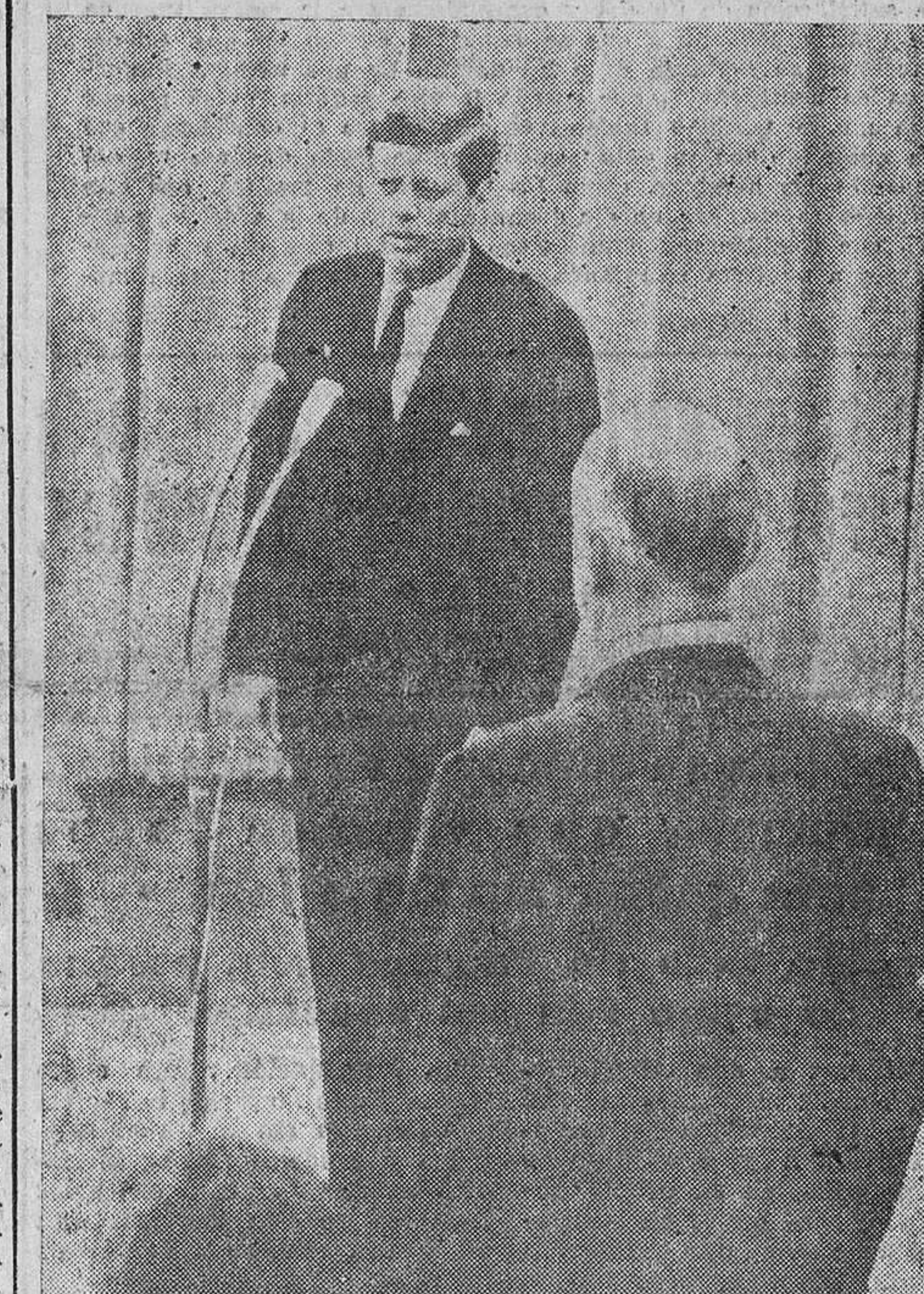
KENNEDY EN PARÍS CON EL PRESIDENTE DE GAULLE

Solamente un millar de personas se habían reunido en los alrededores de la estación cuando el primer ministro soviético salió del edificio. El presidente Kennedy no llegará a esta capital hasta mañana por la mañana, por vía aérea, poco antes de la hora