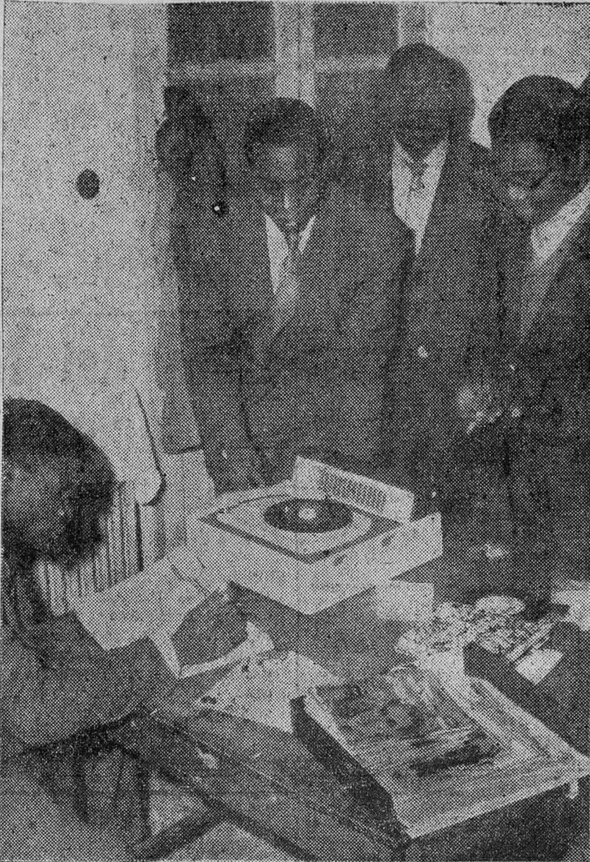
Sobre los nativos se ejercen toda clase de propagandas. La influencia europea se intenta contrarrestar desde Moscú.

La solución del problema se presenta muy difícil en las zonas donde residen grandes comunidades blancas dedicadas a la agricultura. En Argelia hay un millón de colonos; en las dos Rodesias y en Nyassa, casi trescientos mil; sesenta y seis mil en Kenya; once mil en Uganda; veintitrés mil en Tanganika. Todos estos blancos que forman el grueso de la representación europea en Africa tienen el mismo fin que los belgas en el Congo. Por ese motivo procuran con todos los medios a su alcance de retardar el advenimiento de Gobiernos africanos. Dice un inglés residente en Rodesia del Sur: "La mayor parte de los europeos se dan cuenta que algún día habrá una mayoría africana. Pero esperamos que haciendo algunas concesiones sustanciales hoy, se pueda ganar tiempo; supongamos, quince años." Afirma un dirigente africano del mismo país: "La verdadera razón hay que buscarla en la revuelta violenta. En Rodesia, los europeos no odian a los africanos como en Sudáfrica. Sencillamente, no quieren ser gobernados por los negros. Las revueltas les han convencido de que