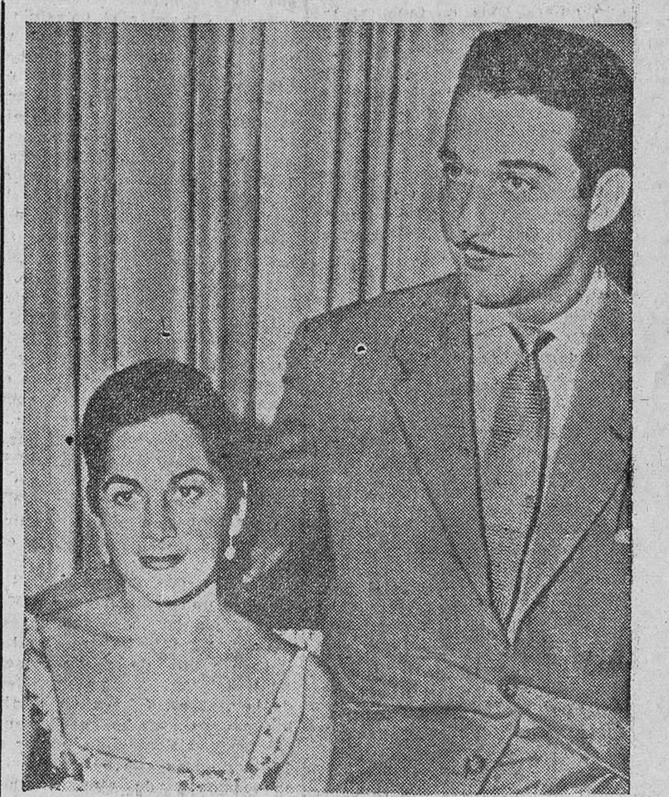
Rafael Trujillo, jefe de las fuerzas aéreas dominicanas, hijo del Generalísimo asesinado, con su mujer.

Ciudad Trujillo, 2.—El presidente de la República Dominicana, Joaquín Balaguer, ha nombrado a Rafael Trujillo (hijo) jefe de las fuerzas armadas del país. Rafael Trujillo cuenta con treinta y dos años de edad; está casado y tiene seis hijos. Cursó sus estudios militares en la Academia Militar de Leavenworth (Kansas), si bien no llegó a terminarlos.—Efe.