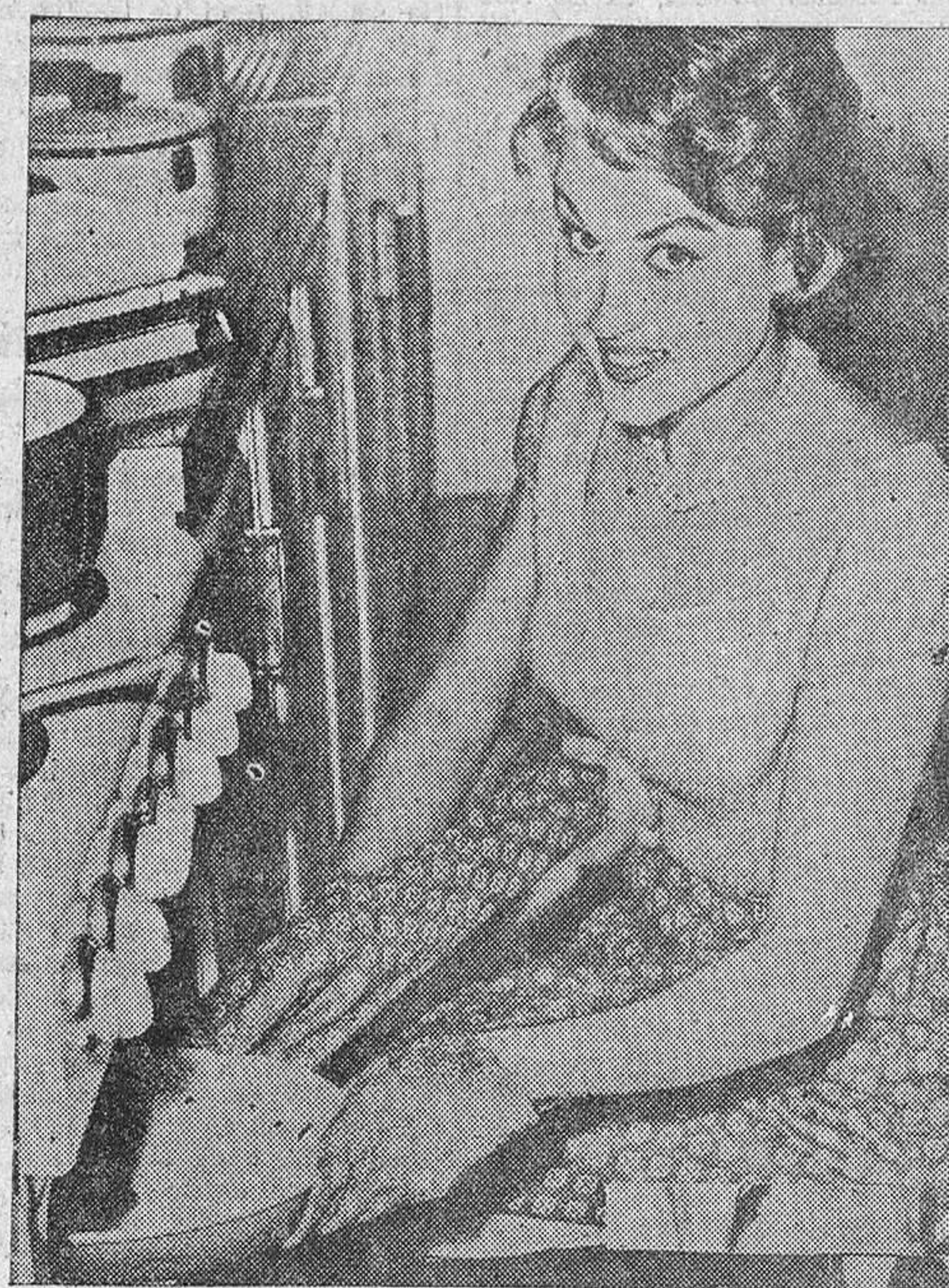
pasada un constructor de Westchester.

EMANUEL, en su modelo para noche, introduce la gran novedad de la presente temporada. El terciopelo estampado, inspirado en línea "Imperio" o "Directorio", el talle alto se acentúa por medio de una ancha faja de satén color pastel.