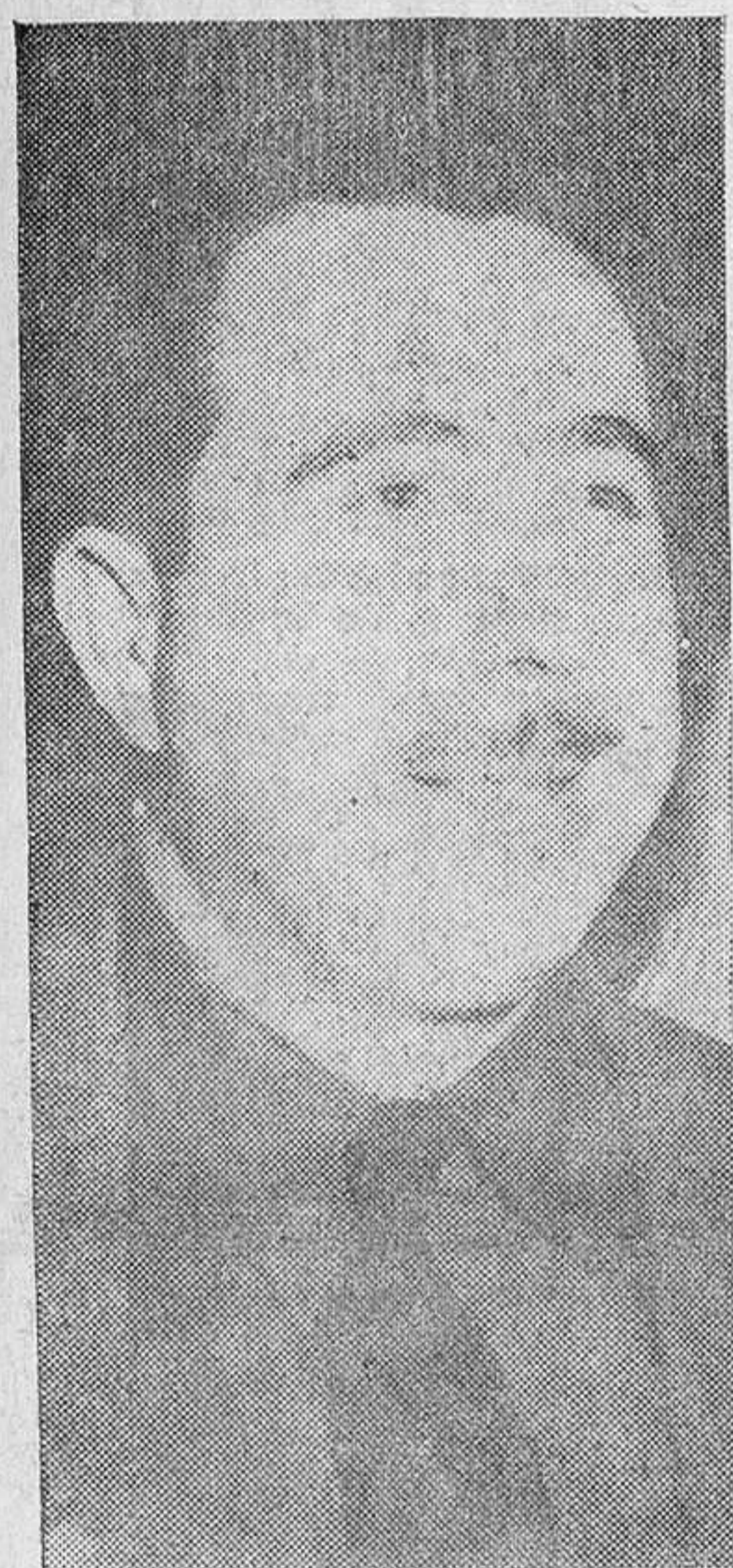
Fernando Herrero Tejedor, vicesecretario general del Movimiento.