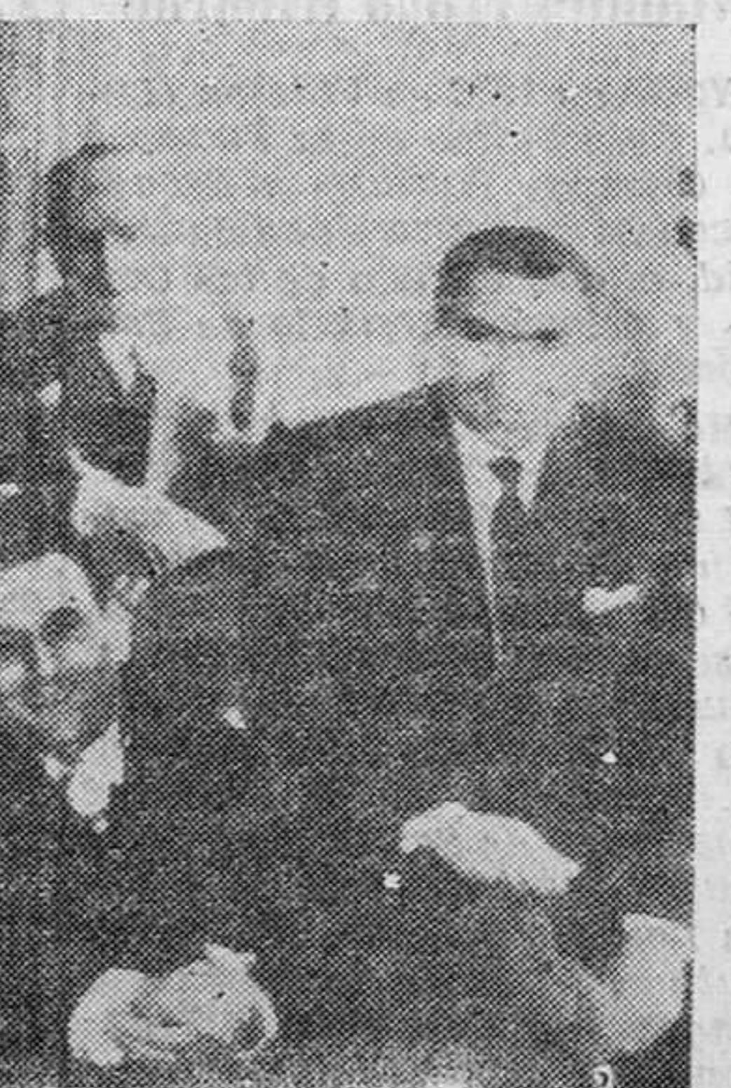
Los concejales relevados, con el Alcalde y el Secretario.