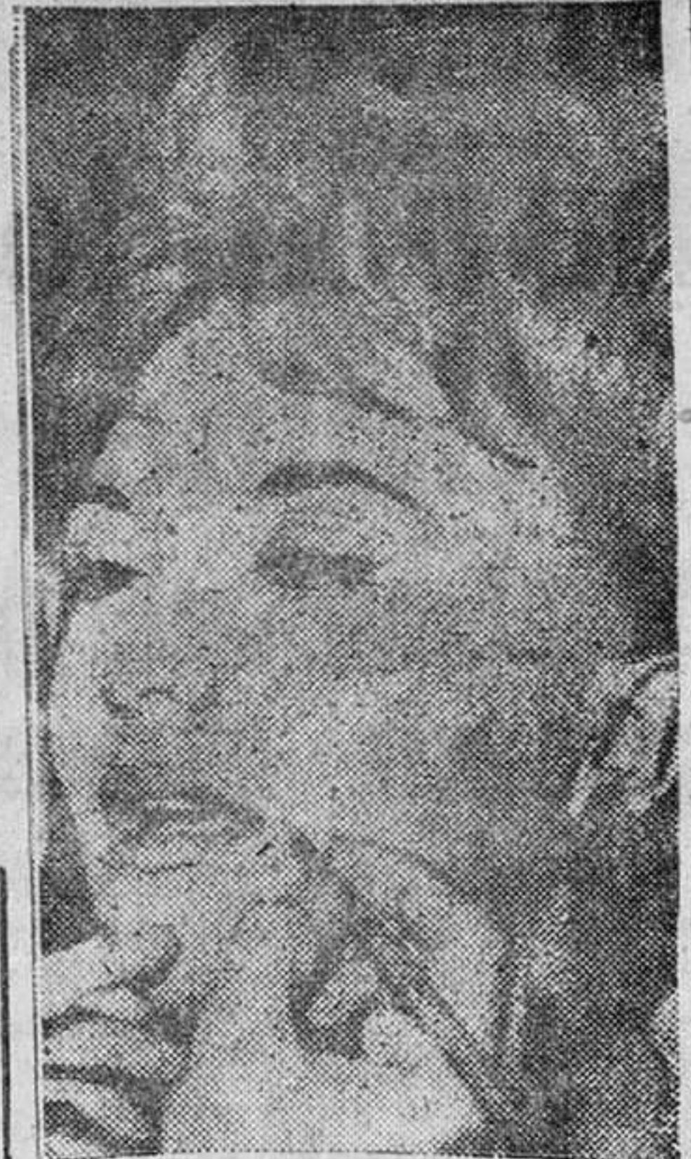
AMPARO SOLER LEAL

Entre los intérpretes se distinguieron María Amparo Soler Leal, Antonio Casas, Antonio Quipo, Agustín González y Vicente Ros. La dirección escénica ha sido realizada por José María de Quinto.