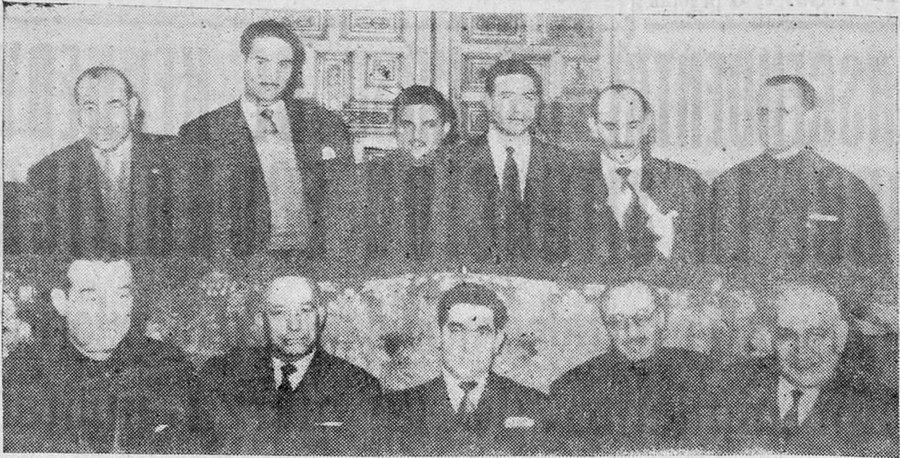
Los nuevos concejales, retratados también con el Alcalde y el Secretario.

El Alcalde dedicó cariñosas palabras de despedida a los concejales relevados y de bienvenida a los entrantes